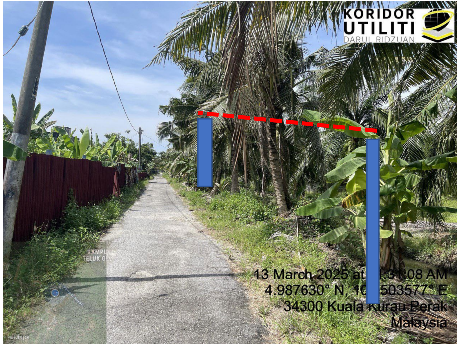
LOKASI DI JALAN KAMPUNG BARU CINA AIK HWA (JALAN GULA)