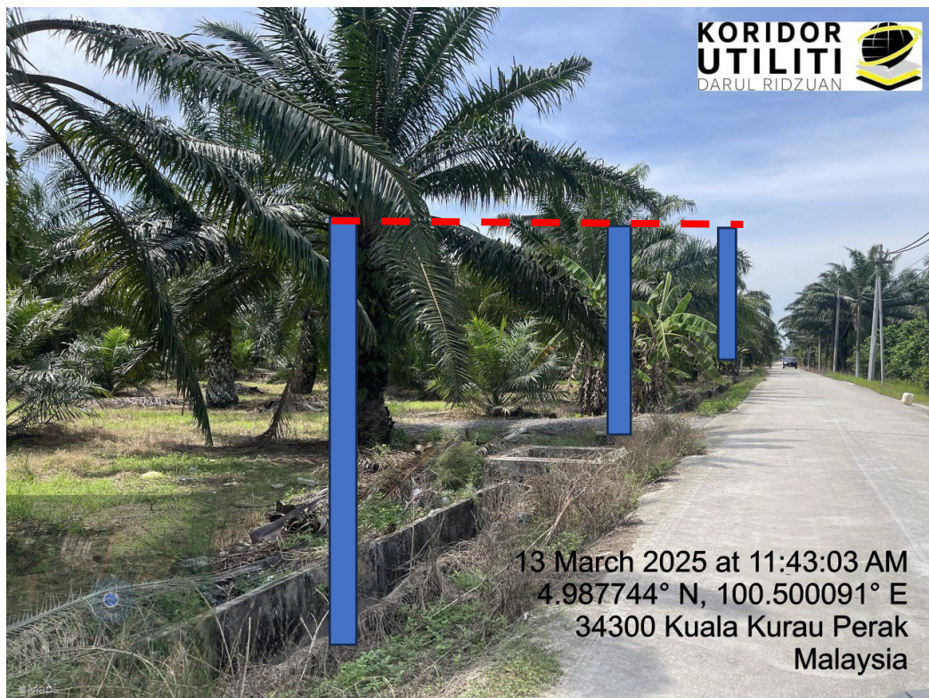
LOKASI DI JALAN KAMPUNG BARU CINA AIK HWA (JALAN GULA)