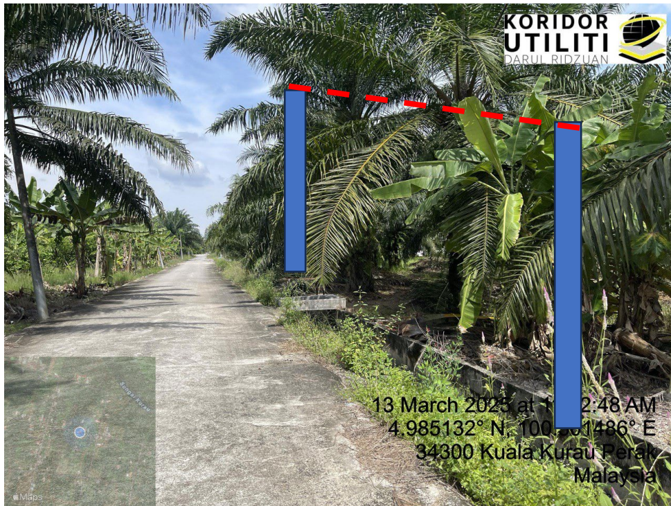
LOKASI DI JALAN KAMPUNG BARU CINA AIK HWA (JALAN GULA)