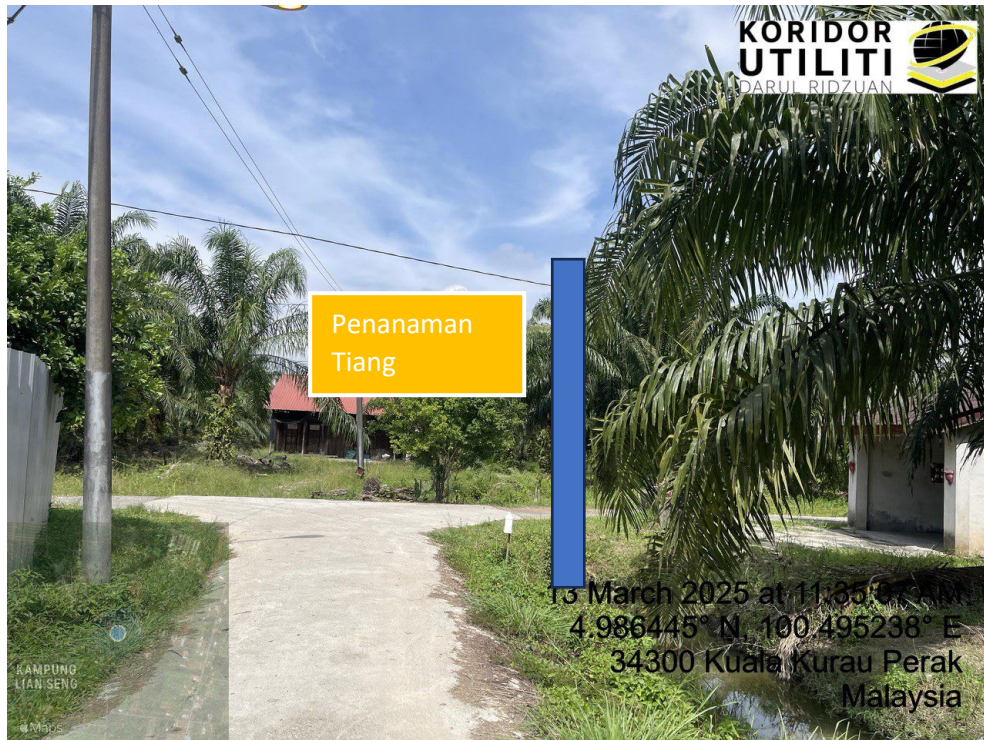
LOKASI DI JALAN KAMPUNG BARU CINA AIK HWA (JALAN GULA)