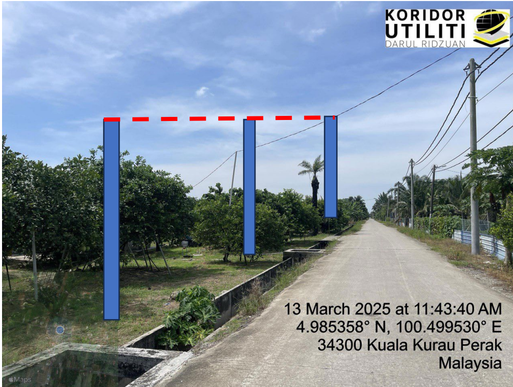
LOKASI DI JALAN KAMPUNG BARU CINA AIK HWA (JALAN GULA)