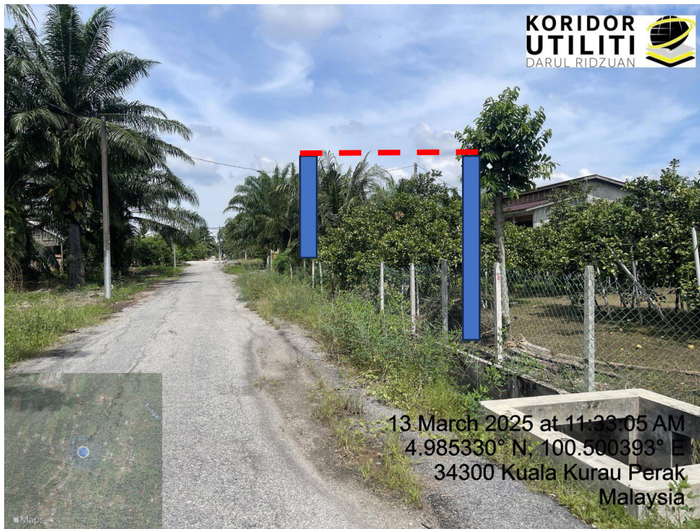
LOKASI DI JALAN KAMPUNG BARU CINA AIK HWA (JALAN GULA)