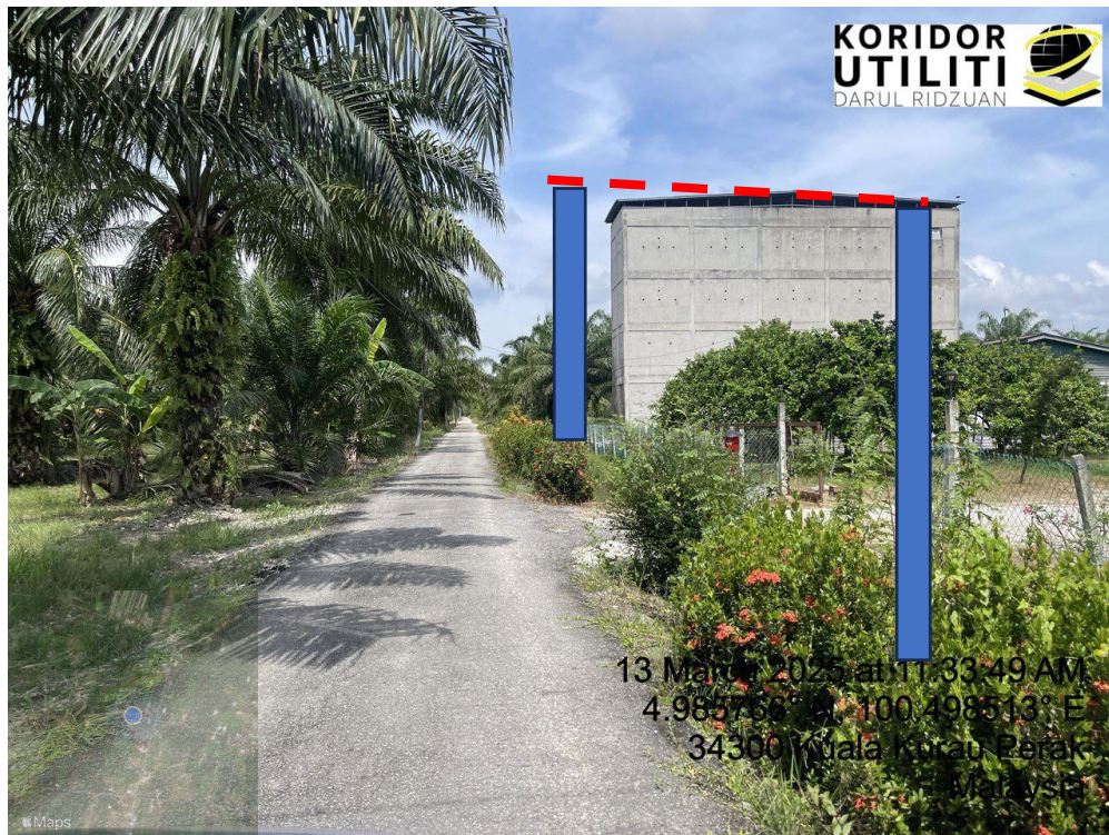
LOKASI DI JALAN KAMPUNG BARU CINA AIK HWA (JALAN GULA)