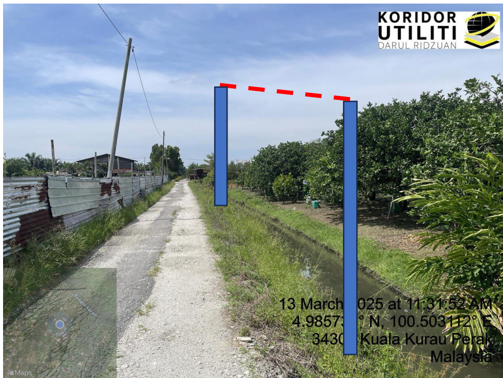
LOKASI DI JALAN KAMPUNG BARU CINA AIK HWA (JALAN GULA)