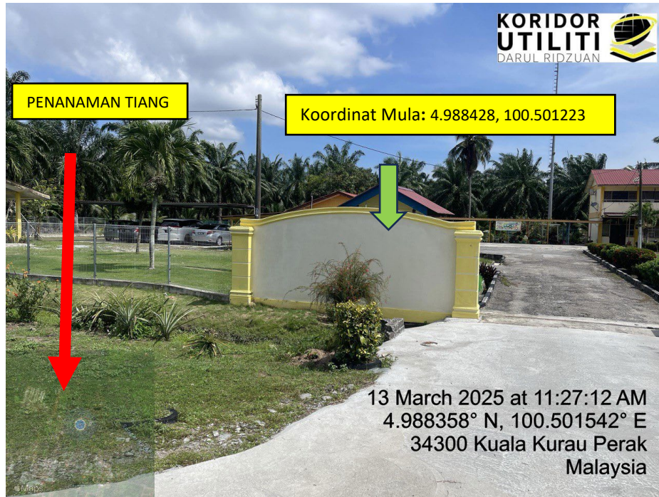
LOKASI DI JALAN KAMPUNG BARU CINA AIK HWA (JALAN GULA)