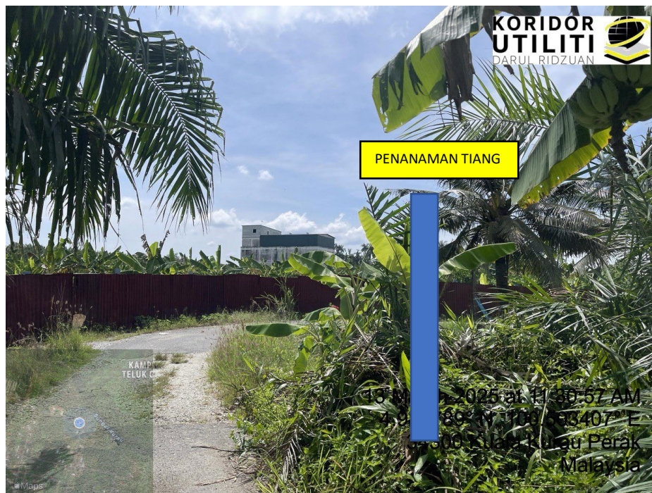
LOKASI DI JALAN KAMPUNG BARU CINA AIK HWA (JALAN GULA)