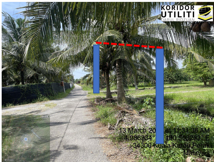
LOKASI DI JALAN KAMPUNG BARU CINA AIK HWA (JALAN GULA)