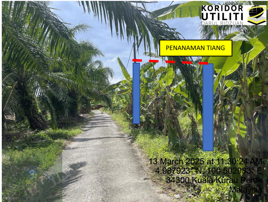
LOKASI DI JALAN KAMPUNG BARU CINA AIK HWA (JALAN GULA)