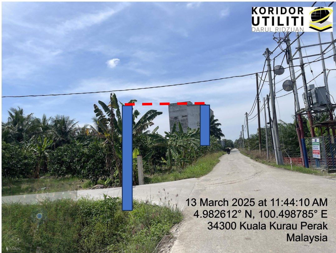
LOKASI DI JALAN KAMPUNG BARU CINA AIK HWA (JALAN GULA)