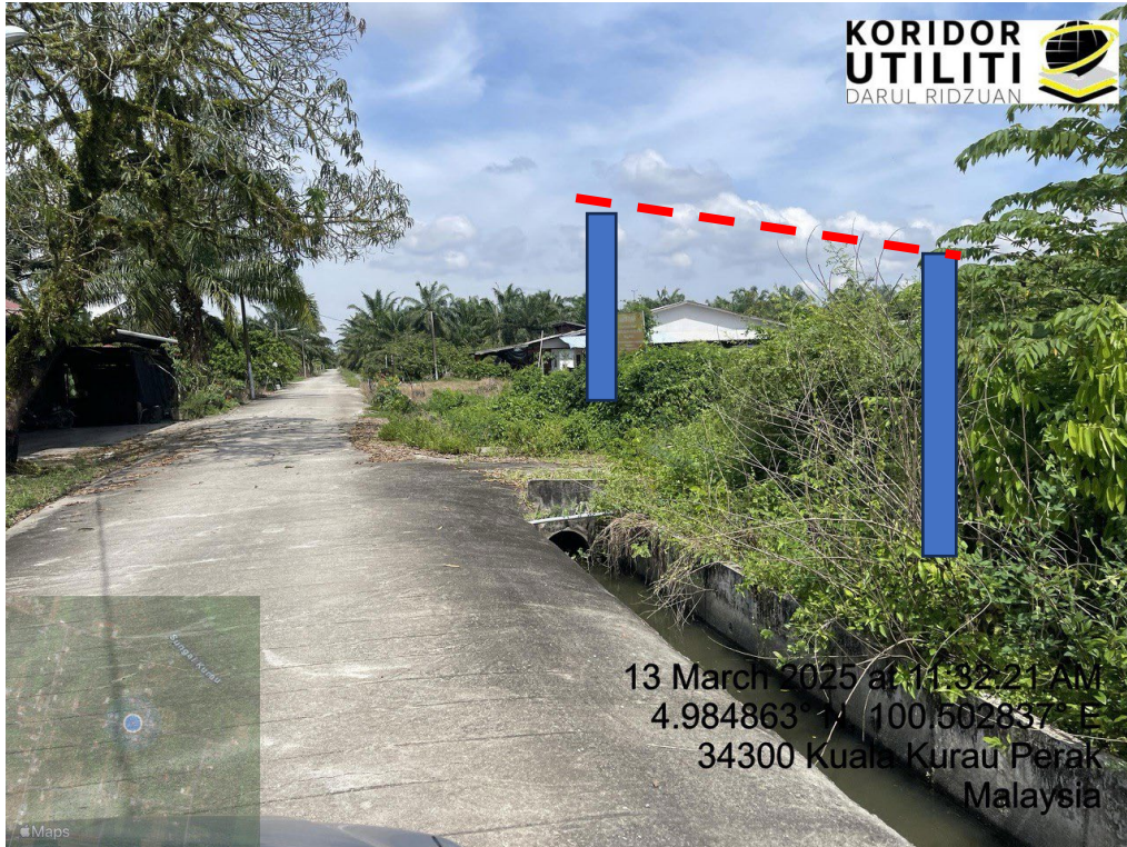
LOKASI DI JALAN KAMPUNG BARU CINA AIK HWA (JALAN GULA)