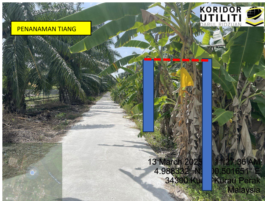
LOKASI DI JALAN KAMPUNG BARU CINA AIK HWA (JALAN GULA)