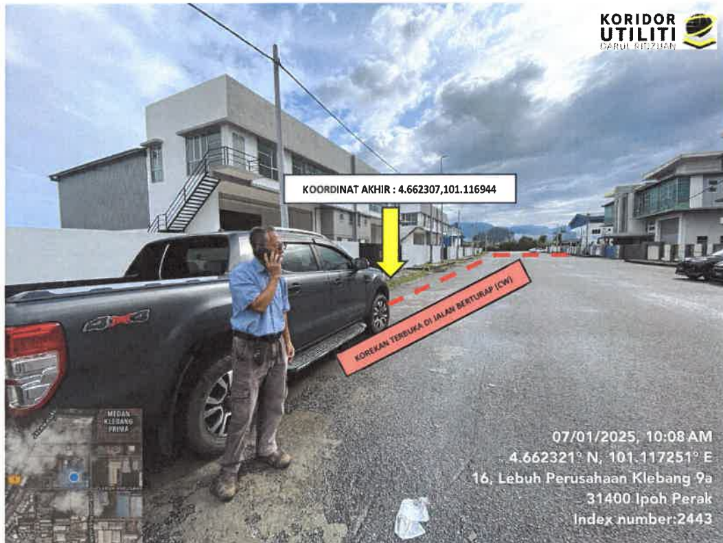
KOORDINAT AKHIR KOREKAN TERBUKA DI LEBUH PERUSAHAAN KLEBANG 9A