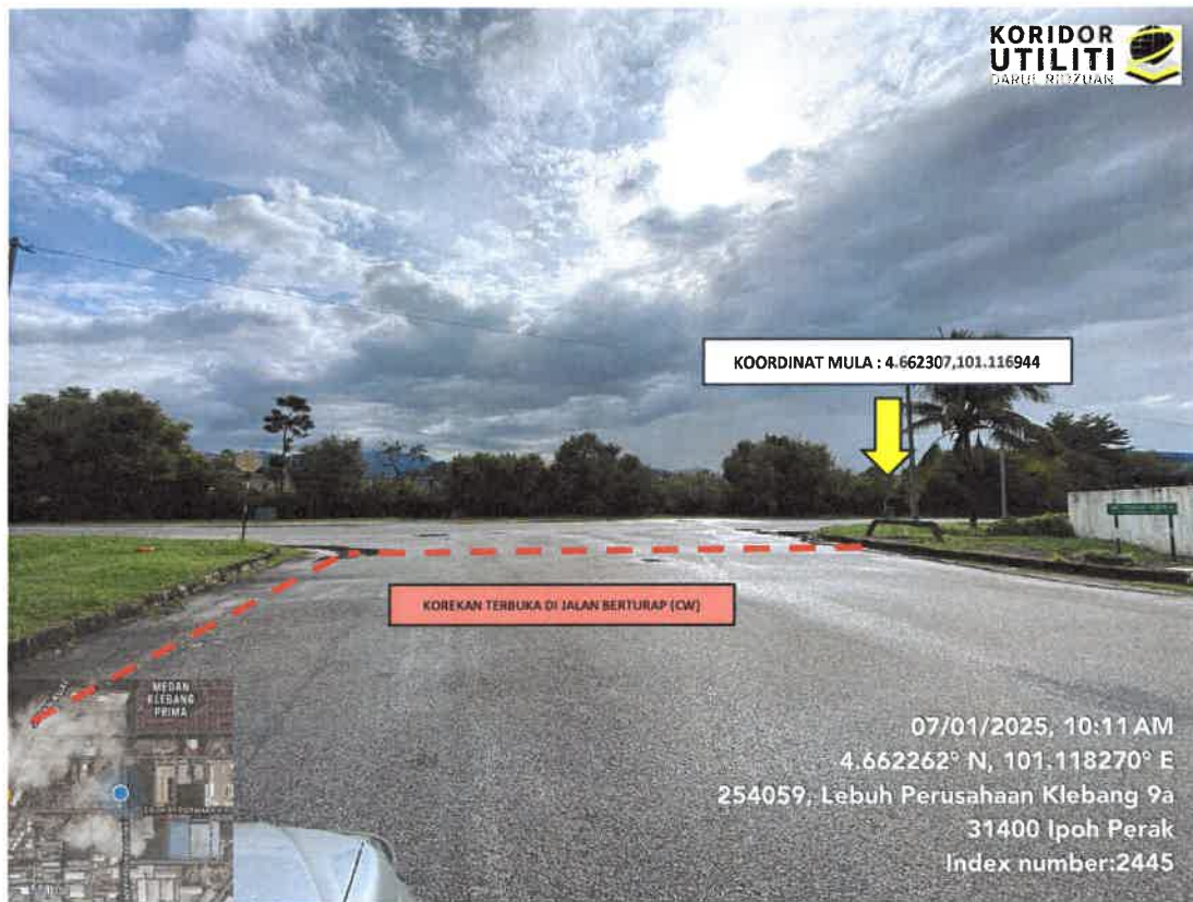
LOKASI KOORDINAT MULA KOREKAN TERBUKA DI LEBUH PERUSAHAAN KLEBANG 9A