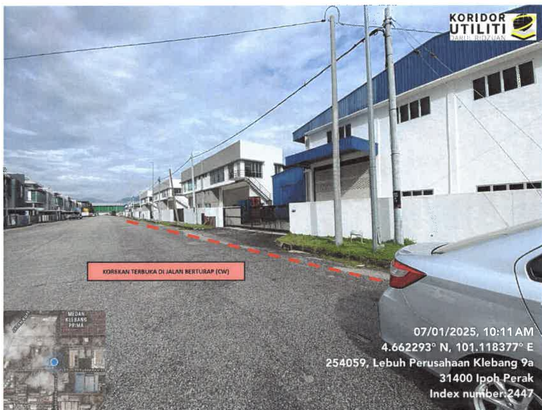
JAJARAN KOREKAN TERBUKA DI LEBUH PERUSAHAAN KLEBANG 9A