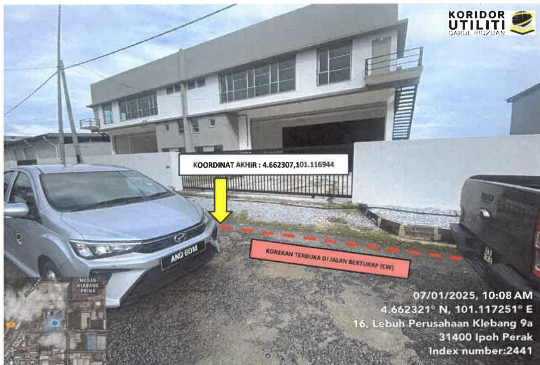
LOKASI KOORDINAT AKHIR KOREKAN TERBUKA DI LEBUH PERUSAHAAN KLEBANG 9A