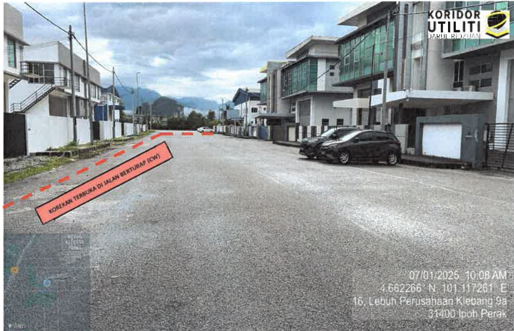
JAJARAN KAEDAH KOREKAN TERBUKA DI LEBUH PERUSAHAAN KLEBANG 9A