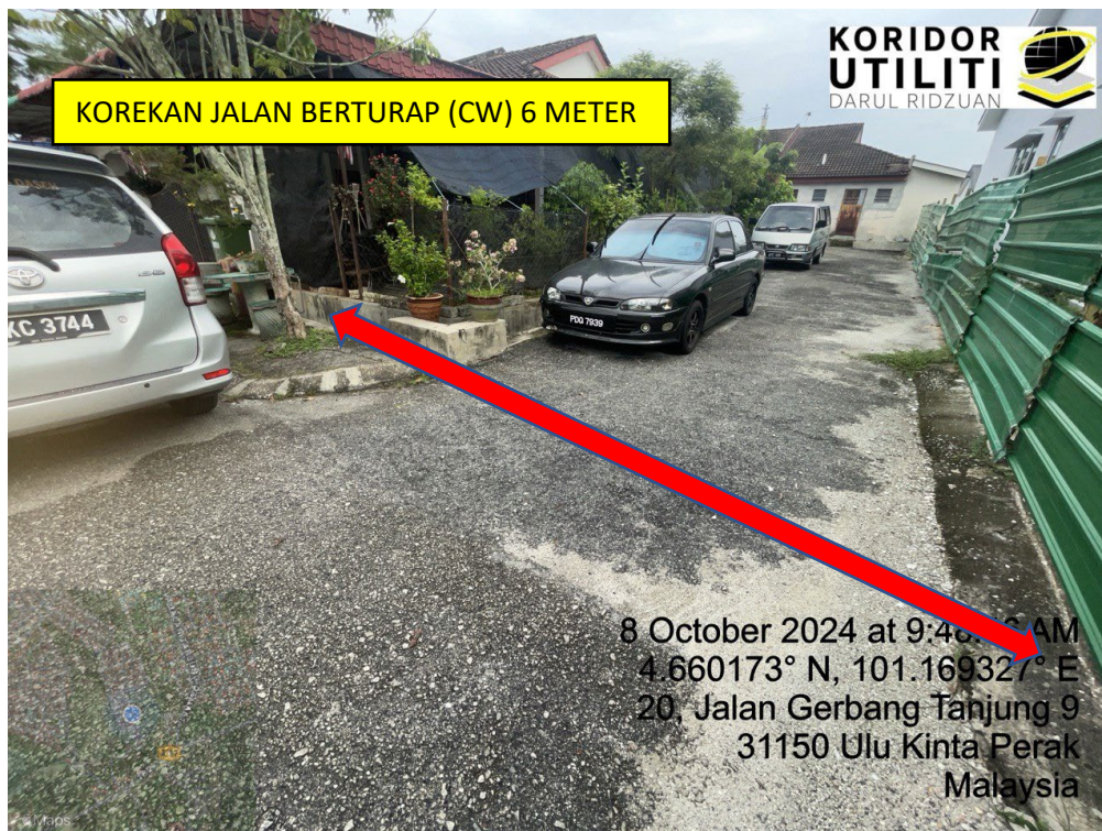
LOKASI DI JALAN GERBANG TANJUNG 9