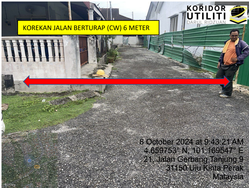
LOKASI DI JALAN GERBANG TANJUNG 10