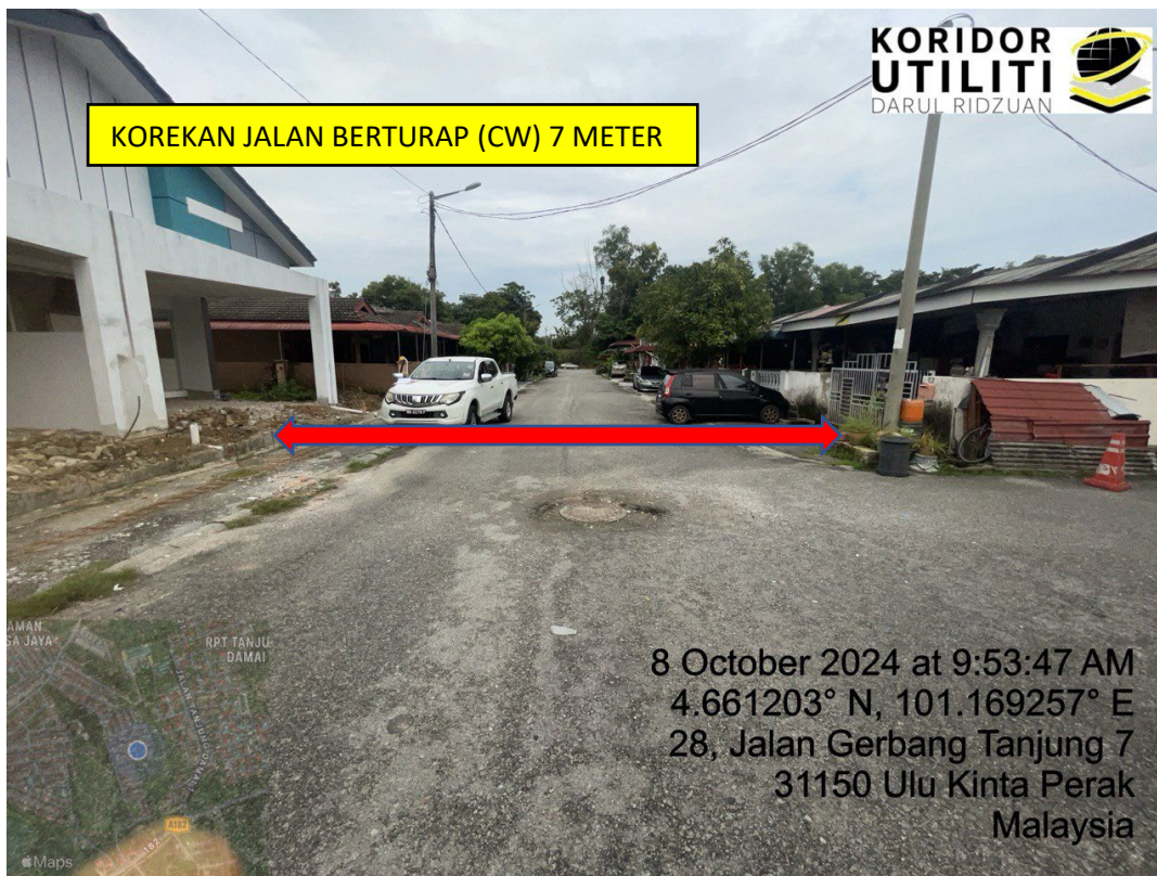
LOKASI DI JALAN GERBANG TANJUNG 7