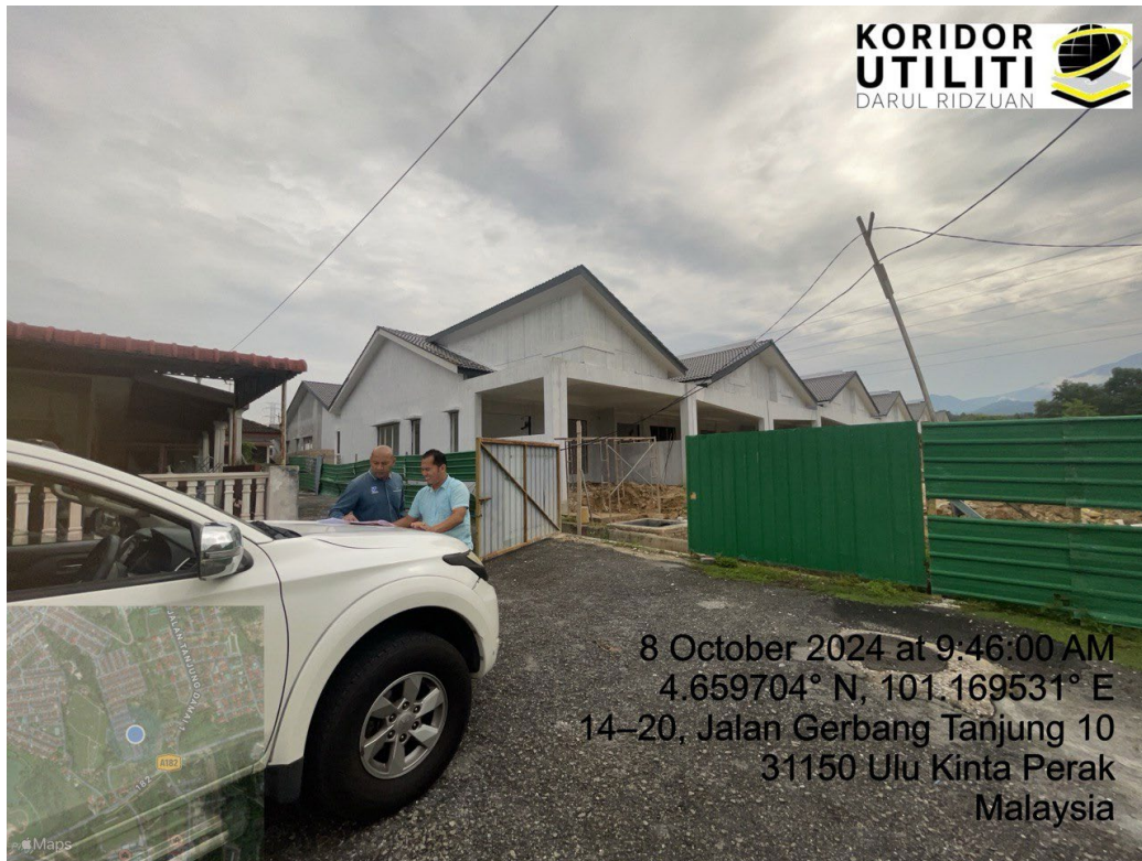
LOKASI DI JALAN GERBANG TANJUNG 10