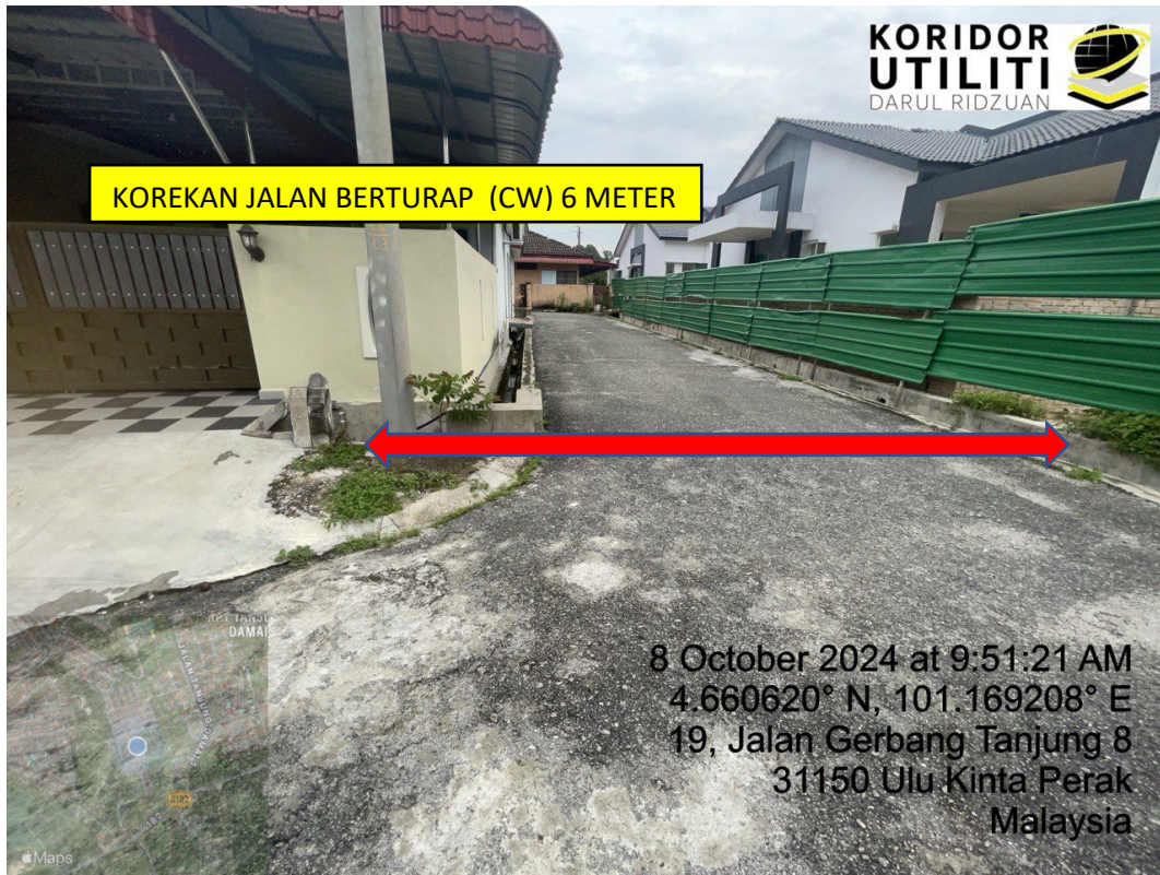
LOKASI DI JALAN GERBANG TANJUNG 8