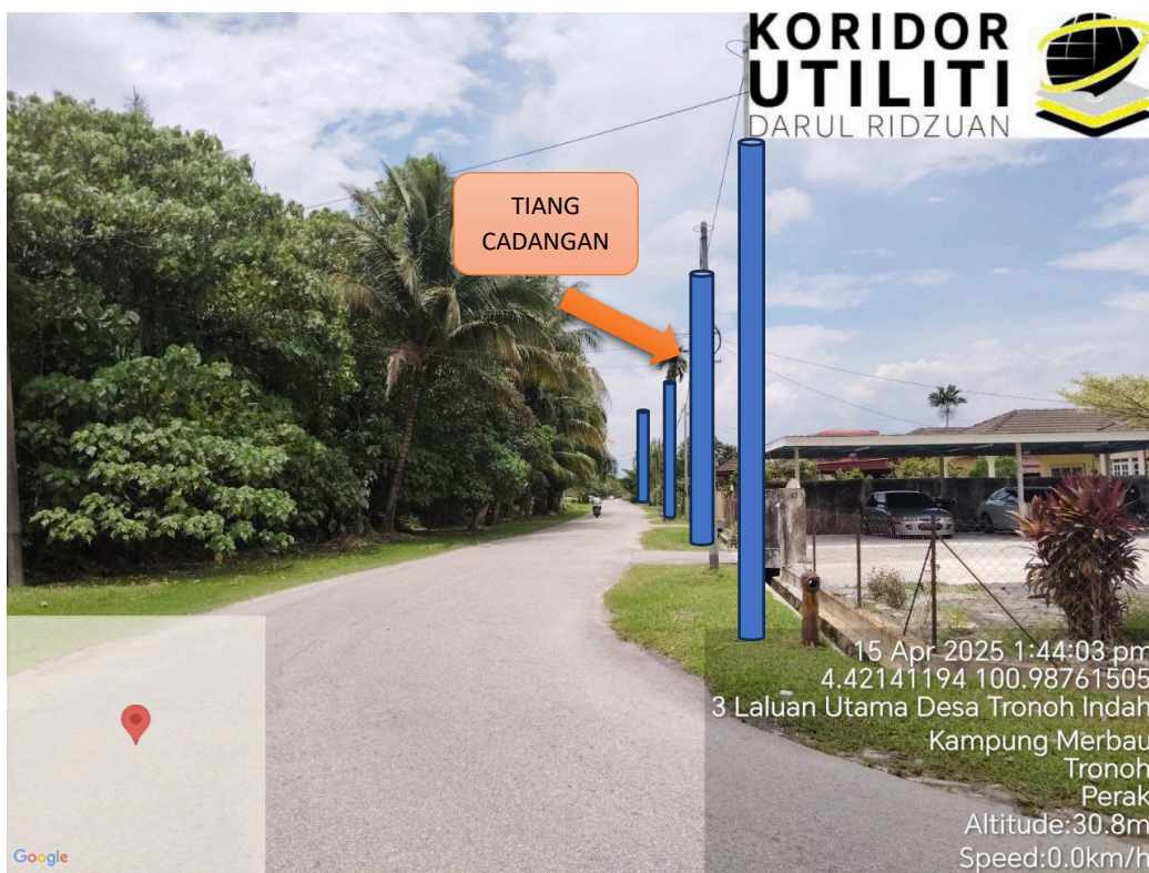
LOKASI JAJARAN TIANG CADANGAN DI LALUAN UTAMA DESA TRONOH INDAH