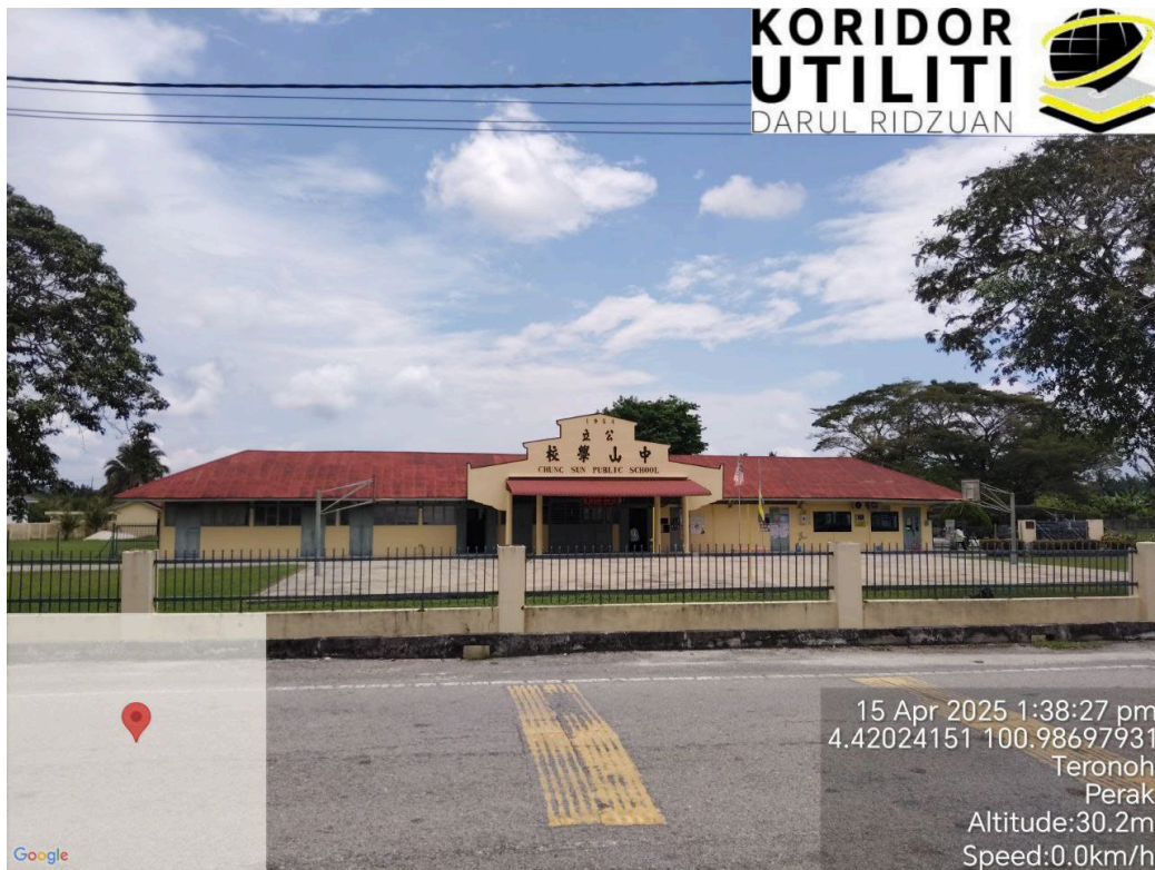
LOKASI DI SEKOLAH JENIS KEBANGSAAN ( CINA ) CHUNG SUN