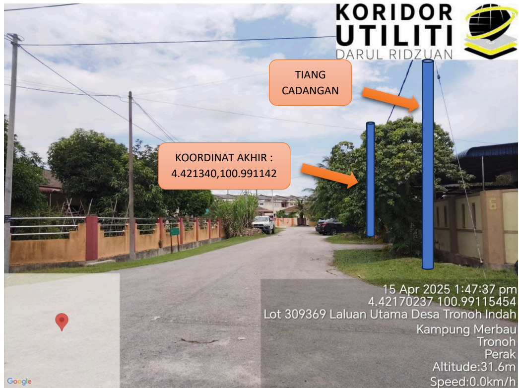
LOKASI JAJARAN TIANG CADANGAN DI LALUAN DESA TRONOH 7