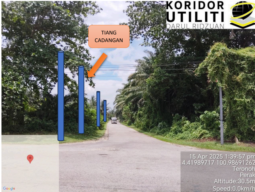
LOKASI JAJARAN TIANG CADANGAN DI LORONG KEKTUS