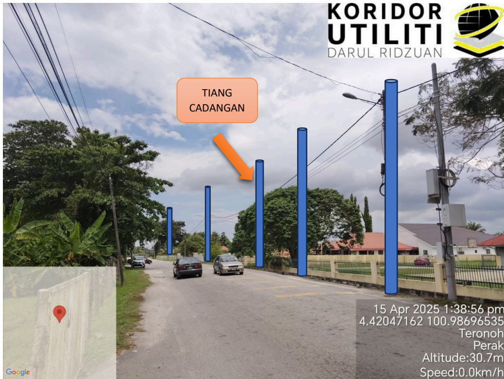
LOKASI JAJARAN TIANG CADANGAN DI JALAN SIPUTEH TRONOH