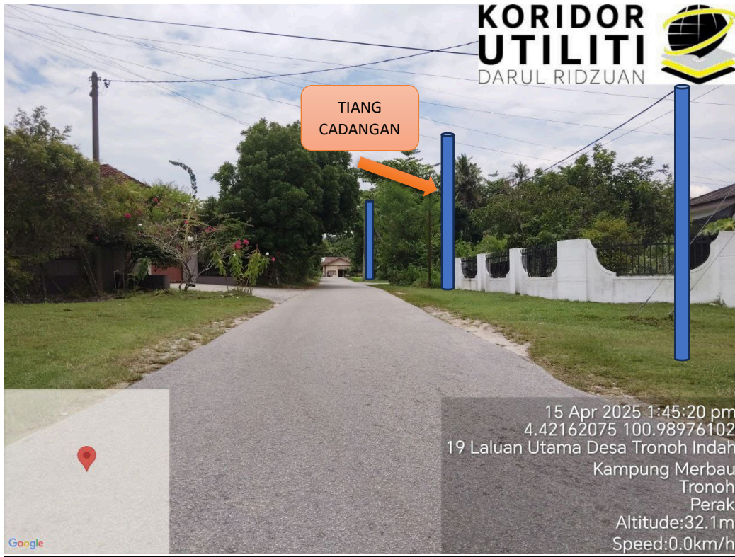
LOKASI JAJARAN TIANG CADANGAN DI JALAN BARU TRONOH