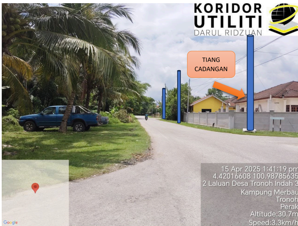
LOKASI JAJARAN TIANG CADANGAN DI LALUAN UTAMA DESA TRONOH INDAH