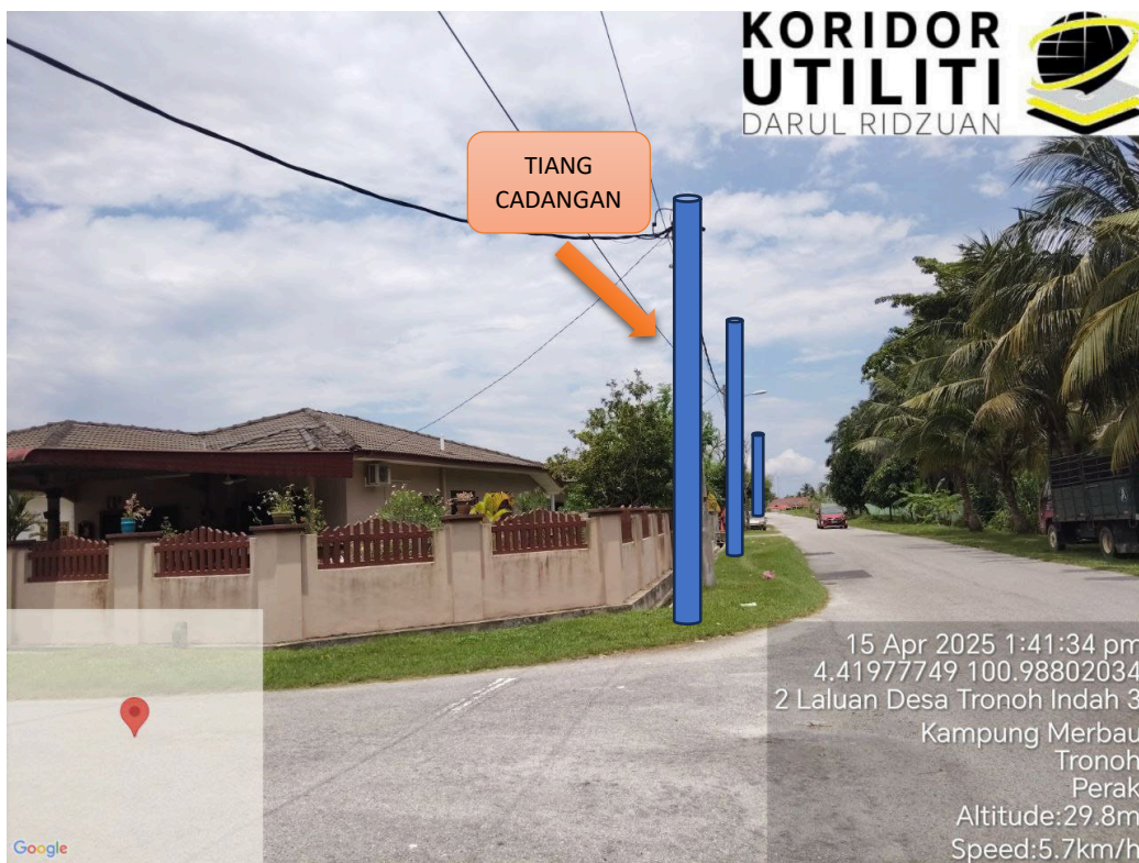
LOKASI JAJARAN TIANG CADANGAN DI LALUAN UTAMA DESA TRONOH INDAH