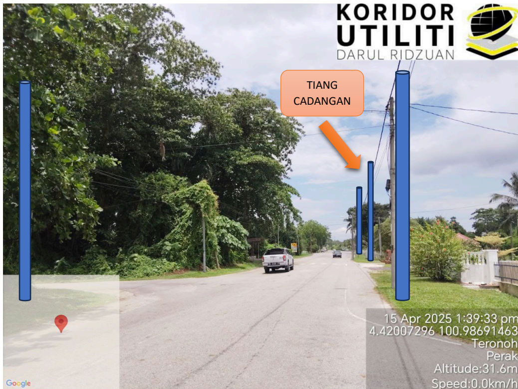
LOKASI JAJARAN TIANG CADANGAN DI JALAN SIPUTEH TRONOH