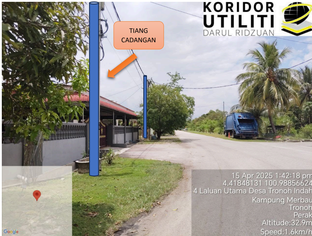
LOKASI JAJARAN TIANG CADANGAN DI LALUAN DESA TRONOH 1