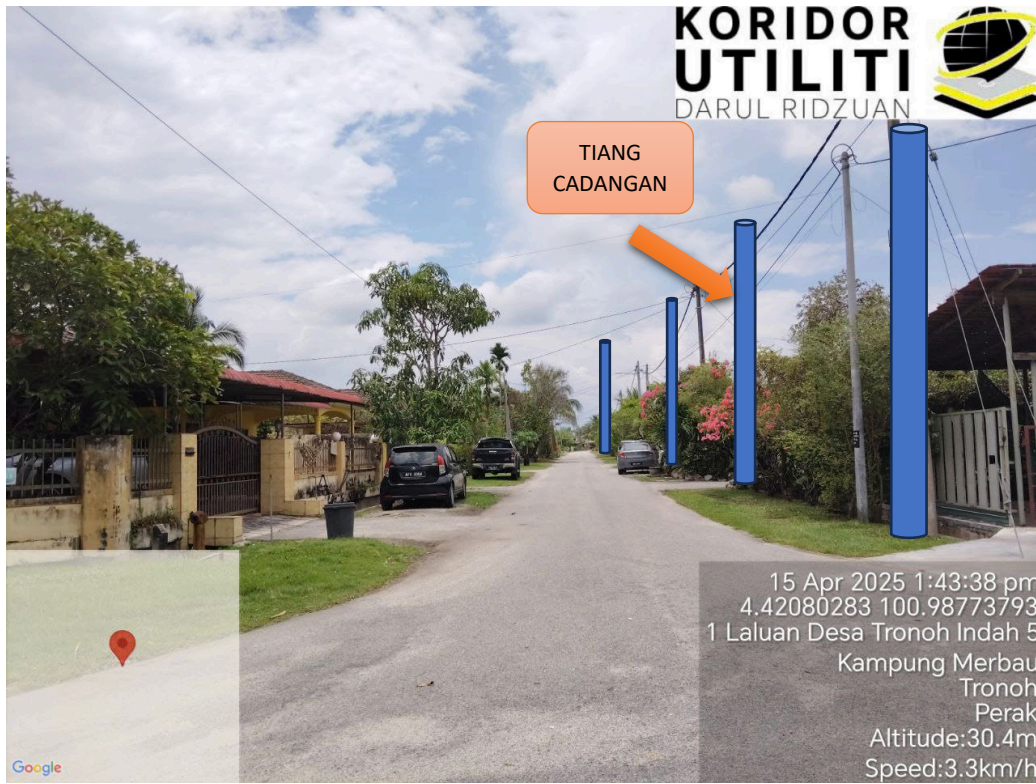
LOKASI TIANG CADANGAN DI LALUAN DESA TRONOH INDAH 5