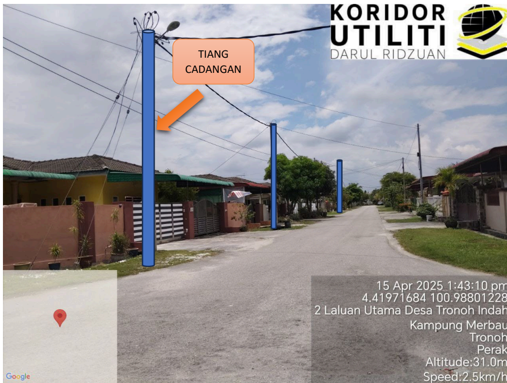
LOKASI JAJARAN TIANG CADANGAN DI LALUAN DESA TRONOH INDAH 3