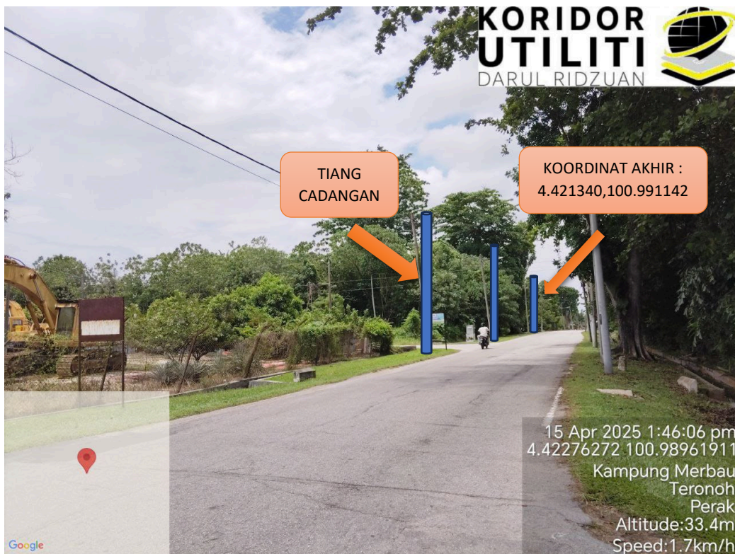
LOKASI JAJARAN TIANG CADANGAN DI JALAN BESAR TRONOH