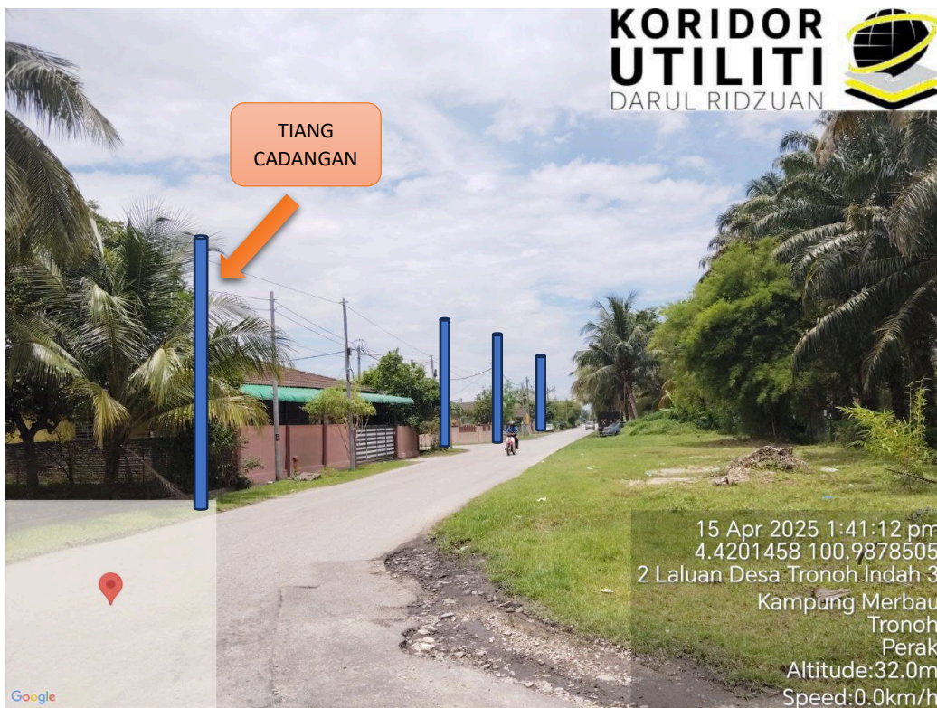
LOKASI JAJARAN TIANG CADANGAN DI LALUAN UTAMA DESA TRONOH INDAH