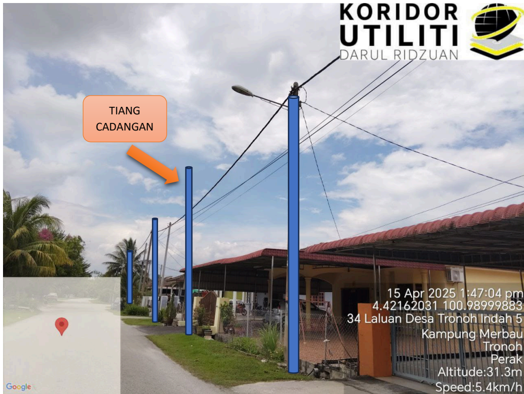
LOKASI JAJARAN TIANG CADANGAN DI LALUAN UTAMA DESA TRONOH INDAH