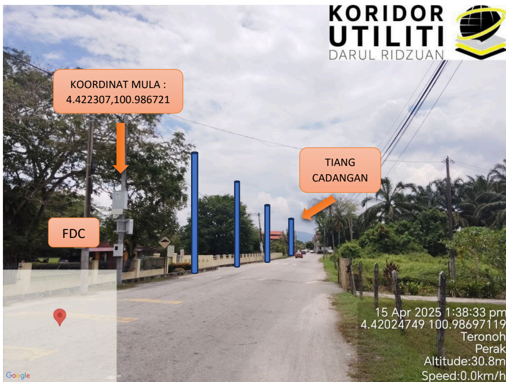
LOKASI KOORDINAT MULA JAJARAN TIANG CADANGAN DI JALAN SIPUTEH TRONOH