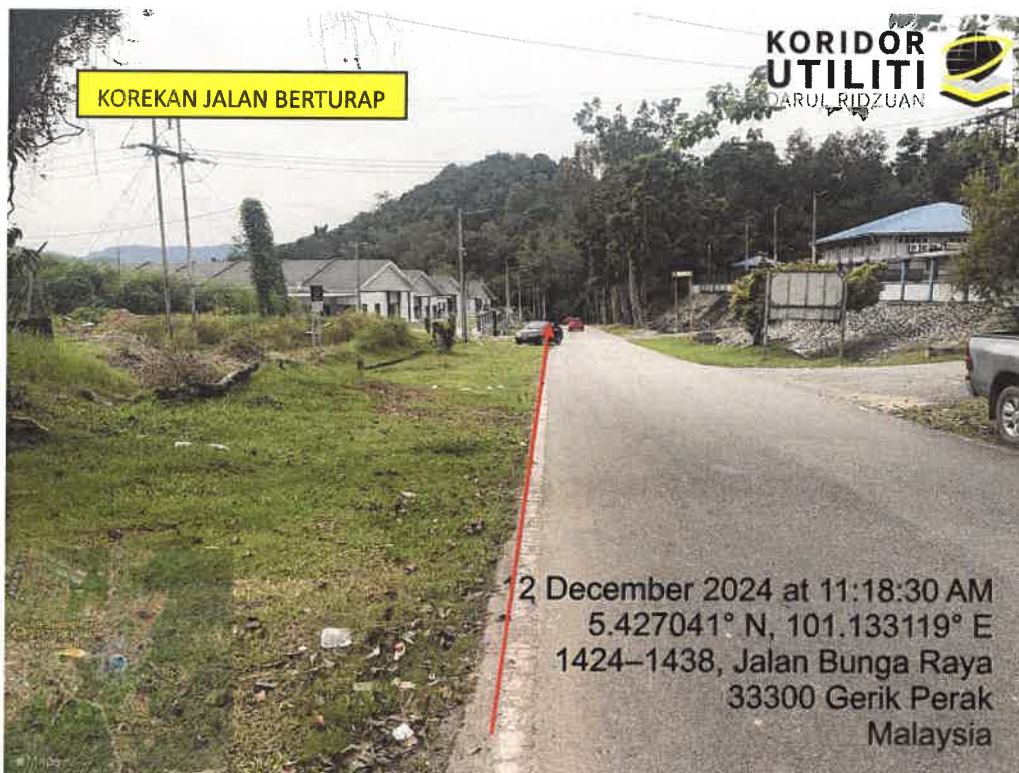
LOKASI DI JALAN BUNGA RAYA