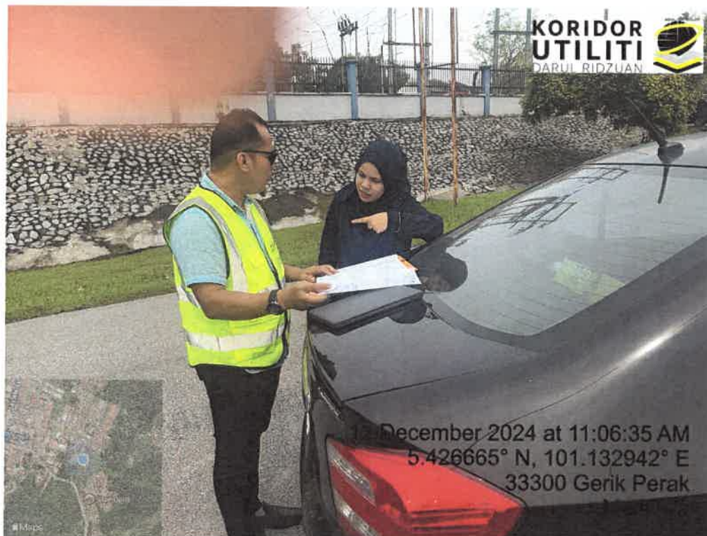
LOKASI DI JALAN BUNGA RAYA