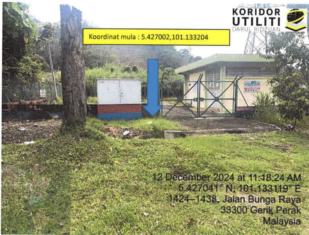
LOKASI DI JALAN BUNGA RAYA