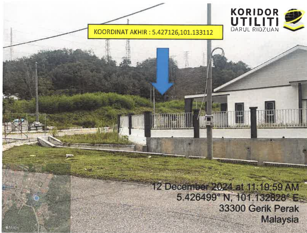
LOKASI DI JALAN BUNGA RAYA