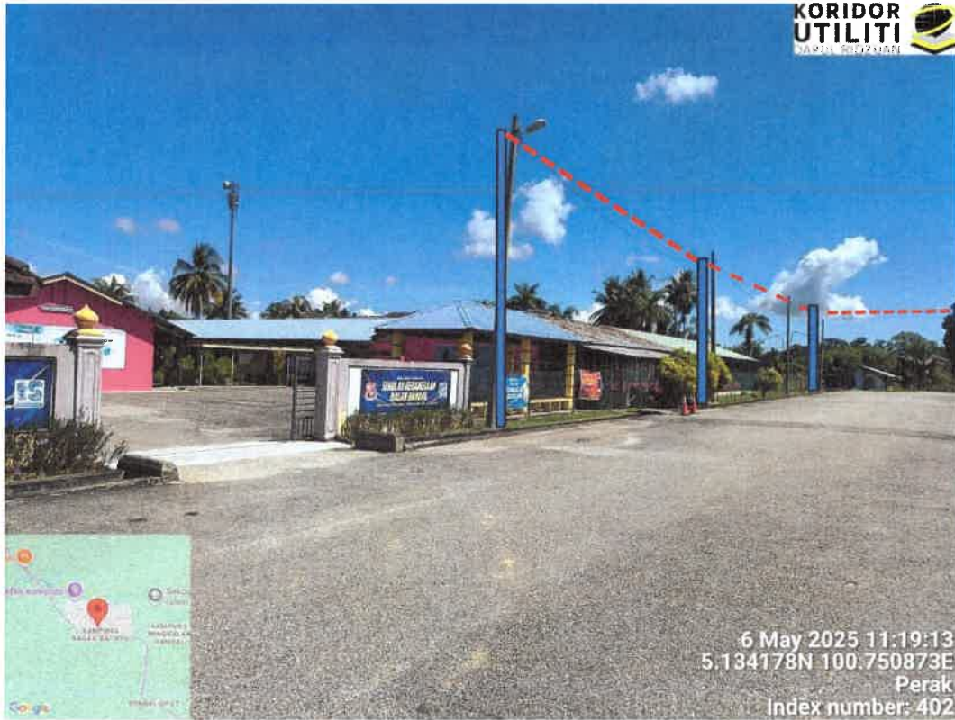
KOORDINAT MULA – CADANGAN PENANAMAN TIANG DI HADAPAN SEKOLAH SK BAGAN BAHRU