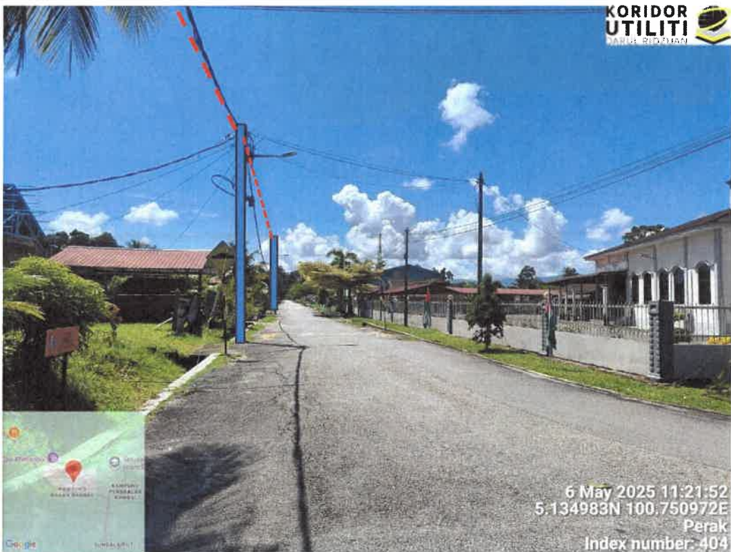
CADANGAN LALUAN PENANAMAN TIANG DI JALAN MAJLIS