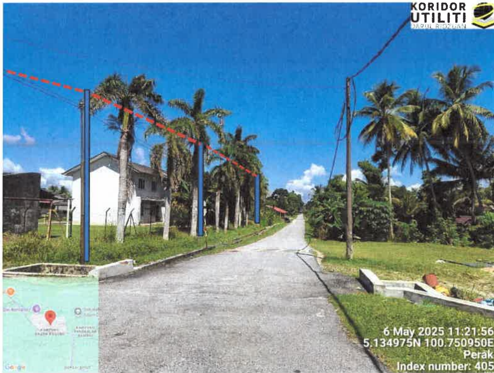
LALUAN PENANAMAN TIANG