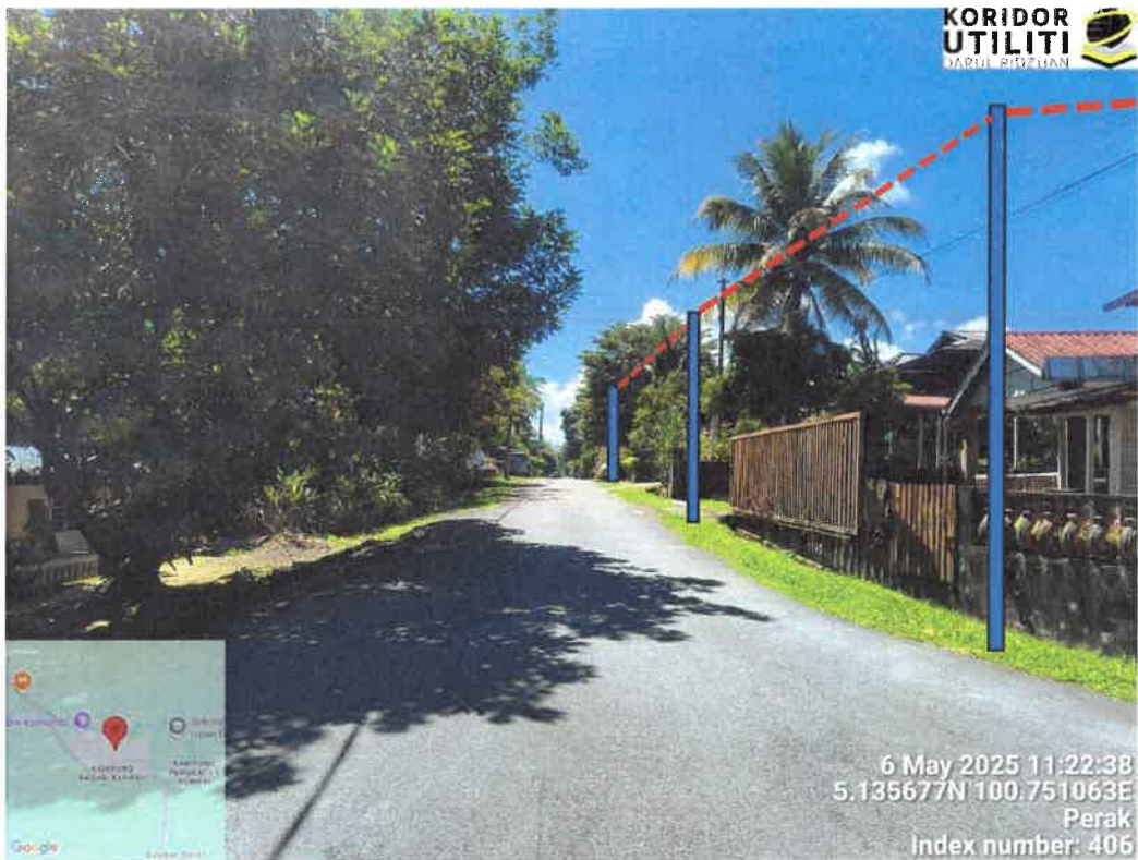
CADANGAN PENANAMAN TIANG