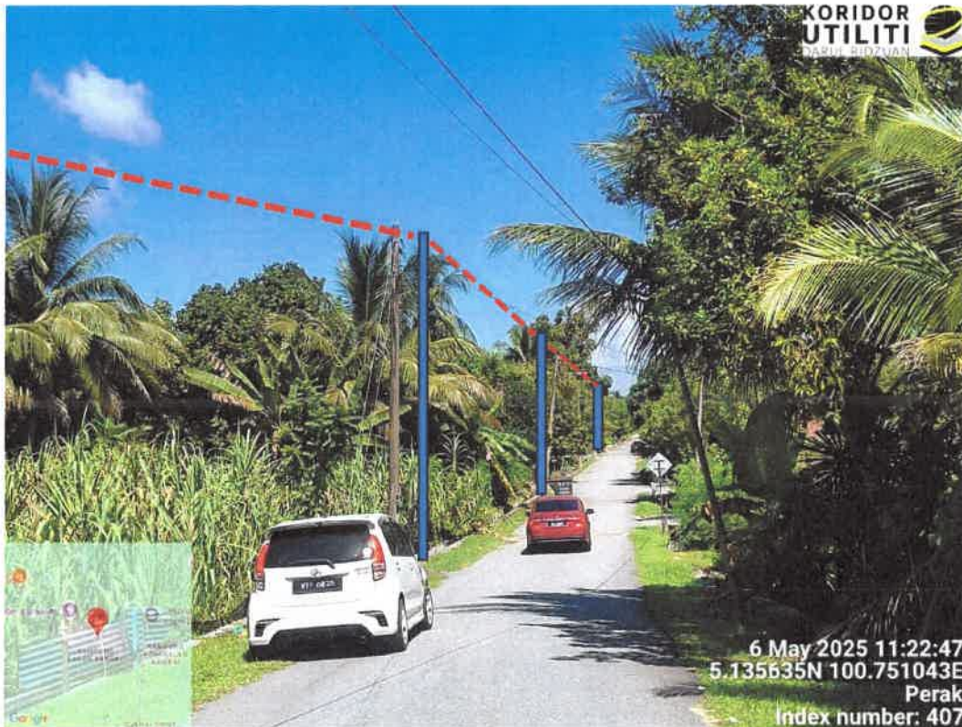
LALUAN PENANAMAN TIANG