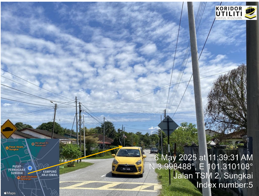
LOKASI DI JALAN TSM 2