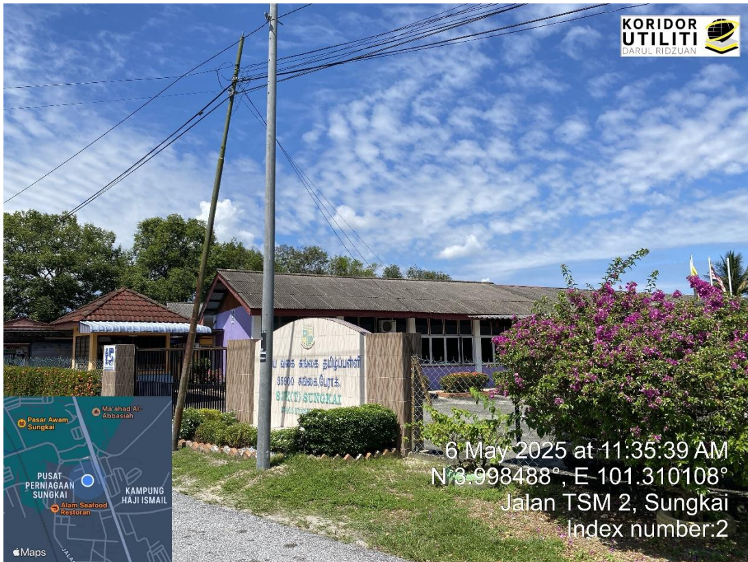
LOKASI FDC DI HADAPAN SJKT SUNGKAI