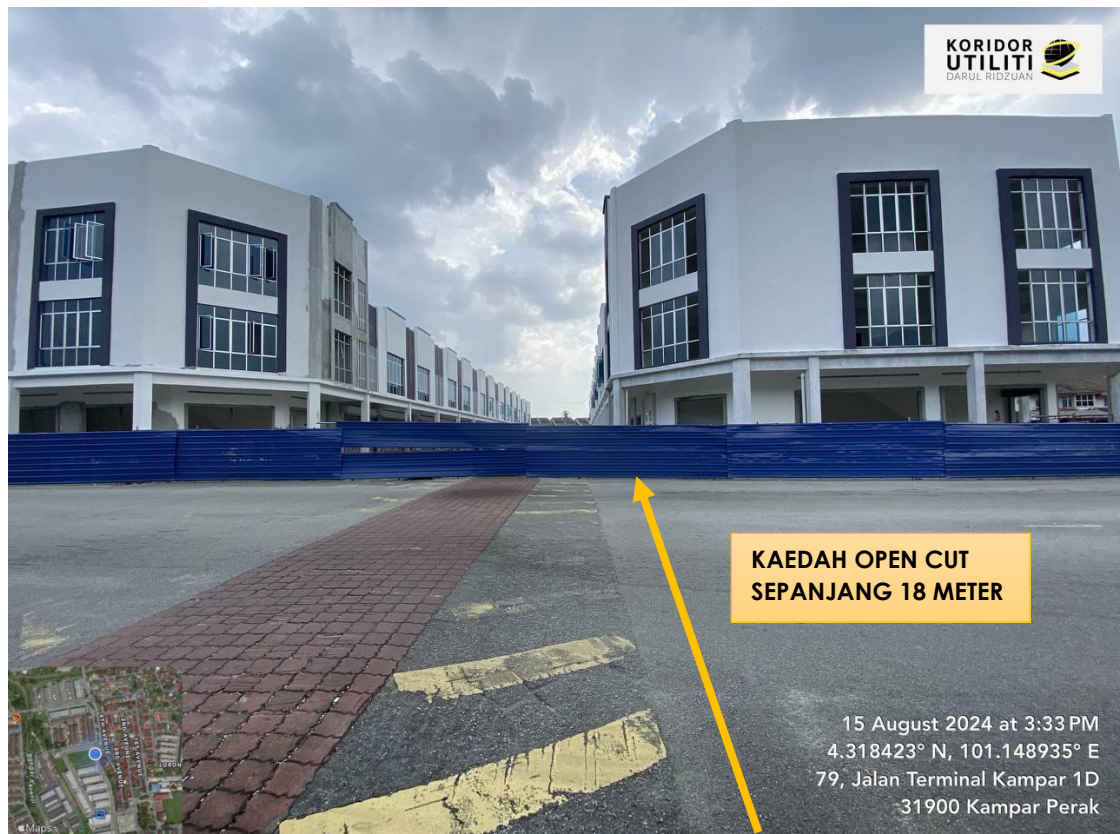
LOKASI DI JALAN TERMINAL KAMPAR 1