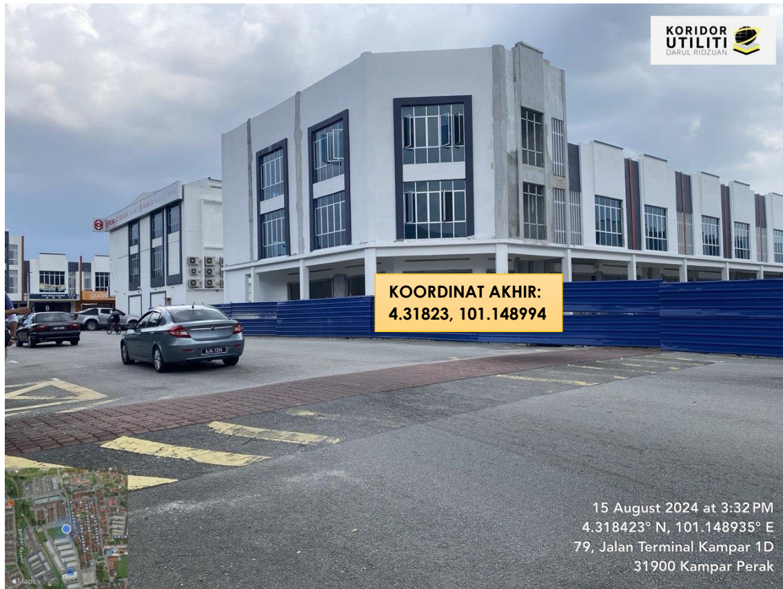
LOKASI DI JALAN TERMINAL KAMPAR 1