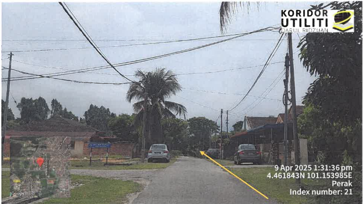
JAJARAN PEMASANGAN UTILITI MENGIKUT TIANG TNB SEDIA ADA