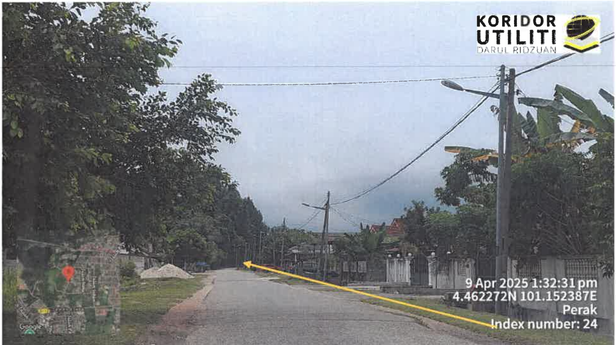
AJARAN PEMASANGAN UTILITI MENGIKUT TIANG TNB SEDIA ADA

9 Apr 2025 1:46:03 pm 4.463141N 101.157643E Perak Index number: 50