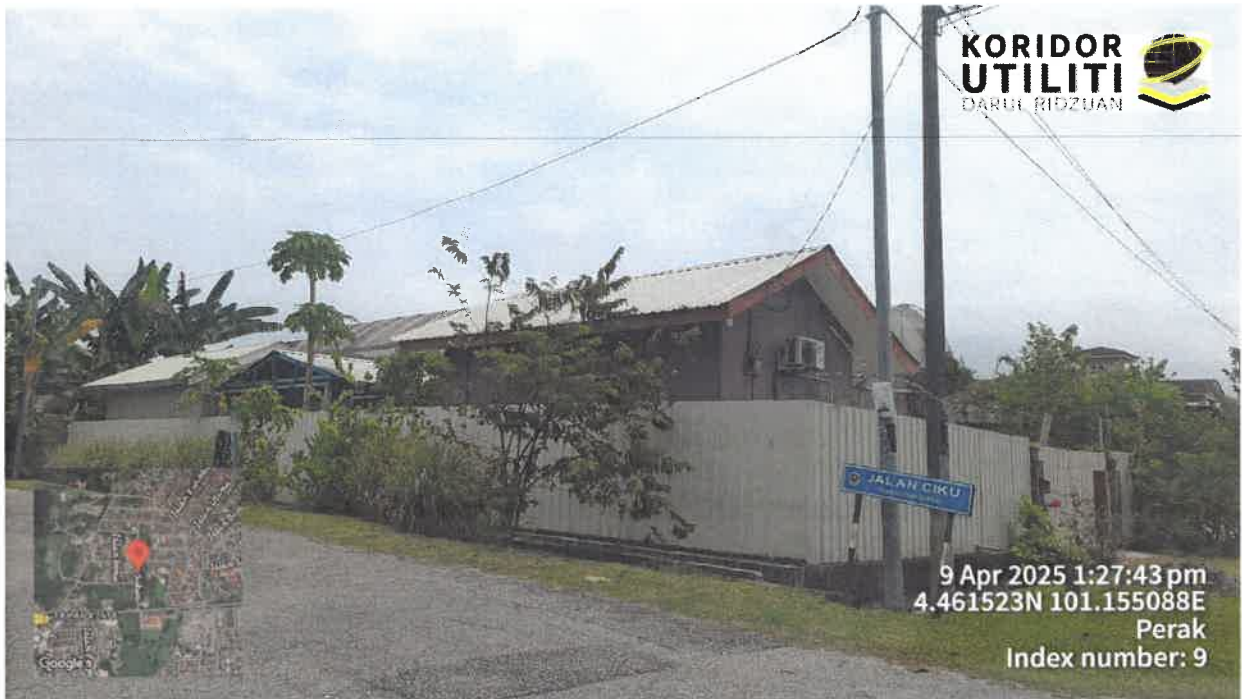
LOKASI DI JALAN CIKU