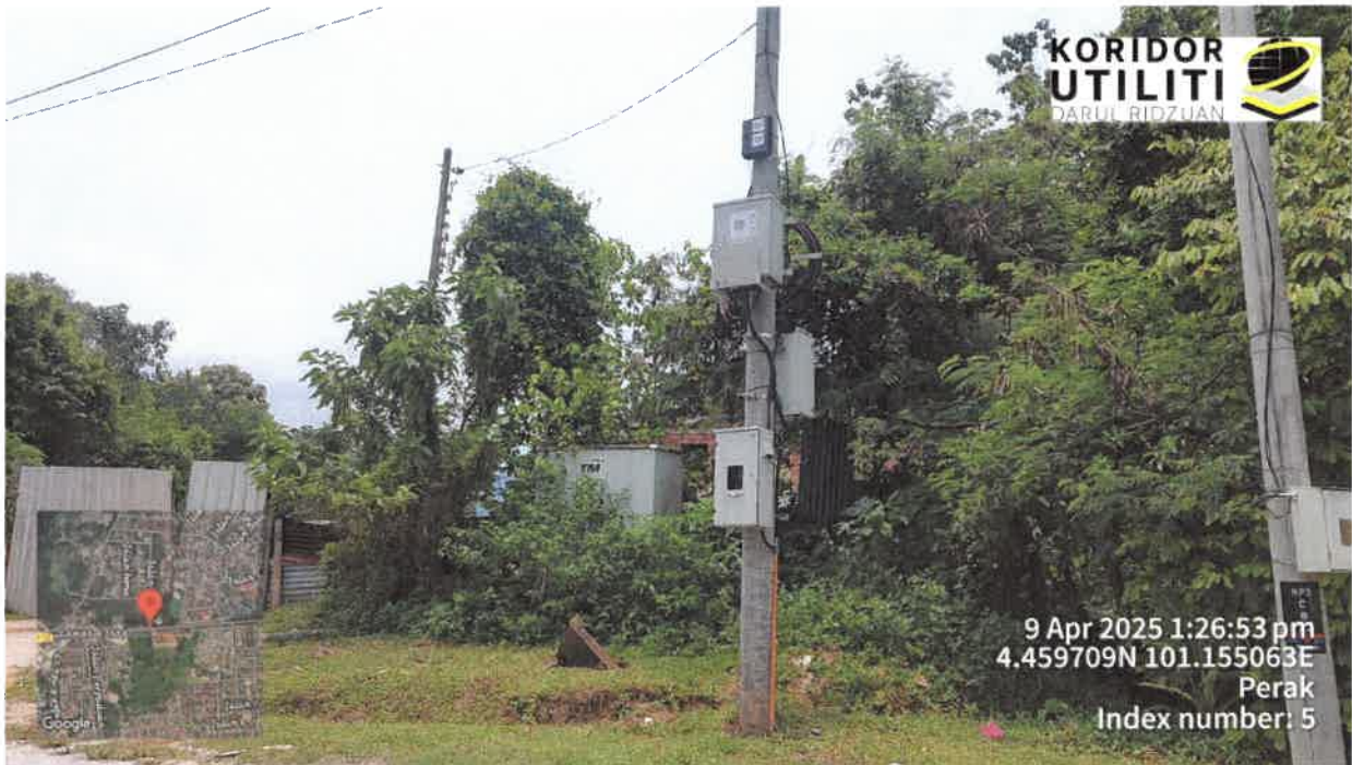
FDC SEDIA ADA