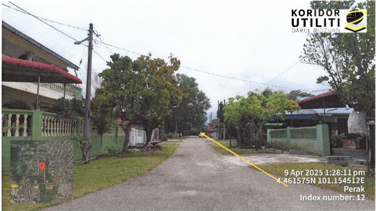
JAJARAN CADANGAN PEMASANGAN UTILITI