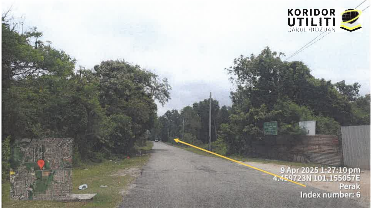
JAJARAN PEMASANGAN UTILITI MENGIKUT TIANG TNB SEDIA ADA