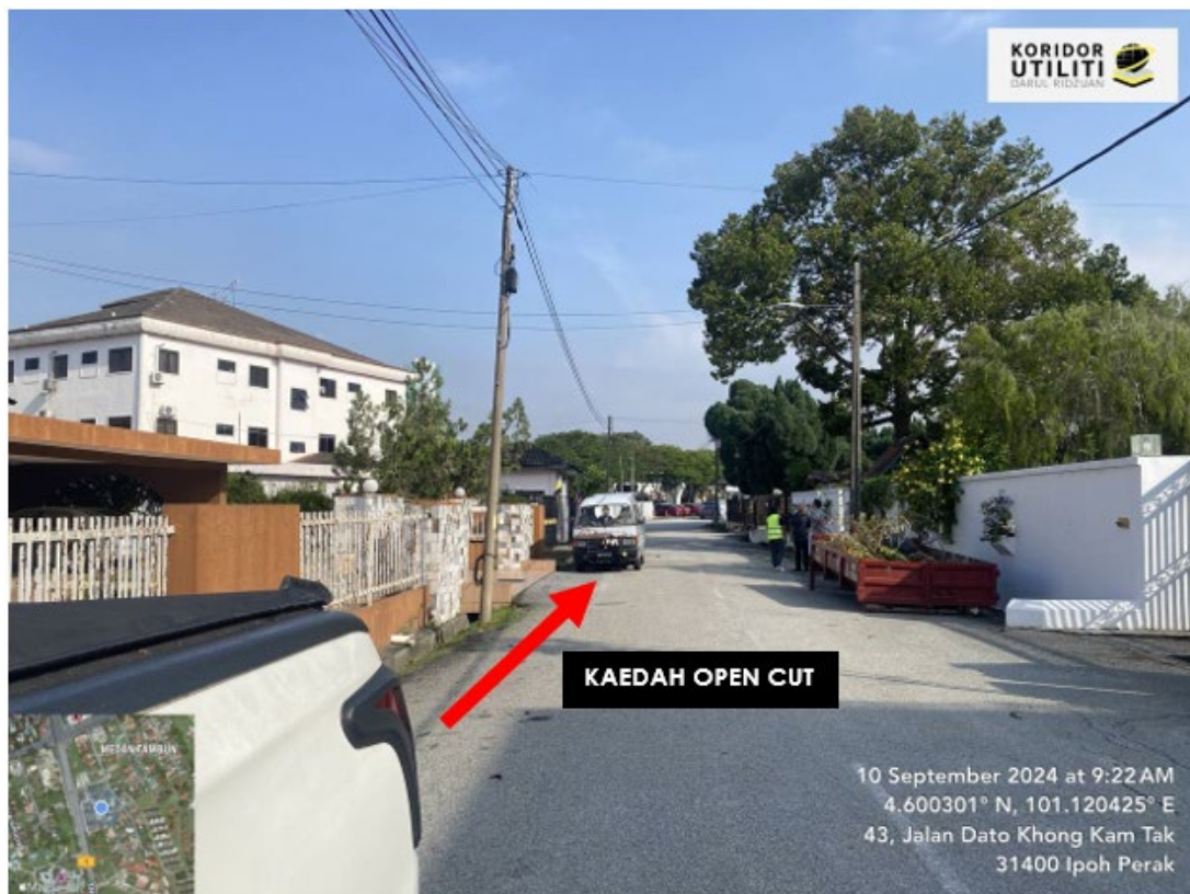
LOKASI JALAN DATO KHONG KAM TAK