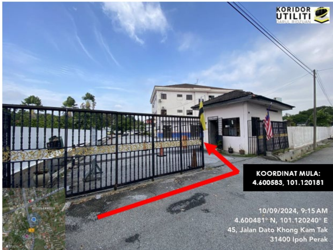
LOKASI JALAN DATO KHONG KAM TAK