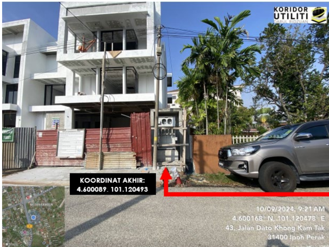
LOKASI JALAN DATO KHONG KAM TAK