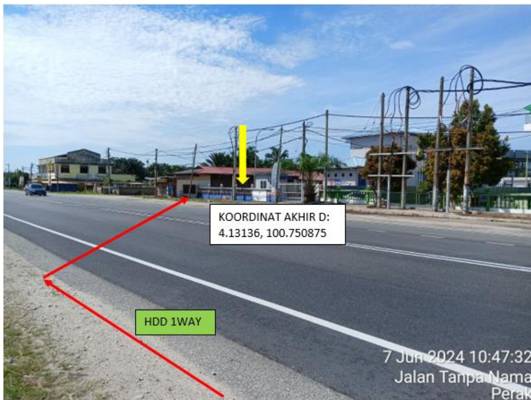
LOKASI DI JALAN MANJUNG – TELUK INTAN FT005