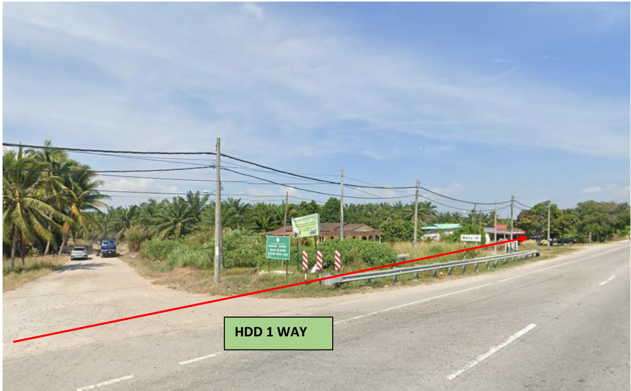
LOKASI DI PARIT BHARU