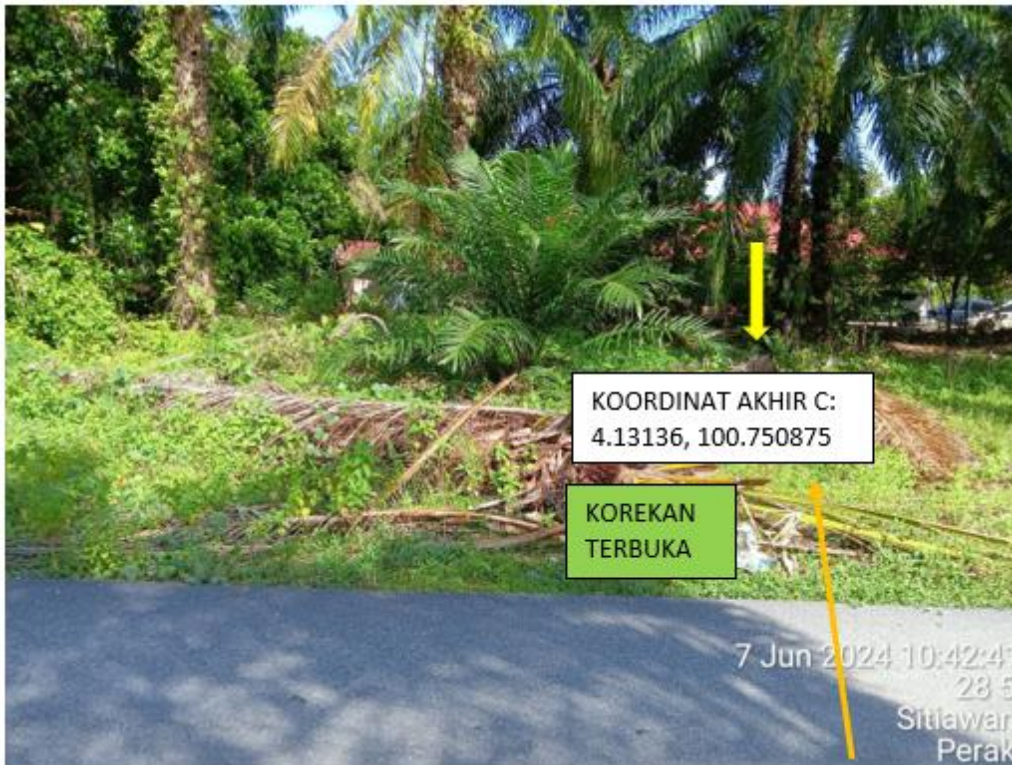
LORONG HAJI HAMZAH