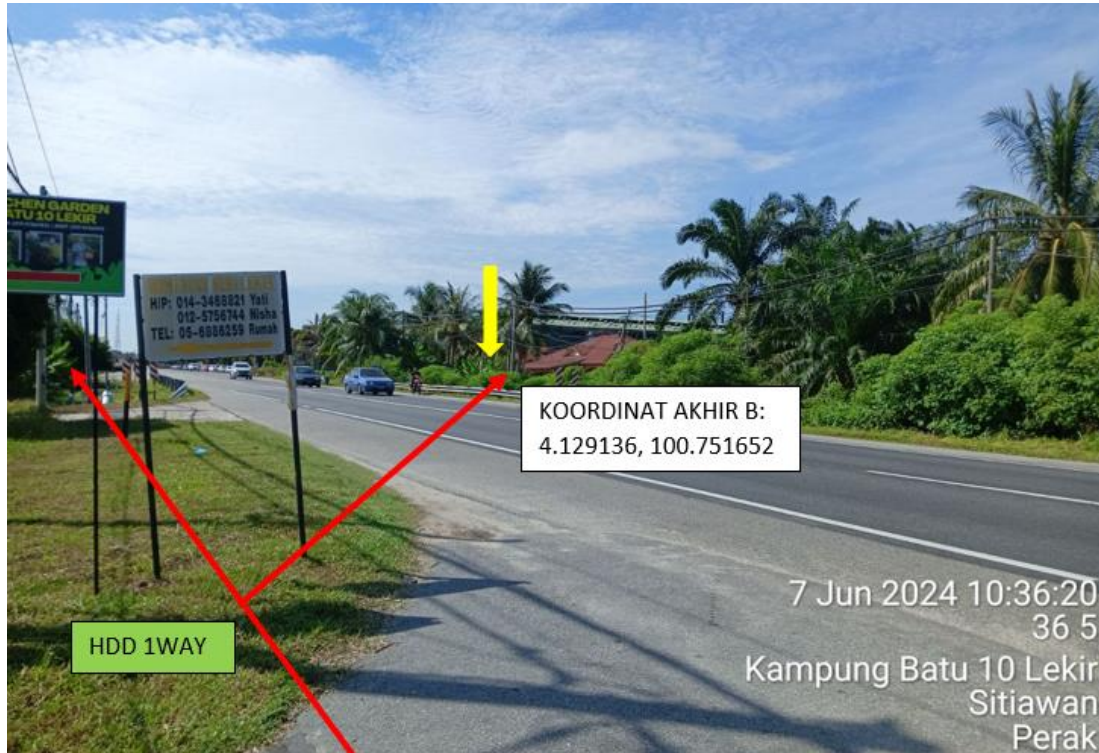
LOKASI DI JALAN MANJUNG – TELUK INTAN FT005