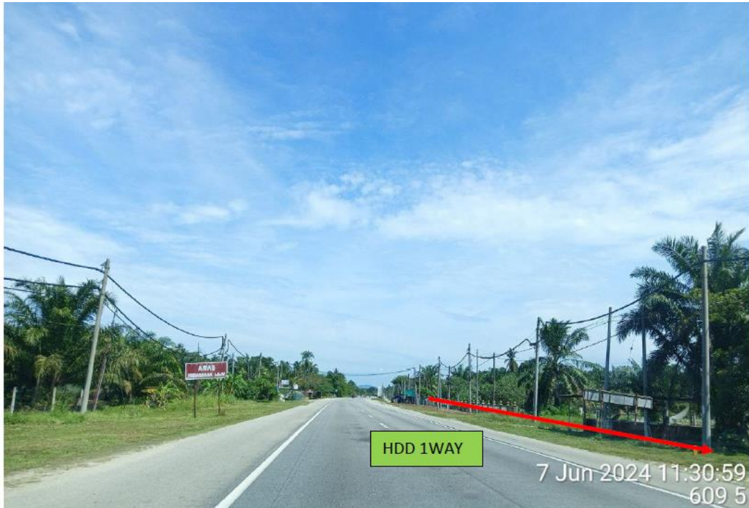
LOKASI DI JALAN MANJUNG – TELUK INTAN FT005