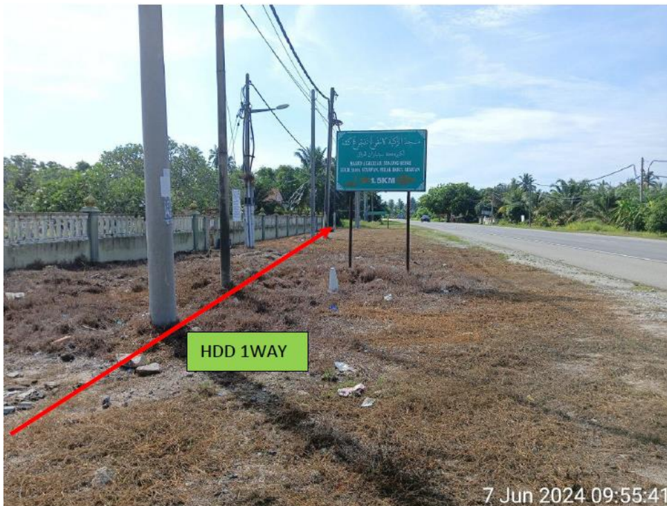
LOKASI DI JALAN MANJUNG – TELUK INTAN FT005