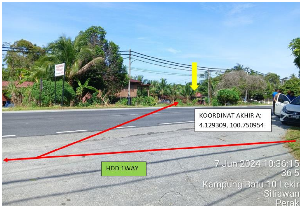
LOKASI DI JALAN MANJUNG – TELUK INTAN FT005