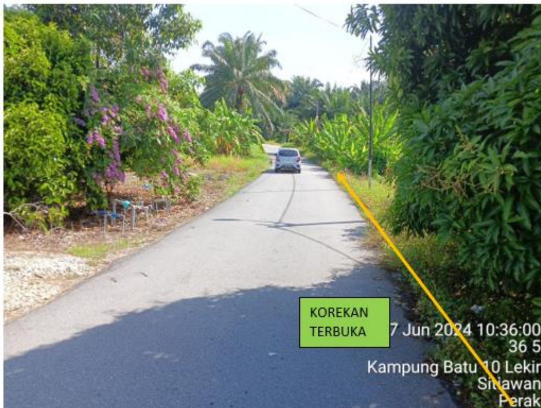
LORONG HAJI HAMZAH