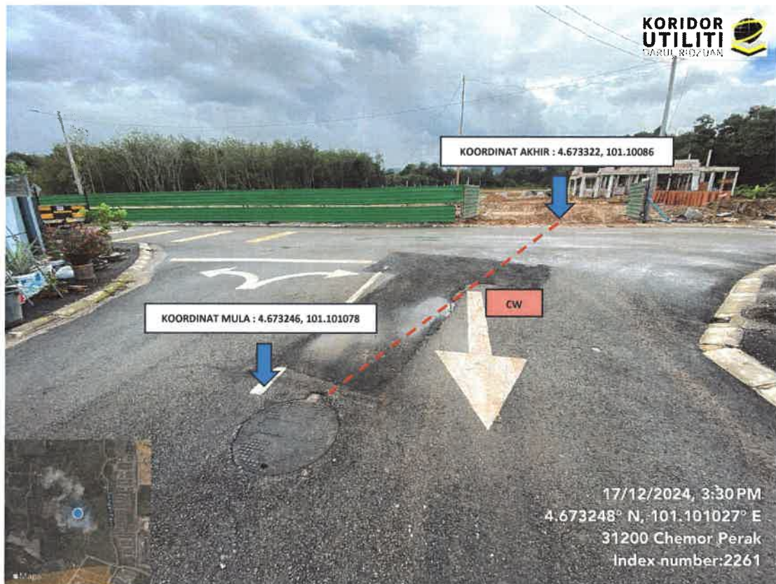
LOKASI KOREKAN TERBUKA BAGI PENYAMBUNGAN PAIP PEMBENTUNGAN DI JALAN KLEBANG DELIMA 7