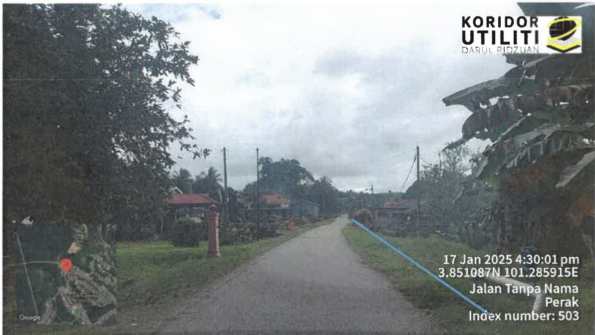
CADANGAN PEMASANGAN TIANG

17 Jan 2025 4:29:37 pm 3.850725N 101.285731E Index number: 498