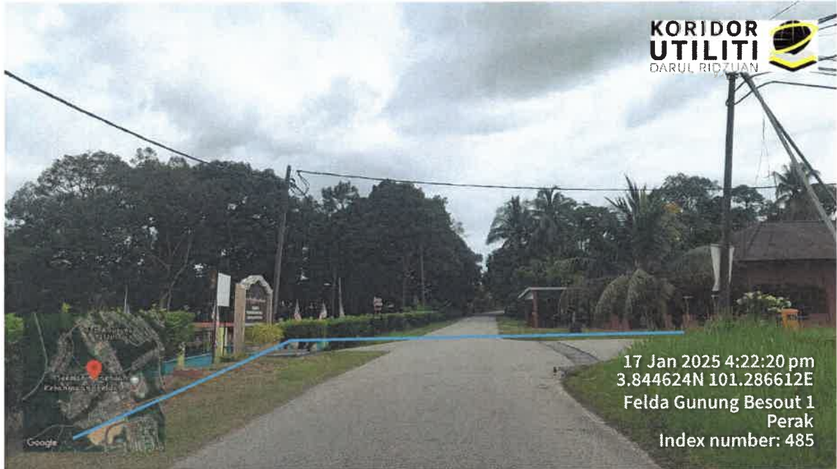
CADANGAN PEMASANGAN TIANG 9 METER DI KAWASAN CROSSING