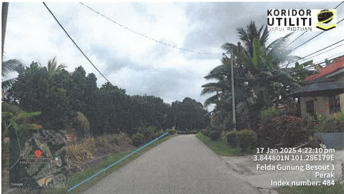
CADANGAN PEMASANGAN TIANG DI SEBELAH KIRI