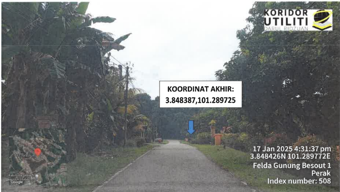
CADANGAN PEMASANGAN TIANG

17 Jan 2025 4:30:45 pm 3.850075N 101.287684E Jalan Medang Perak Index number: 505