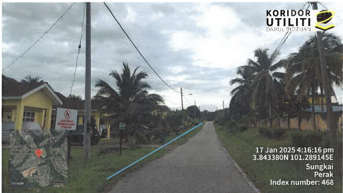
CADANGAN PEMASANGAN TIANG DI JAJARAN SEBELAH KIRI