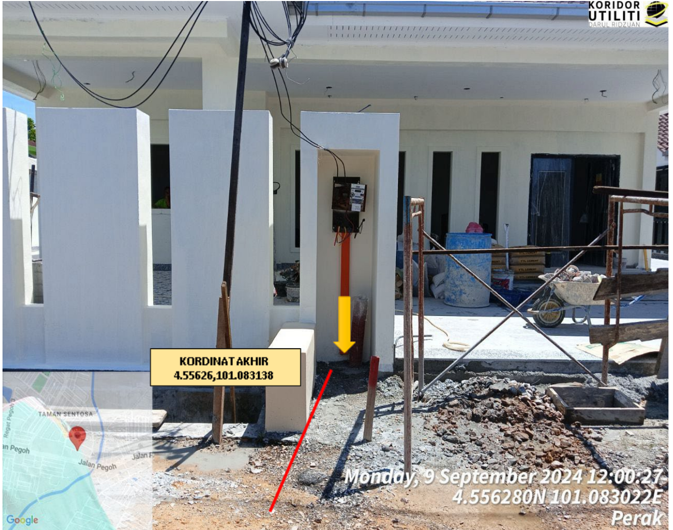
LOKASI DI TINGKAT PASIR PUTIH 5