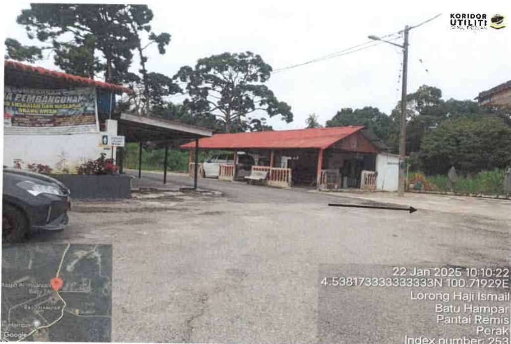
KOORDINAT CADANGAN MANHOLE KEDUA