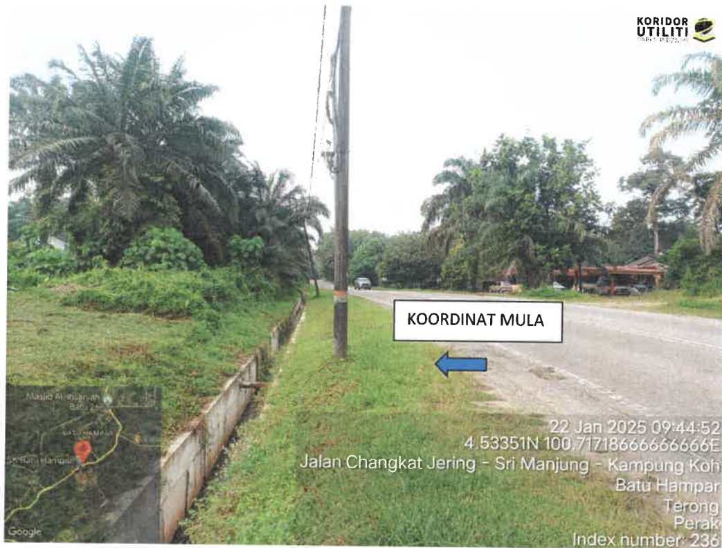
KOORDINAT MULA – HADAPAN SK BATU HAMPAR