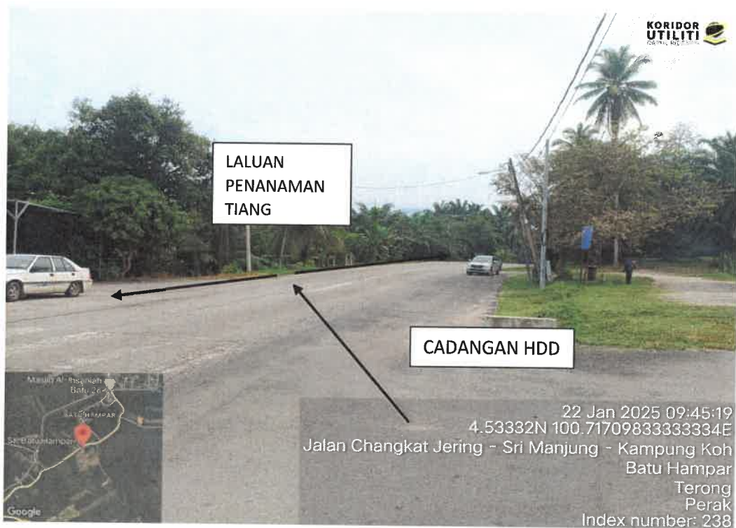
CADANGAN HDD HADAPAN SK BATU HAMPAR