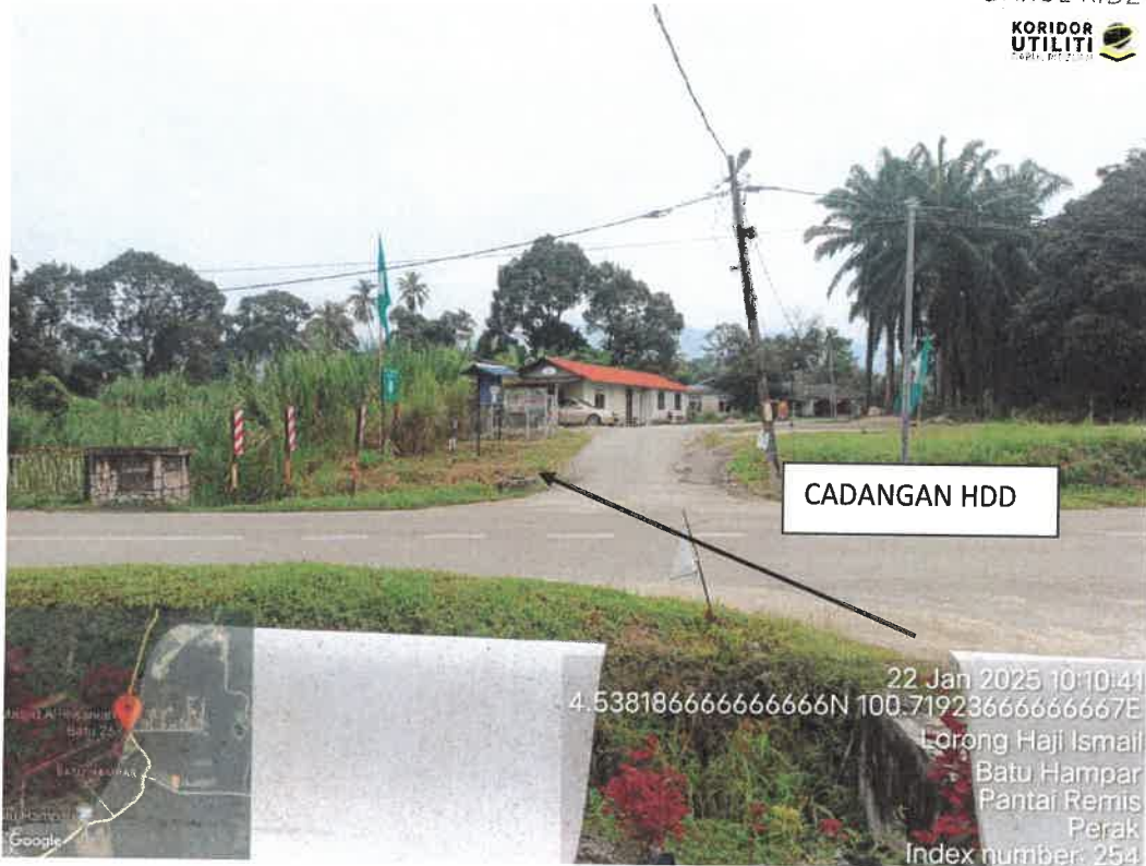
CADANGAN HDD – JALAN BATU HAMPAR