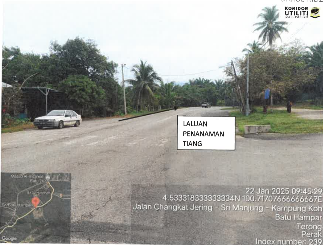
LALUAN PENANAMAN TIANG