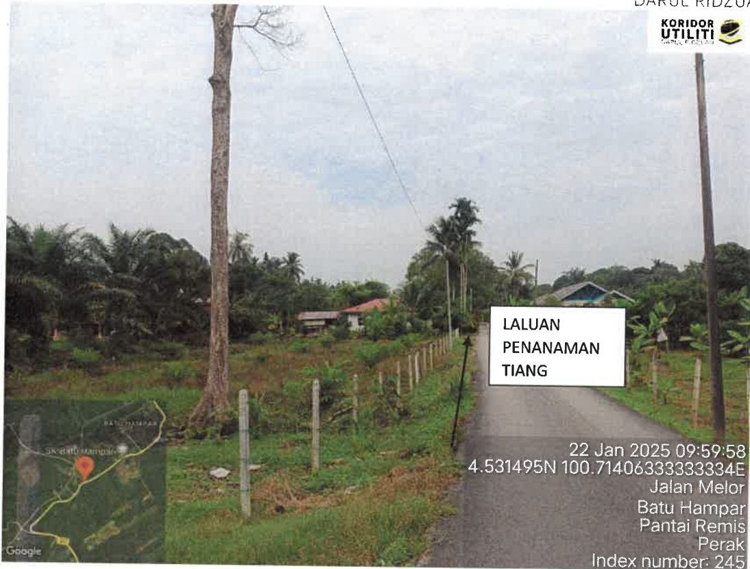
CADANGAN LALUAN PENANAMAN TIANG