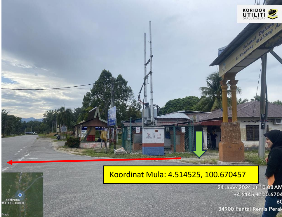
LOKASI DI JALAN JALAN SERI MANJUNG-CHANGKAT JERING FT060