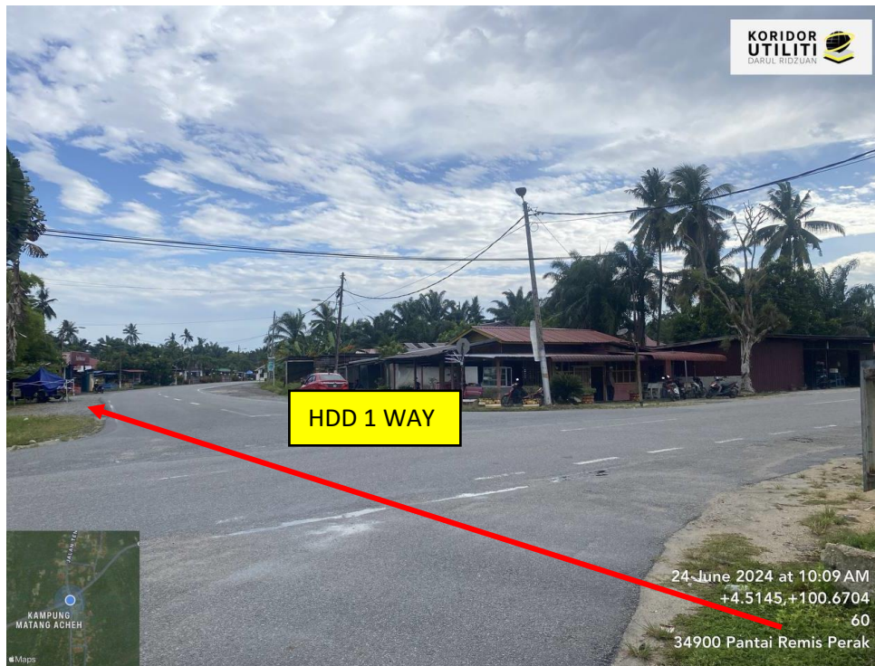
LOKASI DI JALAN JALAN SERI MANJUNG-CHANGKAT JERING FT060