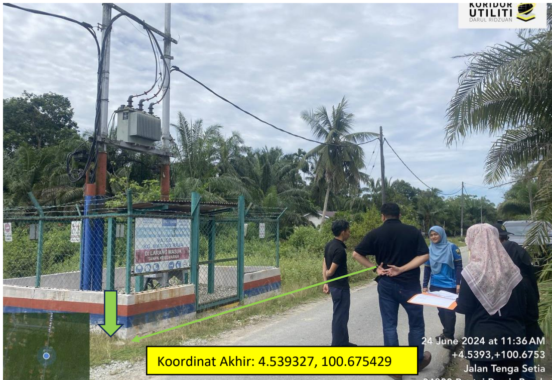
LOKASI DI JALAN PERMATANG RAJA