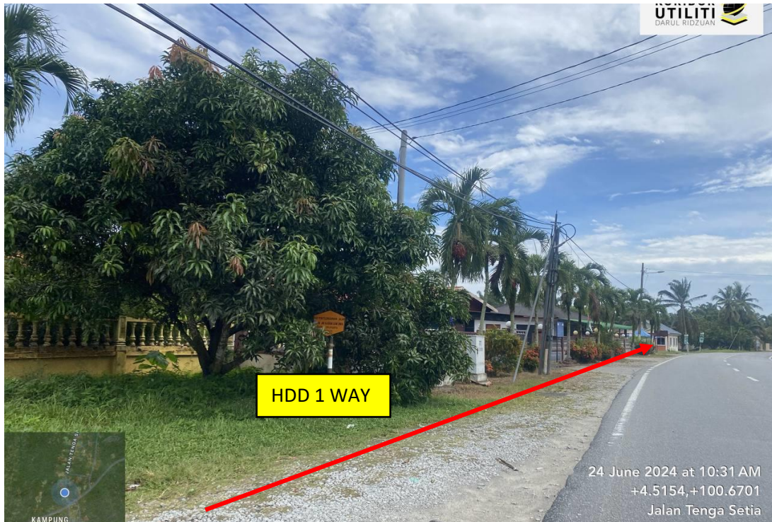
LOKASI DI JALAN TENGA SETIA