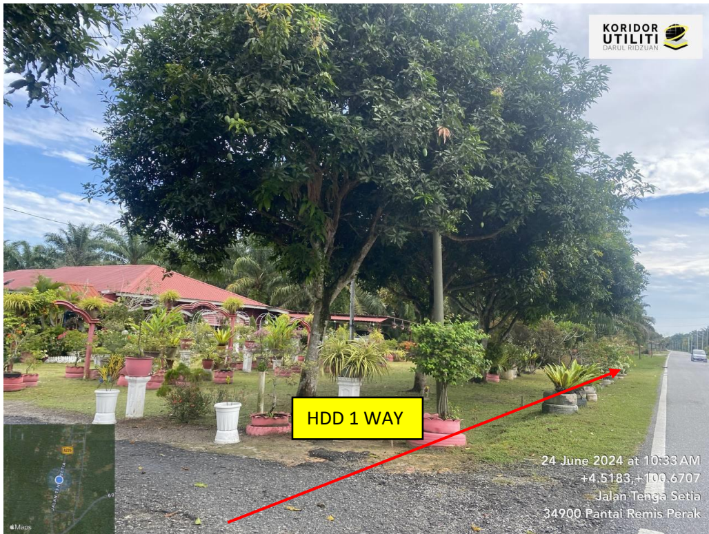
LOKASI DI JALAN TENGA SETIA