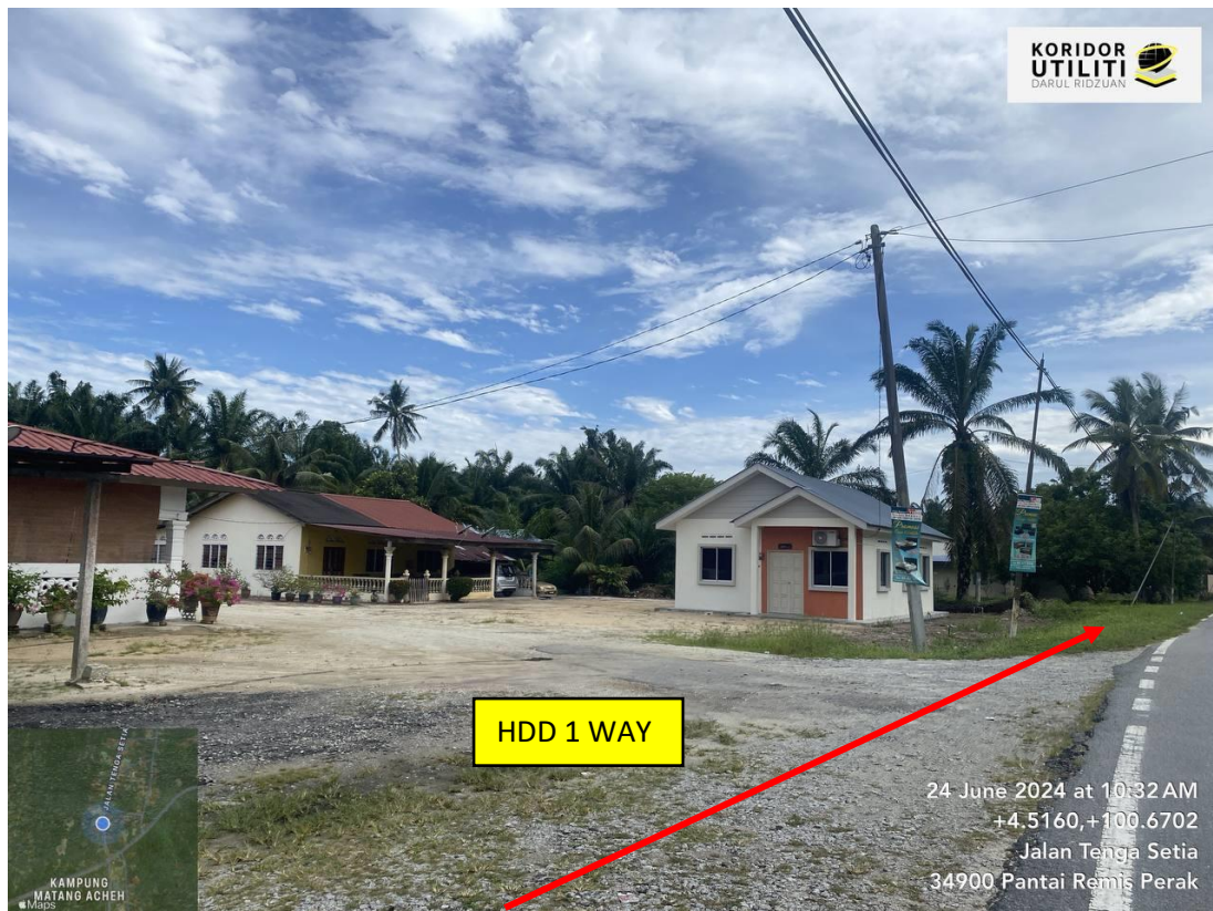
LOKASI DI JALAN TENGA SETIA