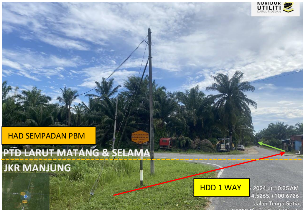
LOKASI DI JALAN TENGA SETIA