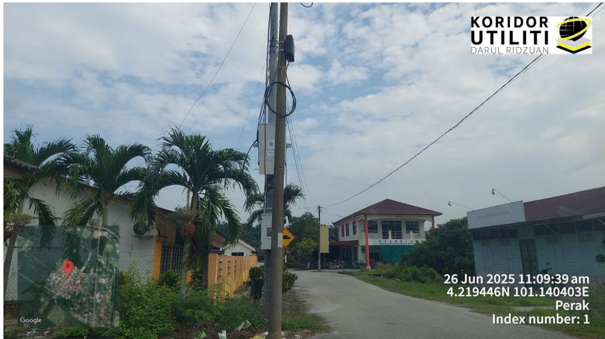
LOKASI FDC DI SJKC SUNGAI KROH