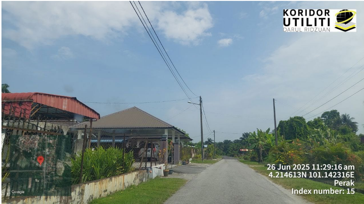
LOKASI DI KG BARU SG KROH