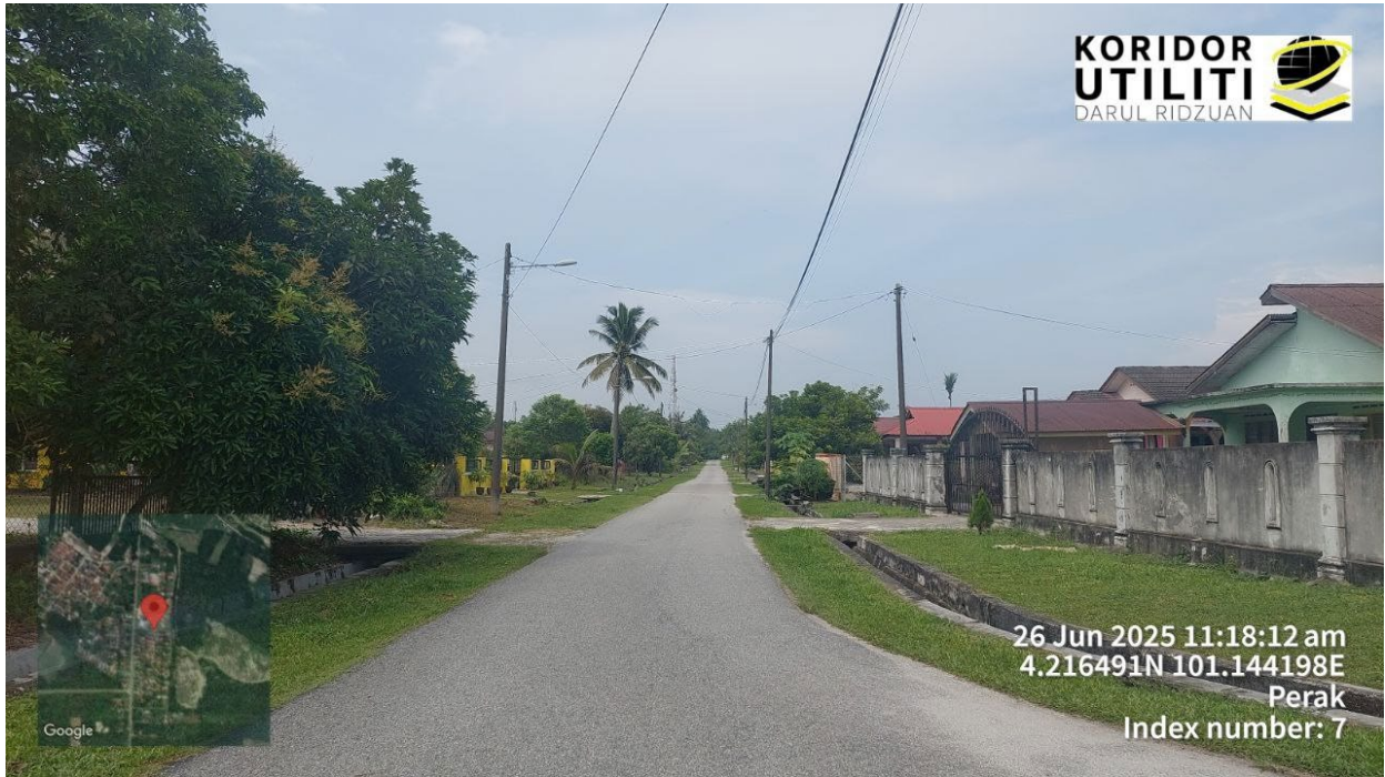
LOKASI DI KG TERSUSUN SG KROH