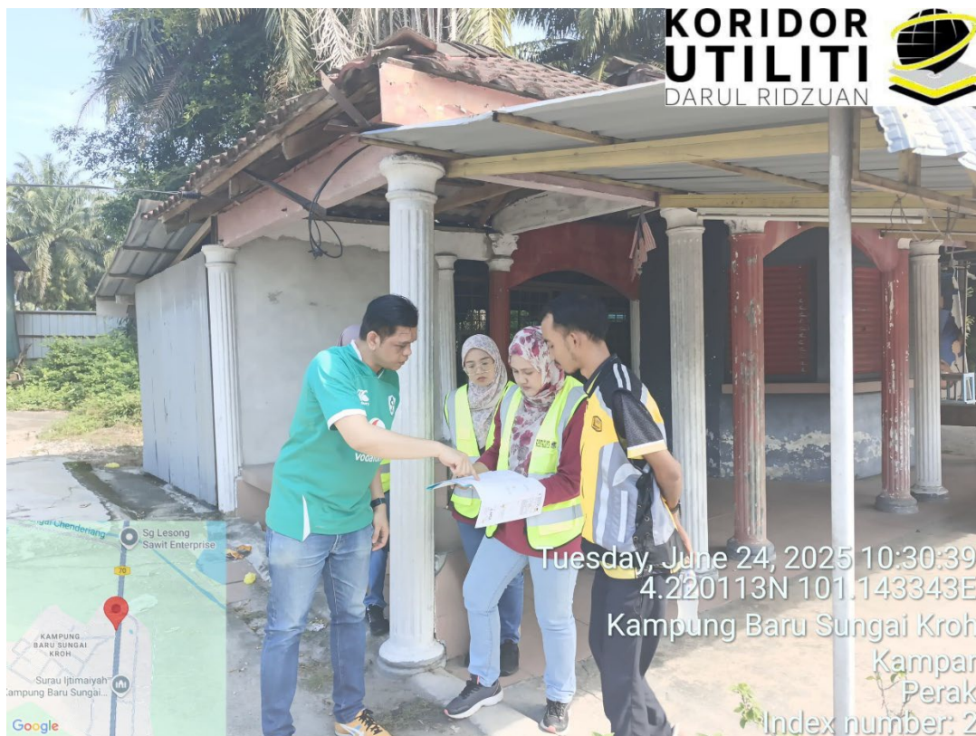
PERBINCANGAN DI TAPAK BERSAMA PEMOHON DAN PJ NAIM