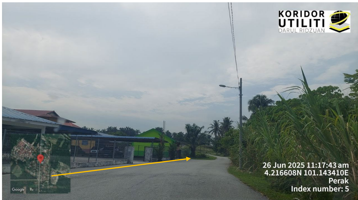
CADANGAN PEMASANGAN UTILITI DI SURAU IJTIMAIYAH