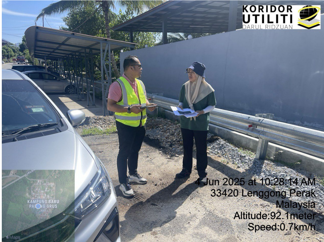
LOKASI DI JALAN AYER KALA