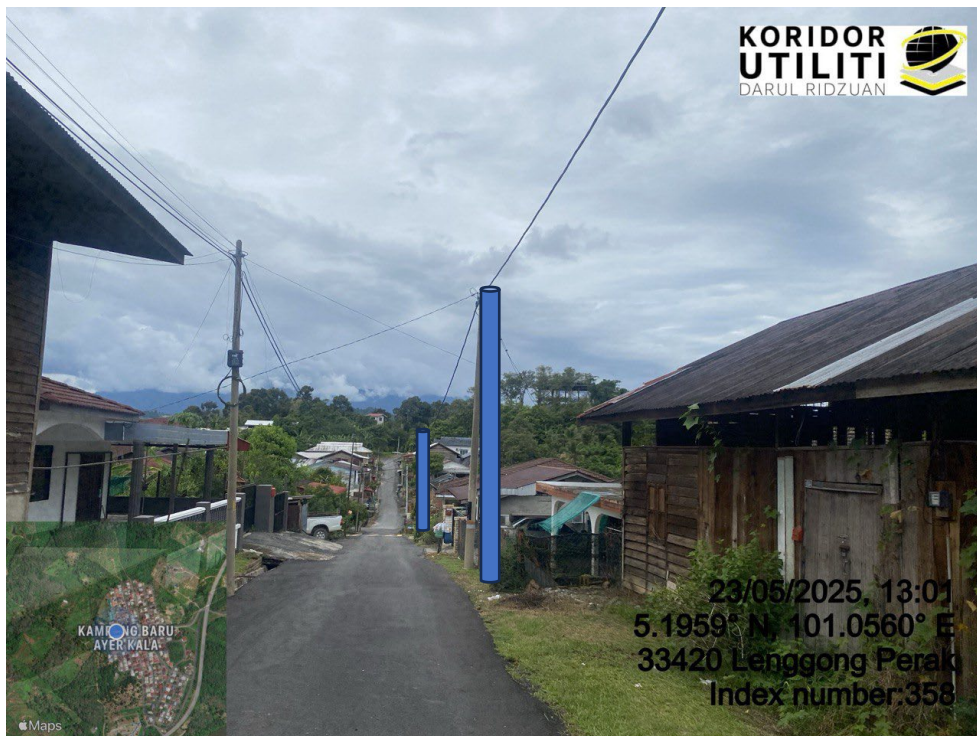
LOKASI DI JALAN AYER KALA