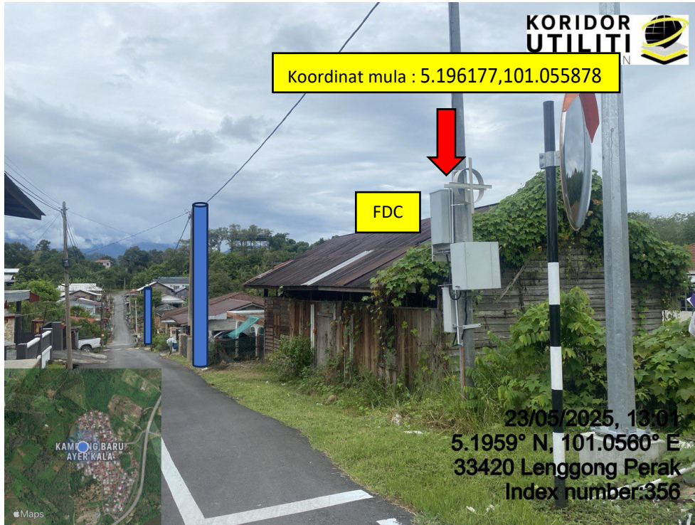
LOKASI DI JALAN AYER KALA