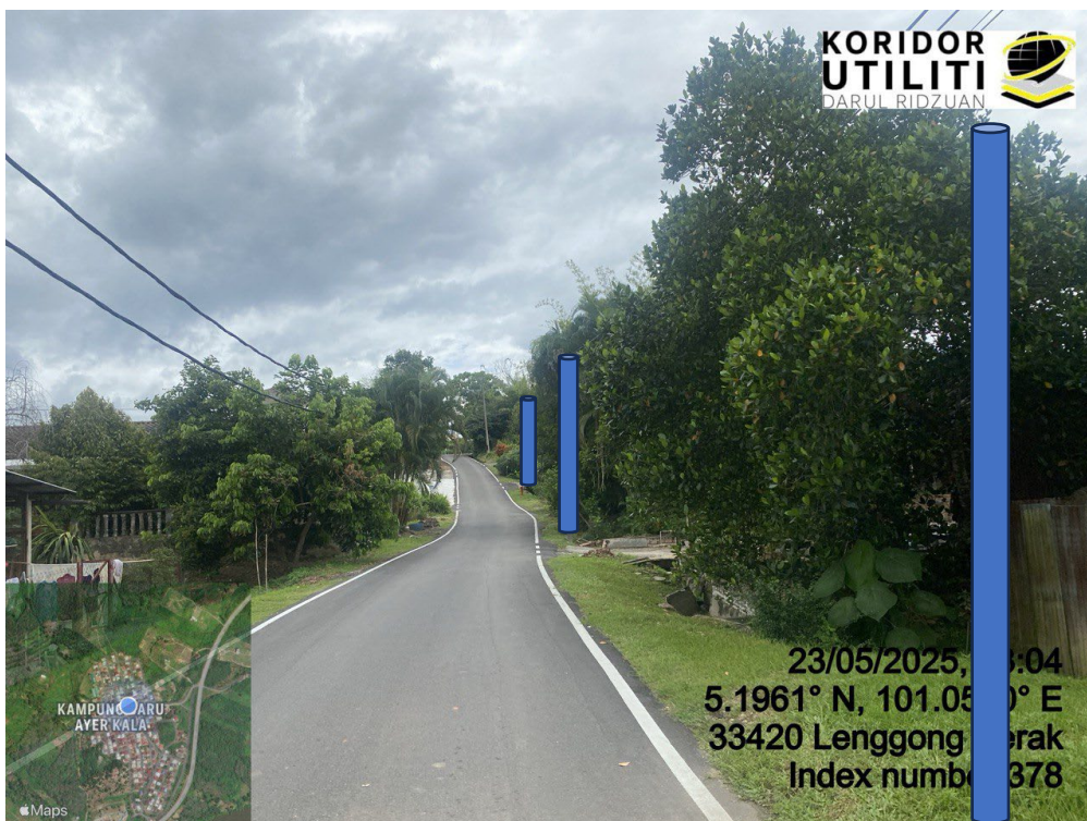
LOKASI DI JALAN AYER KALA