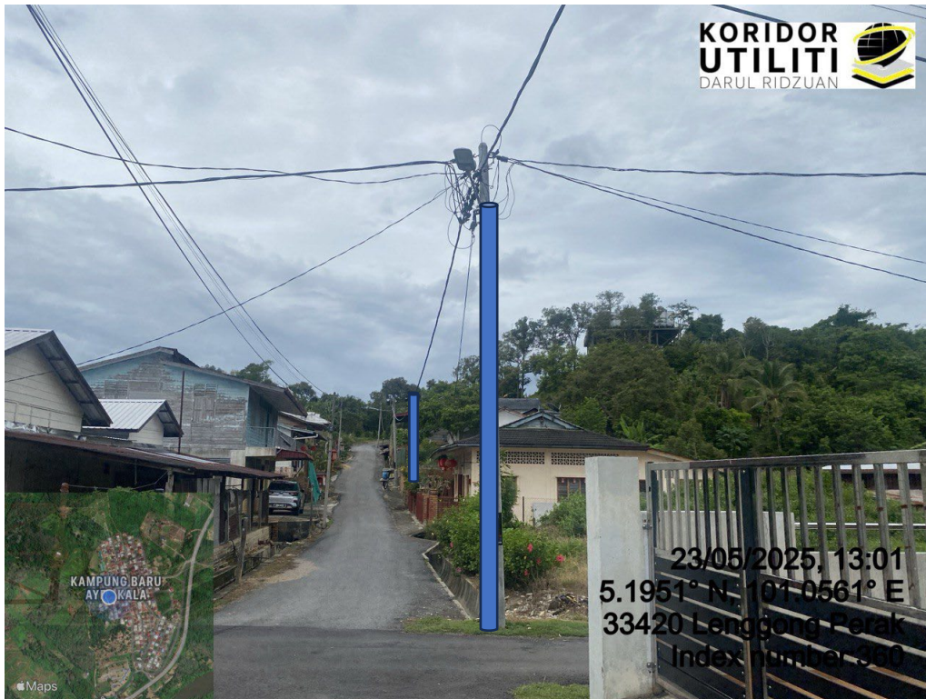
LOKASI DI JALAN AYER KALA