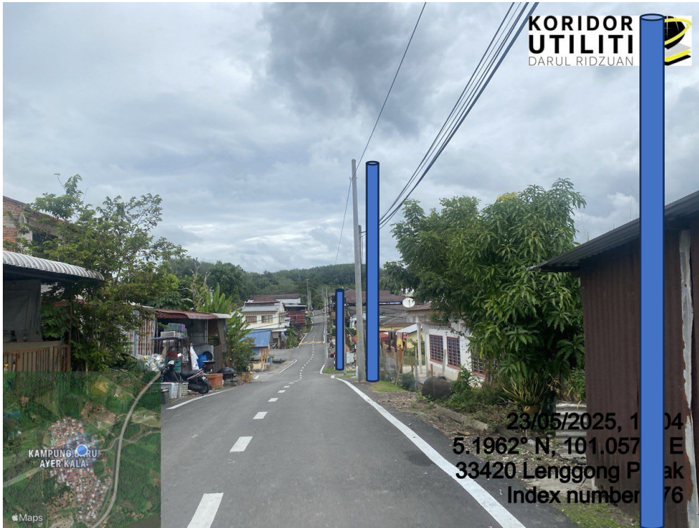
LOKASI DI JALAN AYER KALA