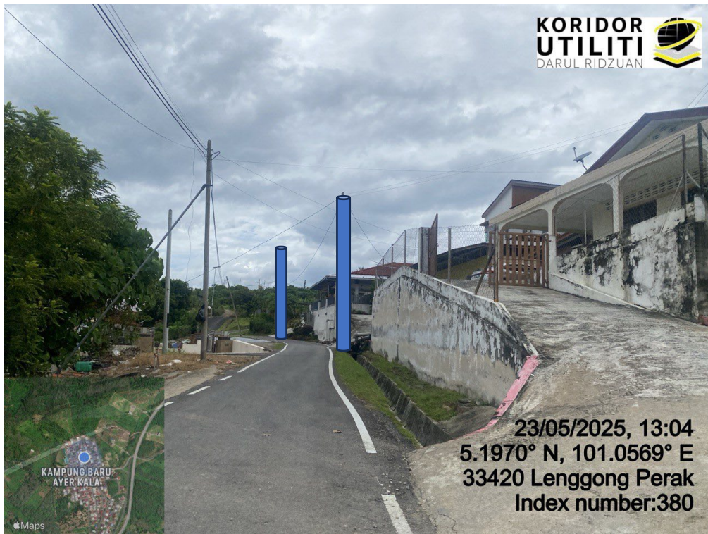
LOKASI DI JALAN AYER KALA