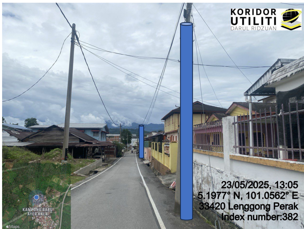
LOKASI DI JALAN AYER KALA