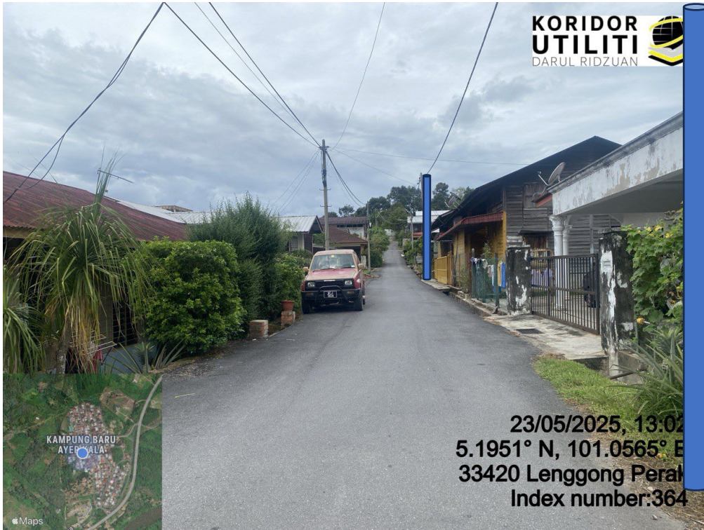
LOKASI DI JALAN AYER KALA