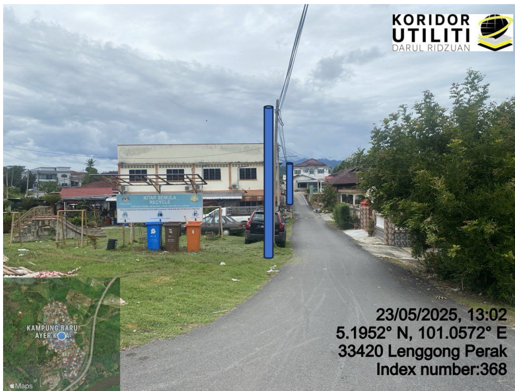
LOKASI DI JALAN AYER KALA