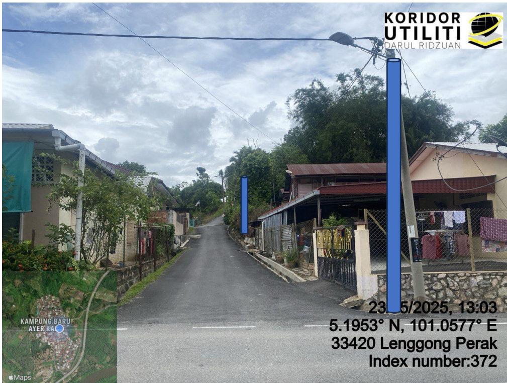
LOKASI DI JALAN AYER KALA