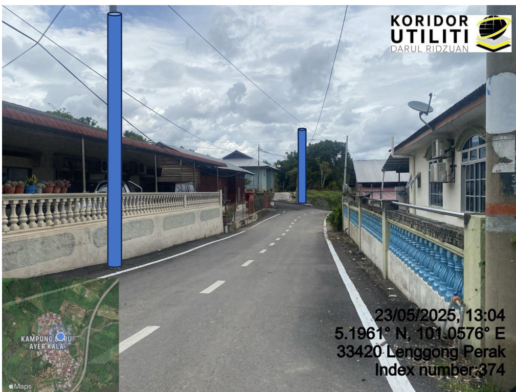
LOKASI DI JALAN BESAR KUAH