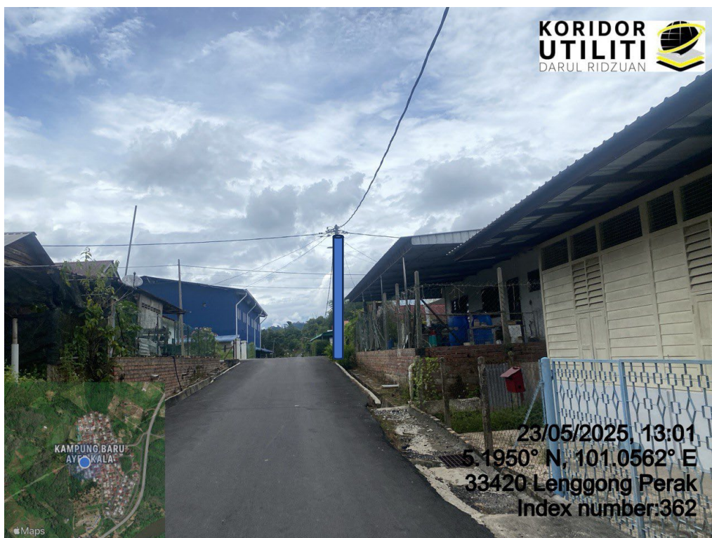
LOKASI DI JALAN AYER KALA