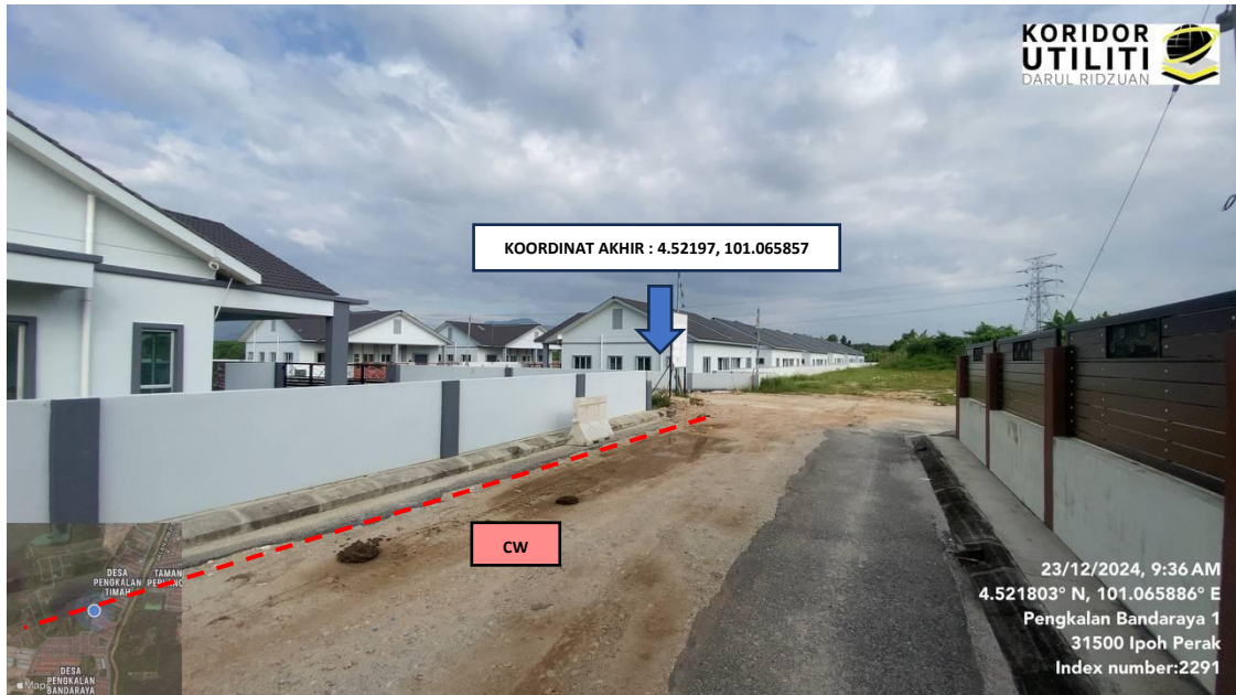
LOKASI KOORDINAT AKHIR KOREKAN TERBUKA DI PENKALAN BANDARAYA 1 (LORONG TEPI)