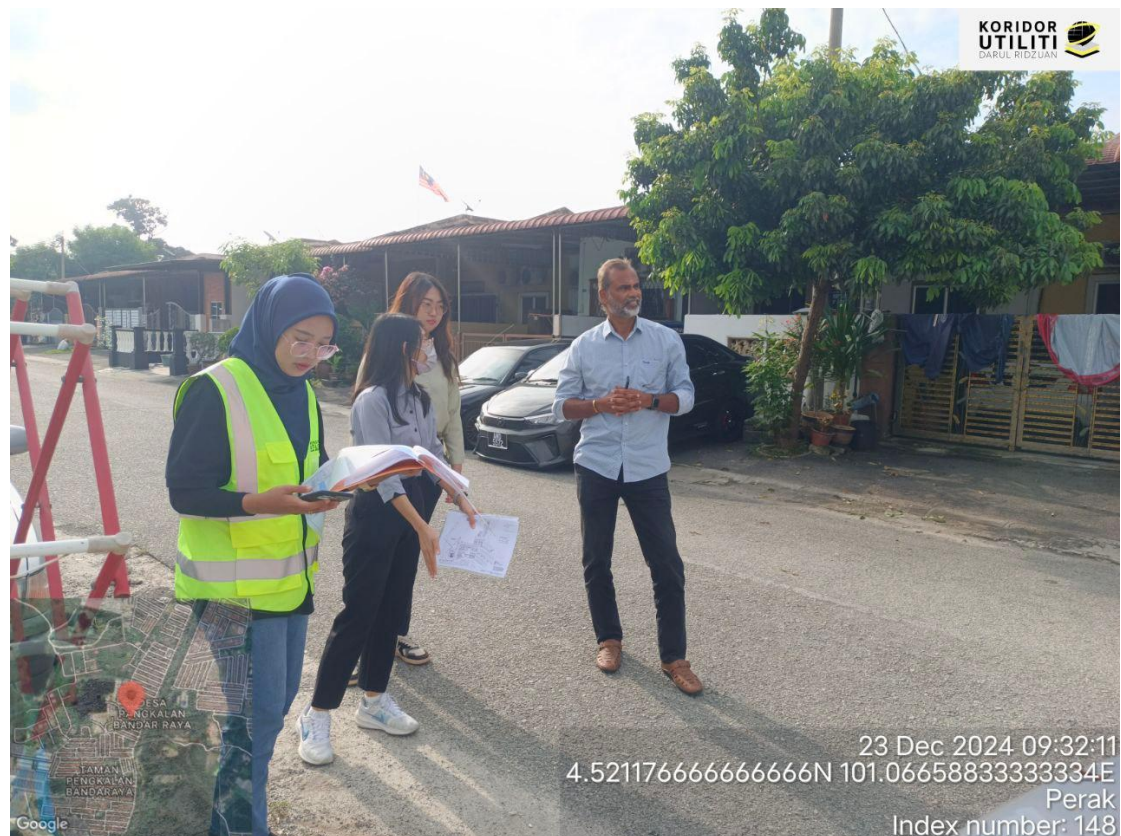
LAWATAN TAPAK AWALAN BERSAMA WAKIL MBI DAN PEMOHON