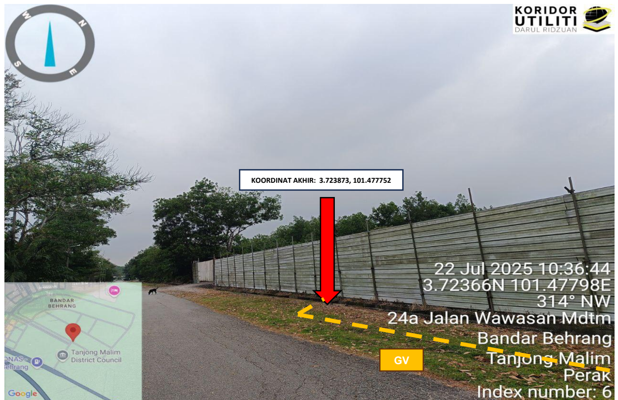
Rajah 6: Jalan Wawasan Industri 5