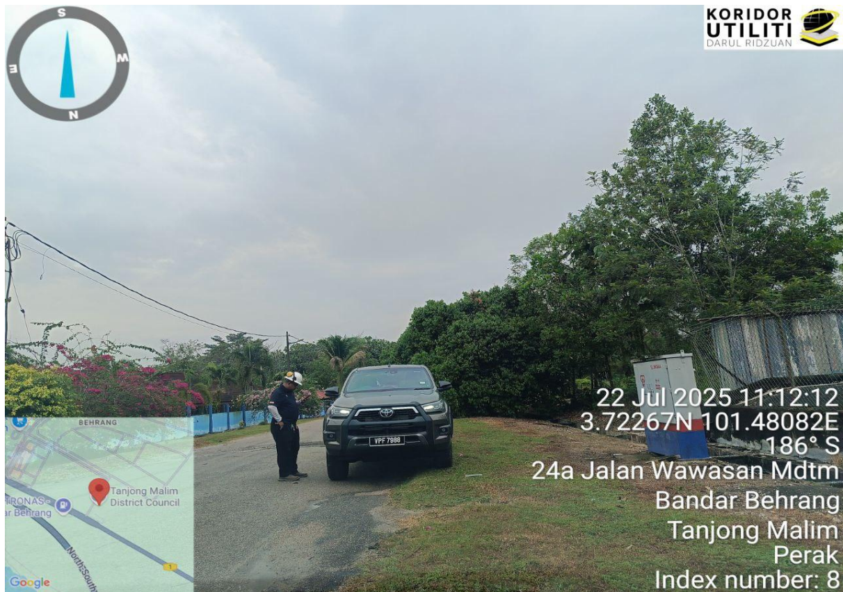
Rajah 7: Perbincangan bersama Pemohon dan Penyedia Utiliti berkenaan jajaran dan kaedah korekan