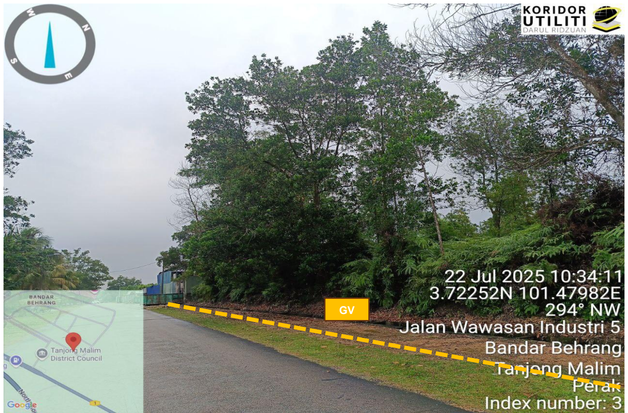
Rajah 3: Jalan Wawasan Industri 5