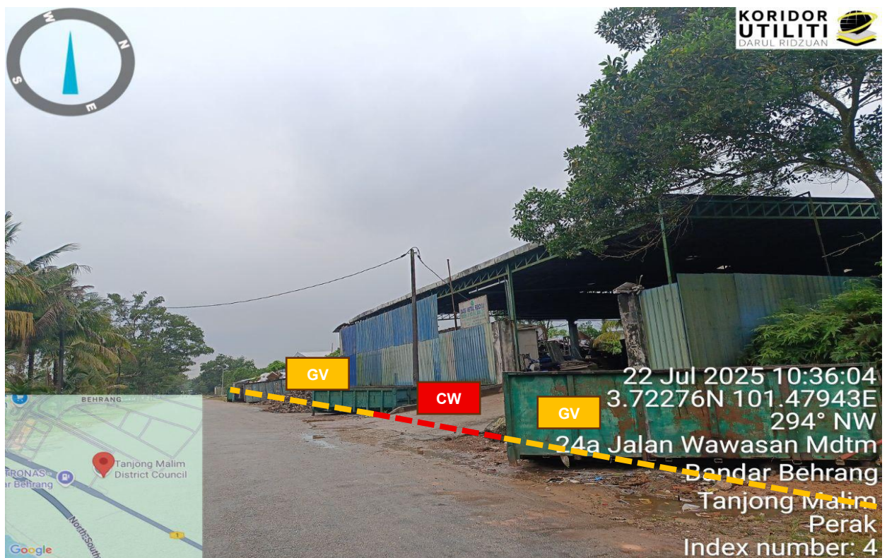
Rajah 4: Jalan Wawasan Industri 5