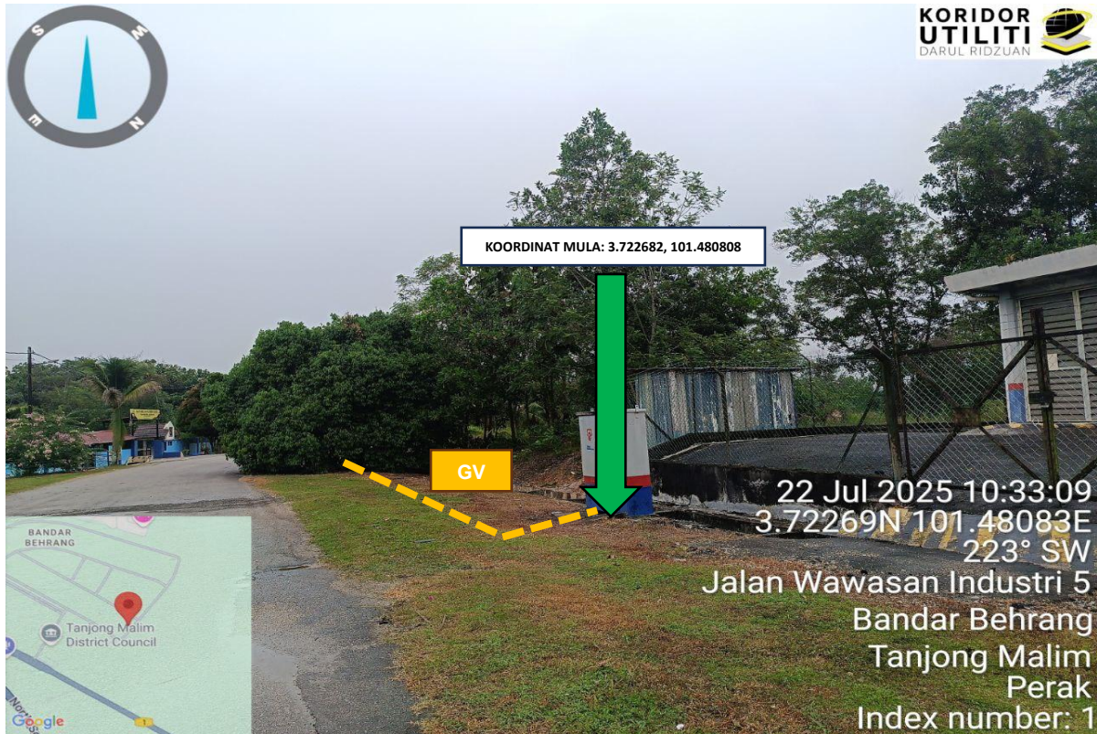
Rajah 1: Lokasi Koordinat Mula Jalan Wawasan Industri 5