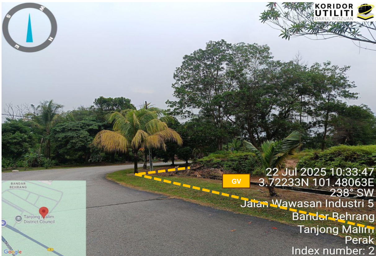
Rajah 2: Jalan Wawasan Industri 5