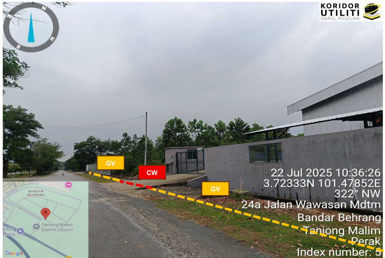
Rajah 5: Jalan Wawasan Industri 5