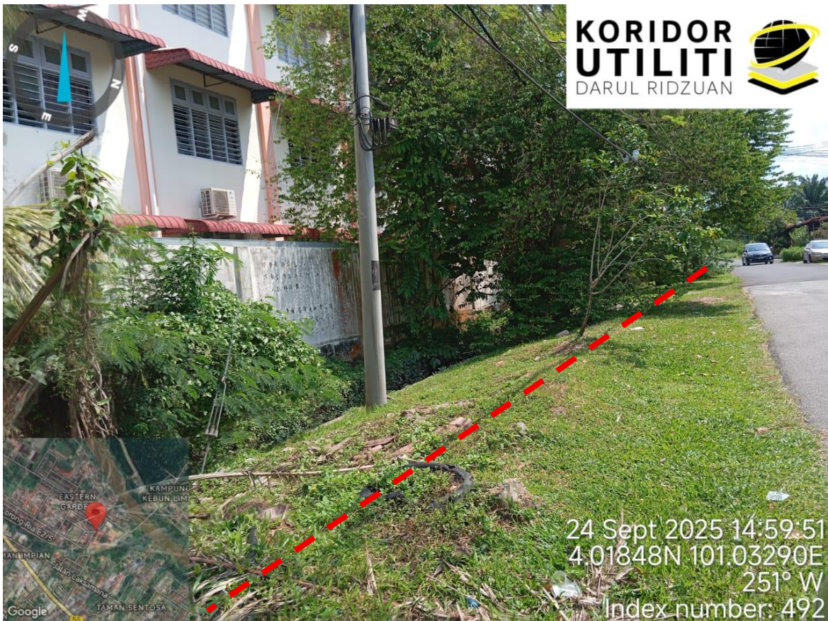
Lorong Ria E2/3c