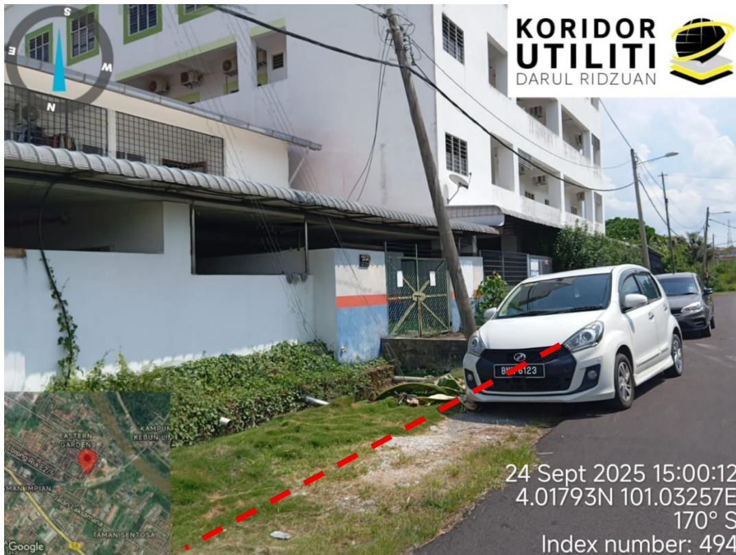
Lorong Ria E2/3c