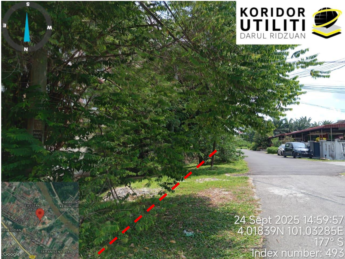
Lorong Ria E2/3c