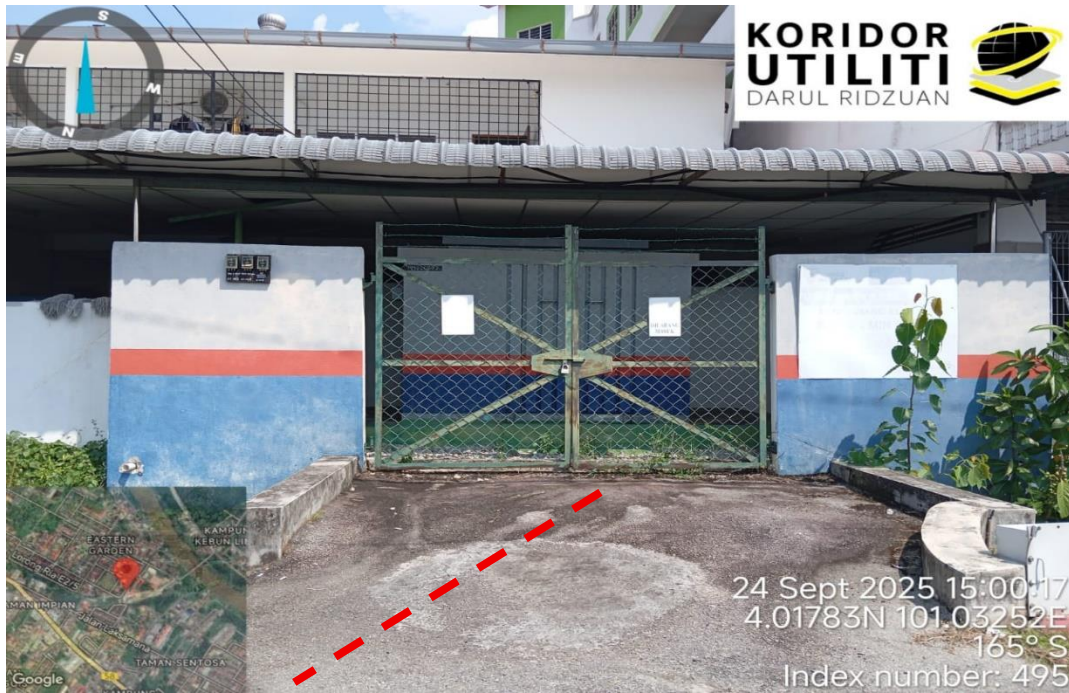
Lorong Ria E2/3c