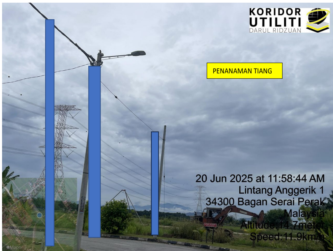
LOKASI DI JALAN TAMAN PONGSU ANGGERIK