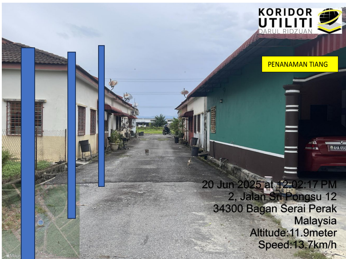
LOKASI DI JALAN TAMAN SERI PONGSU