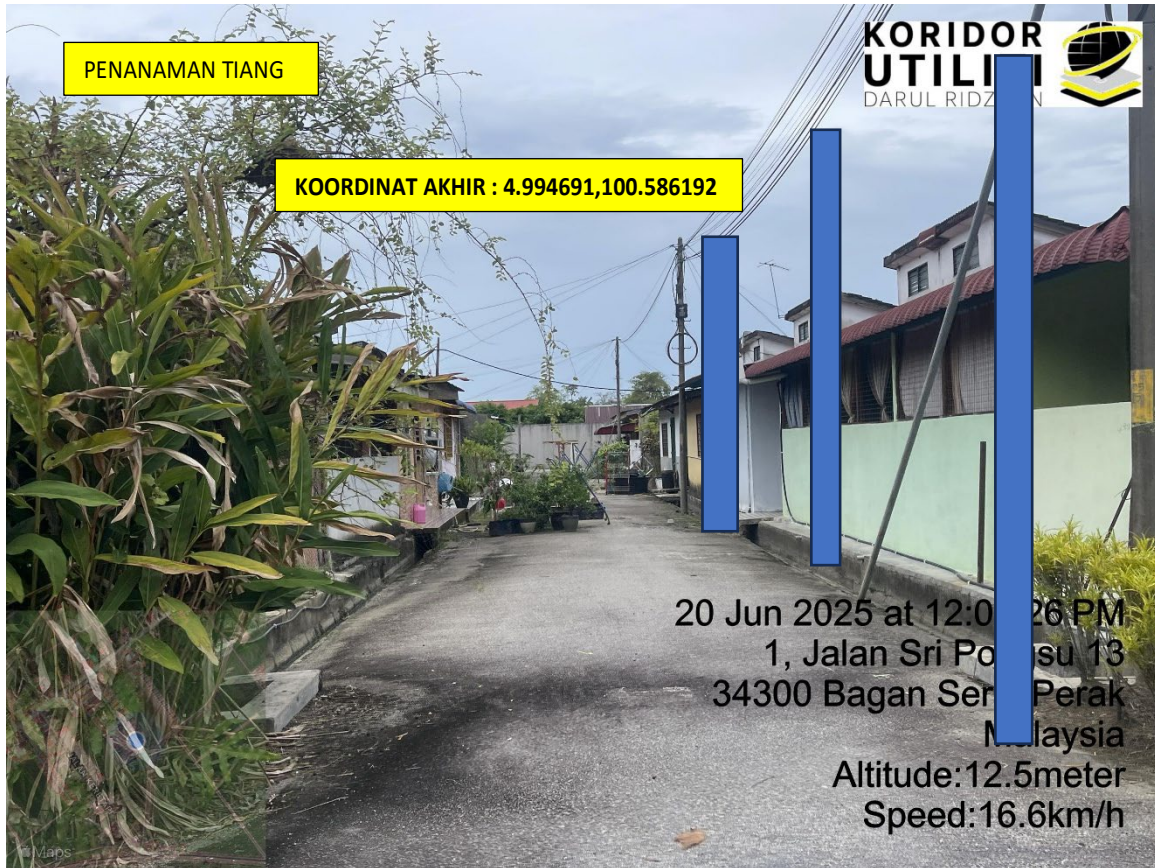
LOKASI DI JALAN TAMAN SERI PONGSU