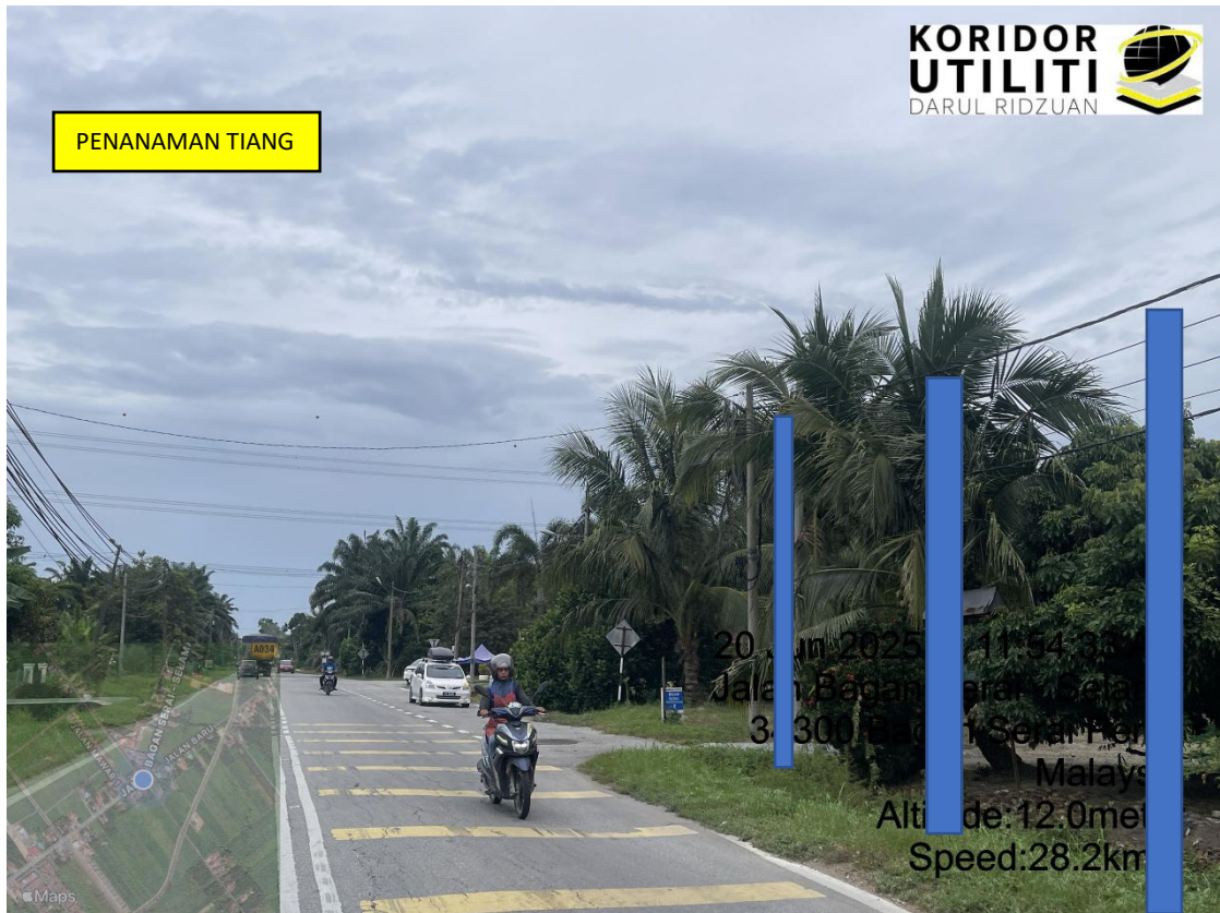
LOKASI DI JALAN BAGAN SERAI - SELAMA