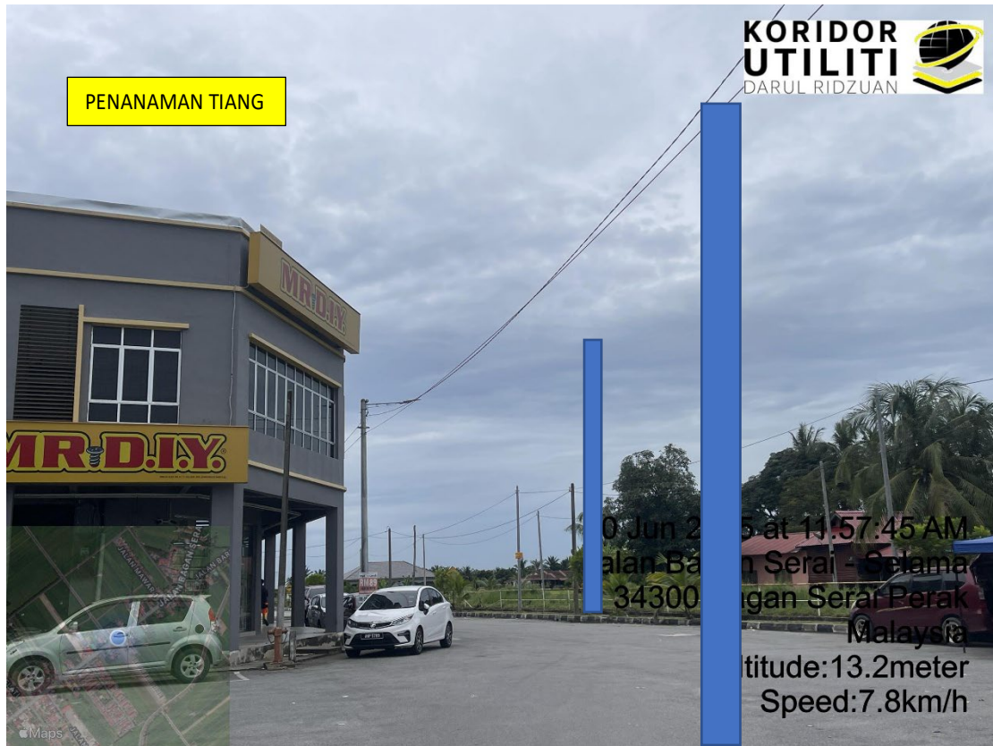
LOKASI DI JALAN TAMAN PONGSU ANGGERIK