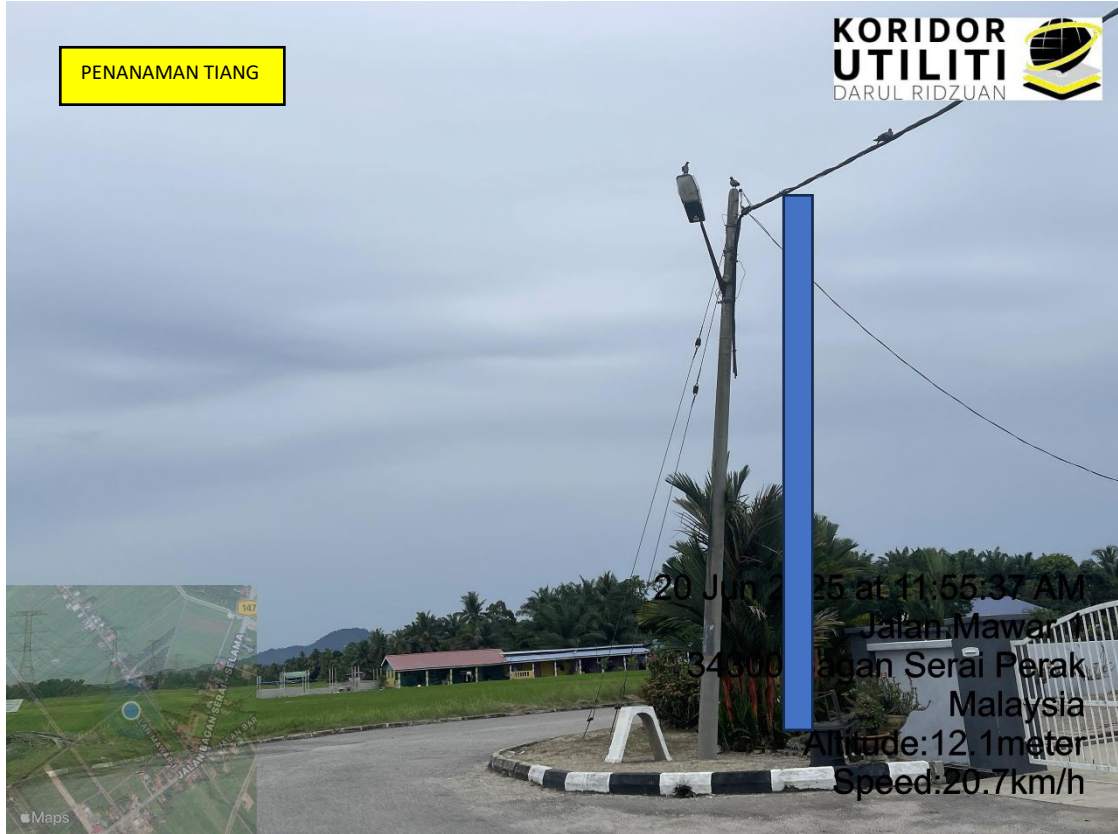
LOKASI DI JALAN TAMAN PONGSU MAWAR