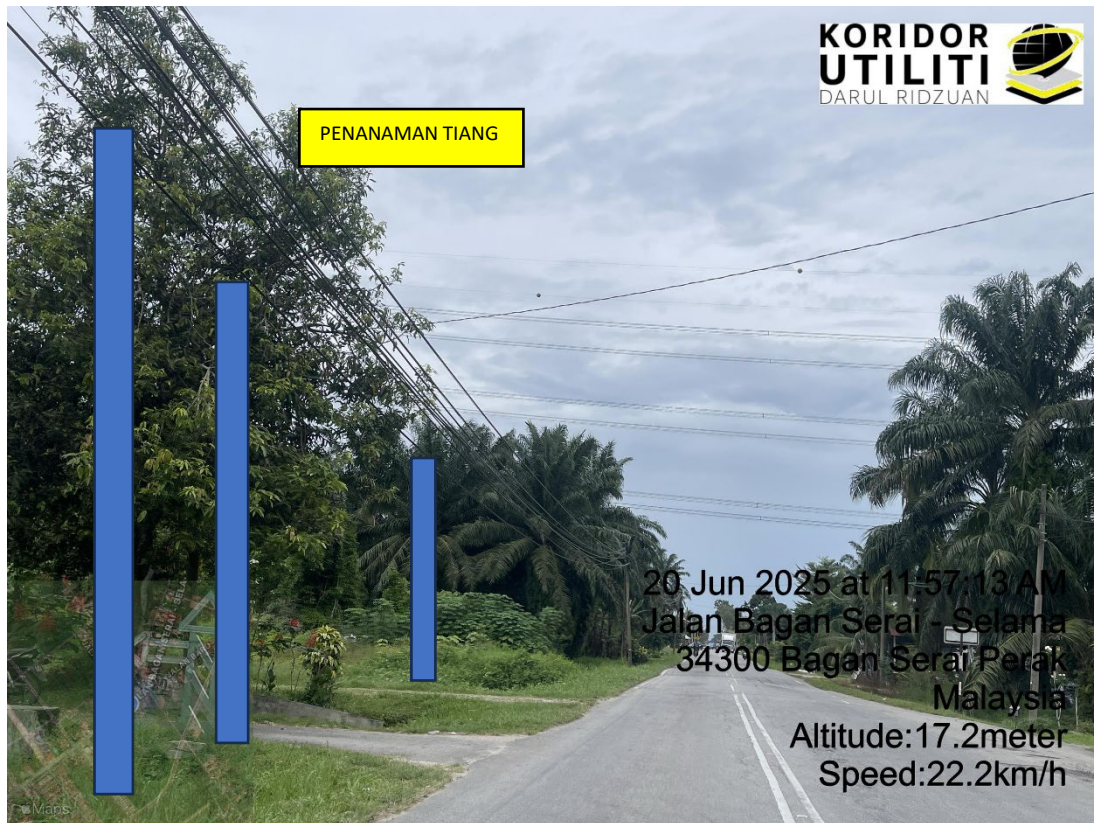
LOKASI DI JALAN BAGAN SERAI – SELAMA