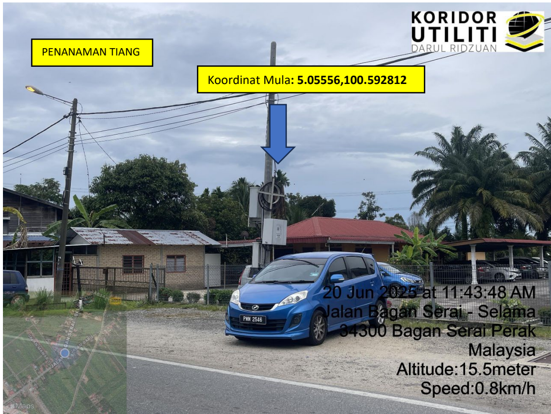
LOKASI DI JALAN BAGAN SERAI – SELAMA