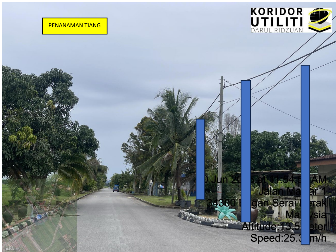
LOKASI DI JALAN TAMAN PONGSU MAWAR