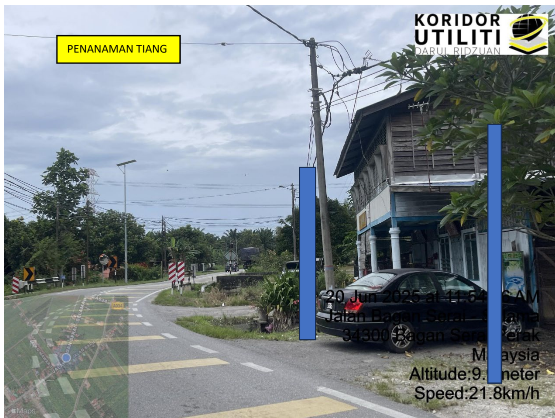
LOKASI DI JALAN BAGAN SERAI – SELAMA