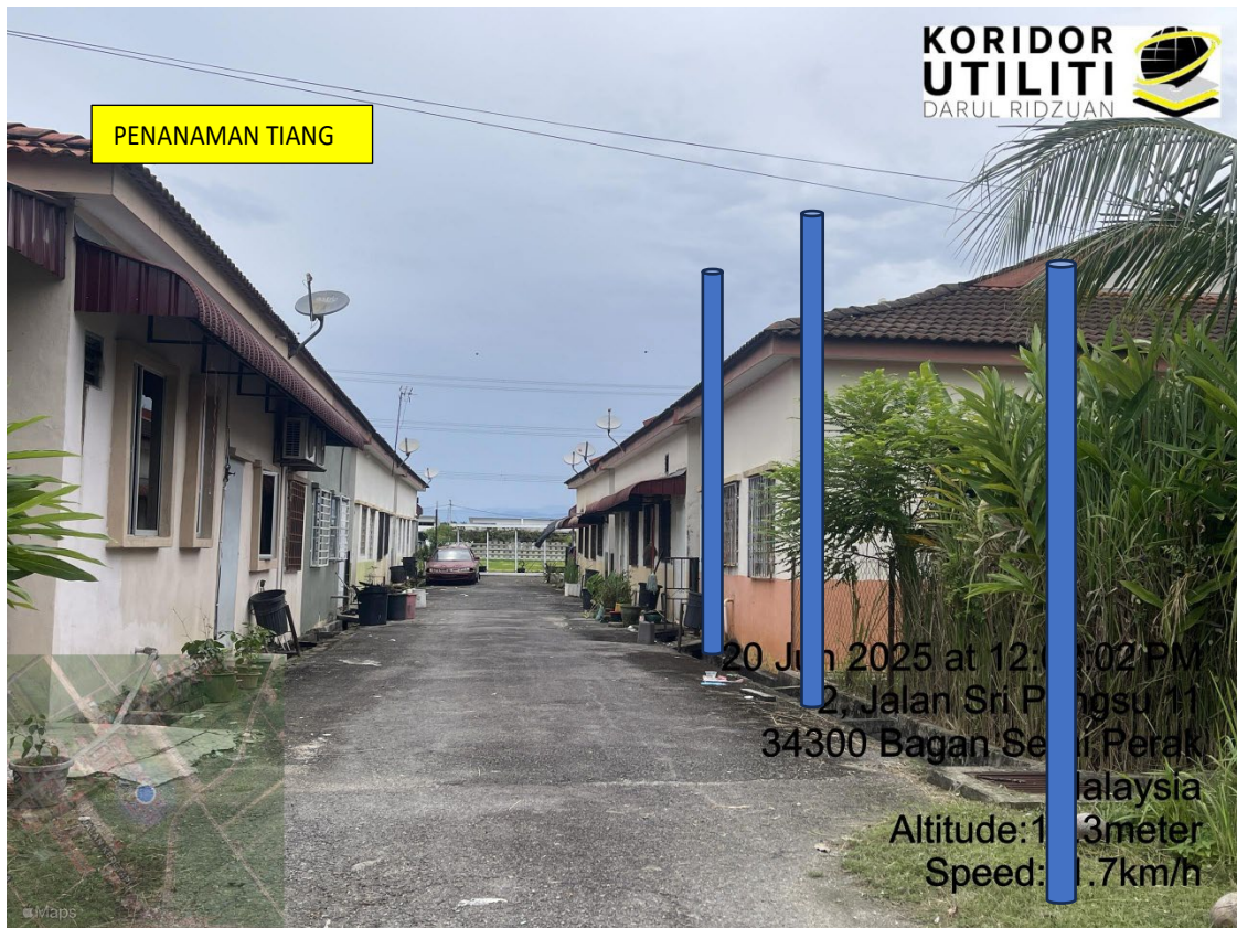
LOKASI DI JALAN TAMAN SRI PONGSU