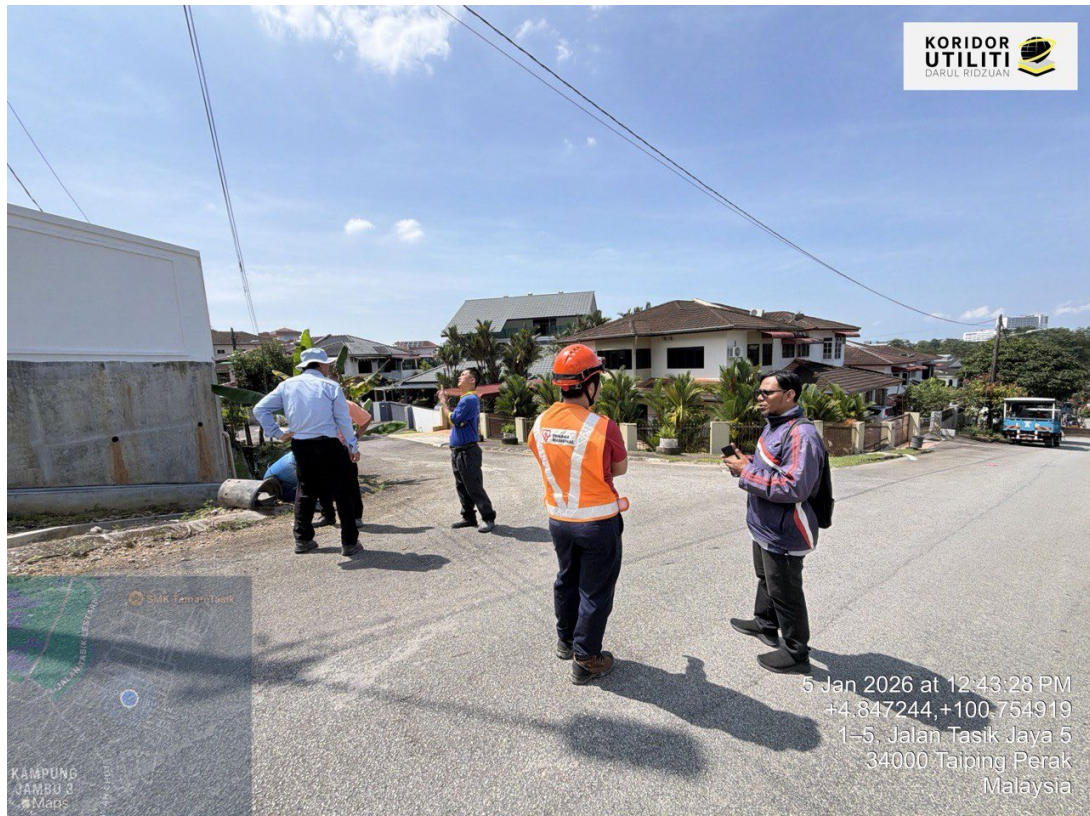
PERBINCANGAN LALUAN DAN KAEDAH BERSAMA PBM DAN PEMOHON