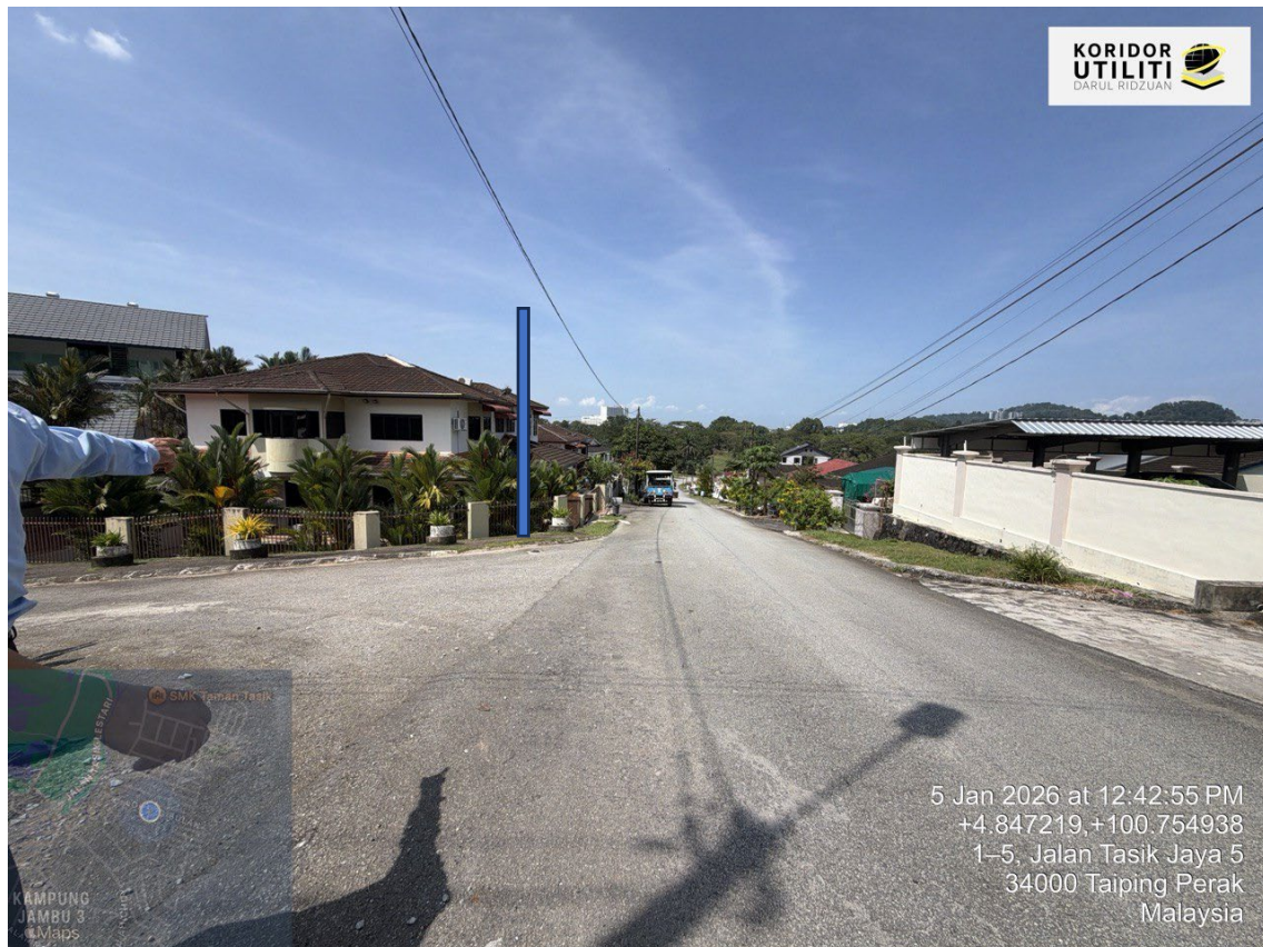
KEDUDUKAN TIANG CADANGAN DI JALAN MPT