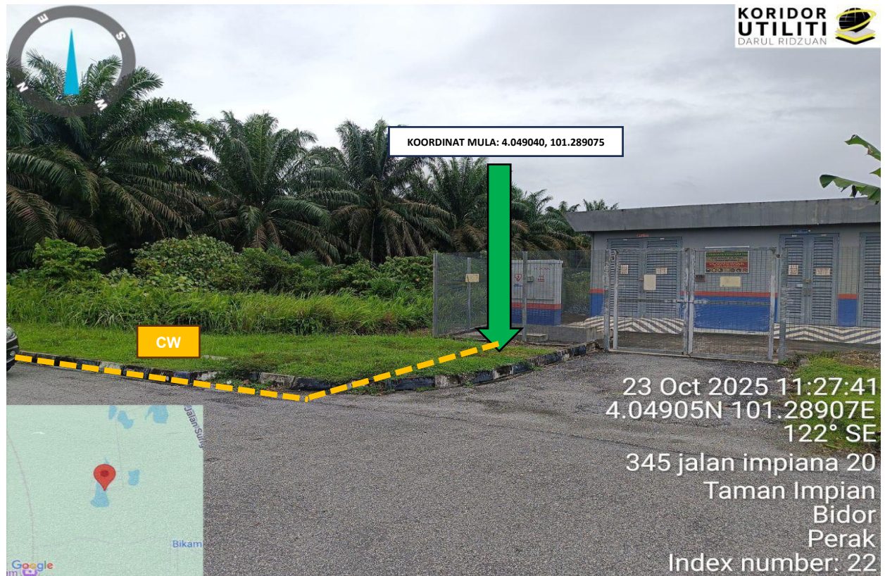
Rajah 1: Lokasi Koordinat Mula Jalan Impiana 18