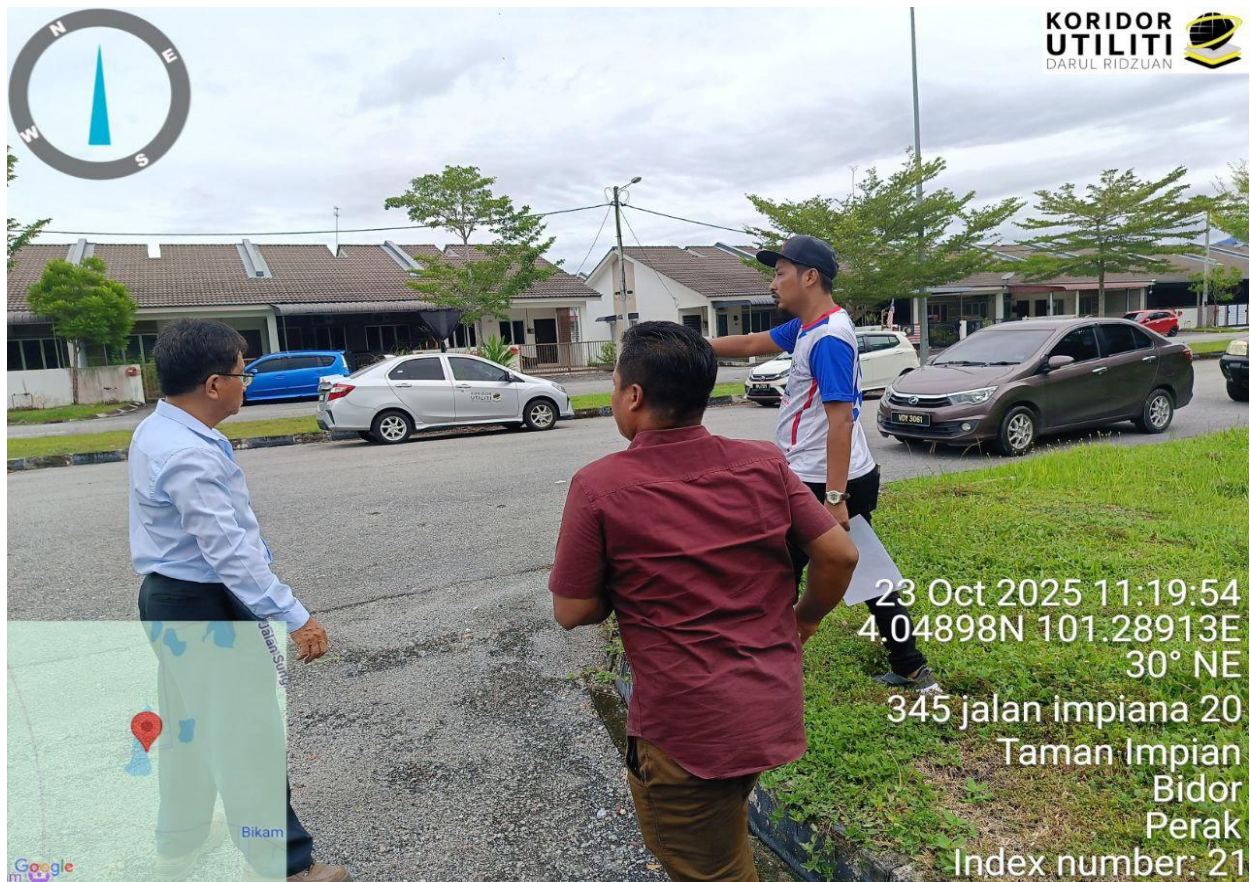
Rajah 5: Perbincangan bersama Pemohon dan Penyedia Utiliti berkenaan jajaran dan kaedah korekan