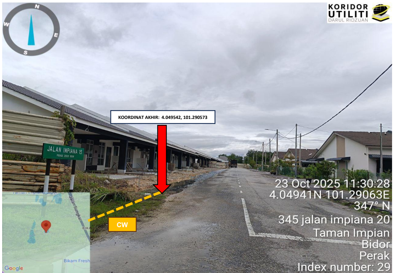
Rajah 4: Lokasi Koordinat Akhir Jalan Impiana 15