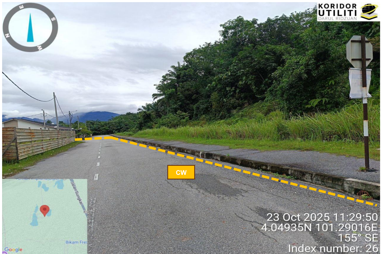
Rajah 3: Jalan Impiana 18