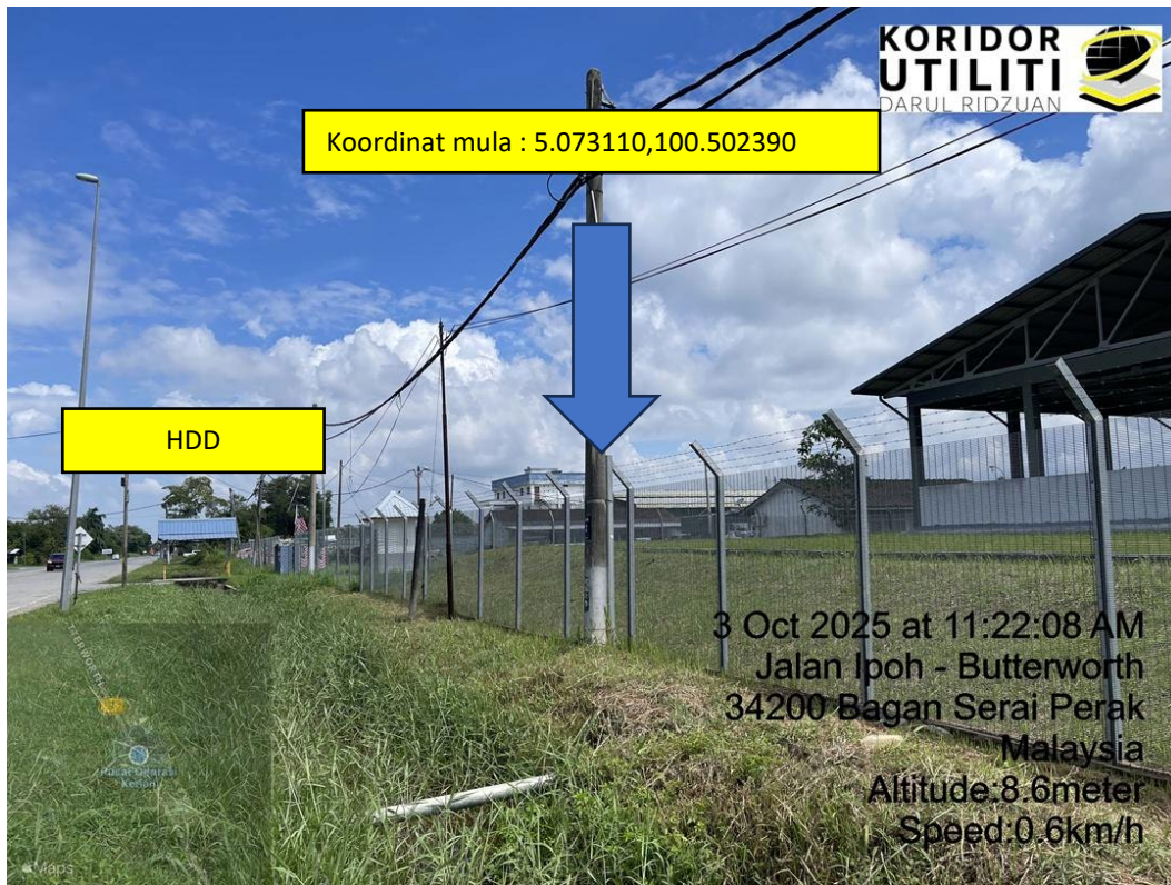
LOKASI DI JALAN BAGAN SERAI – PARIT BUNTAR