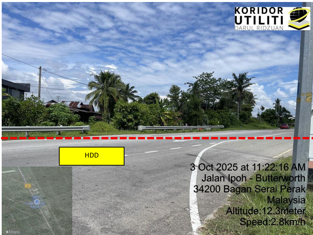
LOKASI DI JALAN BAGAN SERAI – PARIT BUNTAR