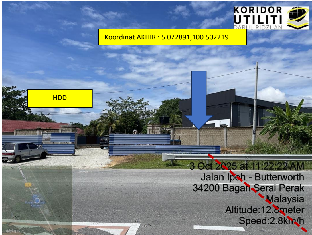
LOKASI DI JALAN PANTAI