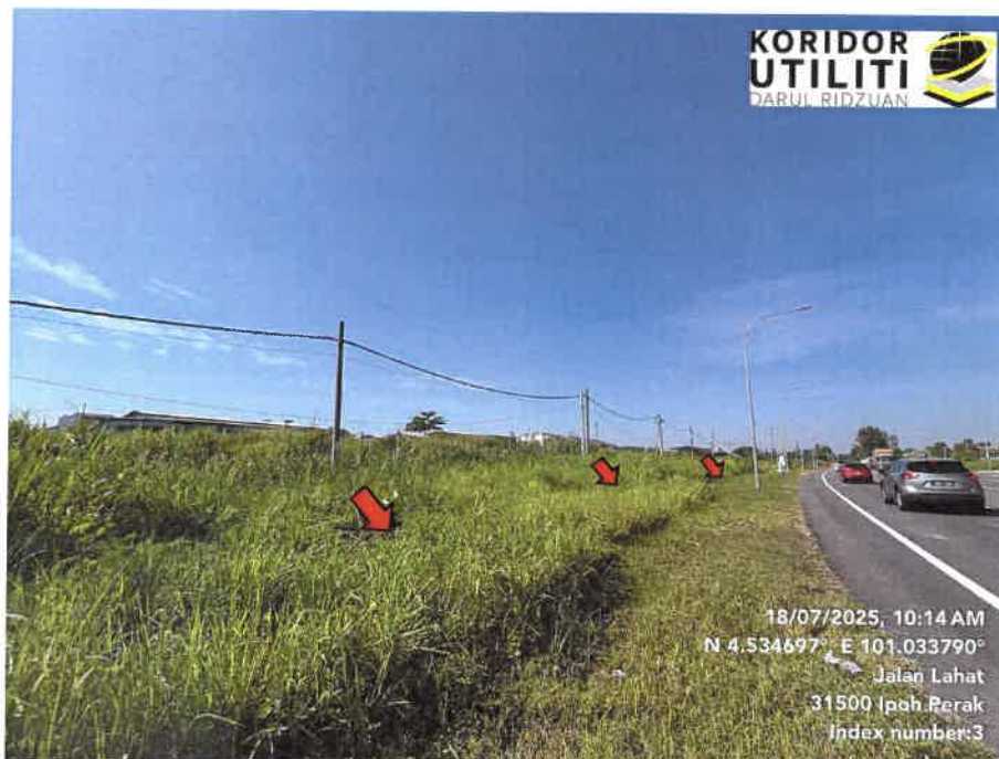
JAJARAN KERJA PENGALIHAN TIANG DI JALAN LAHAT – PUSING (A2)