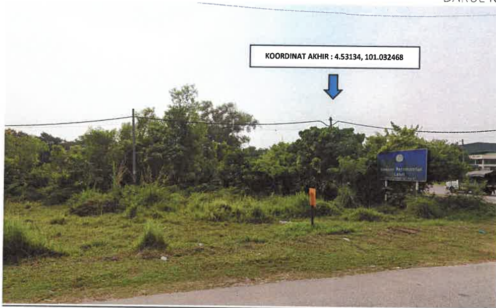
LOKASI KOORDINAT AKHIR PENGALIHAN TIANG DI JALAN LAHAT – PUSING (A2)