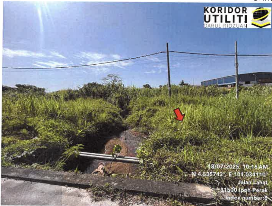
JAJARAN KERJA PENGALIHAN TIANG DI JALAN LAHAT – PUSING (A2)