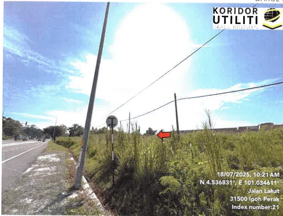
JAJARAN KERJA PENGALIHAN TIANG DI JALAN LAHAT – PUSING (A2)