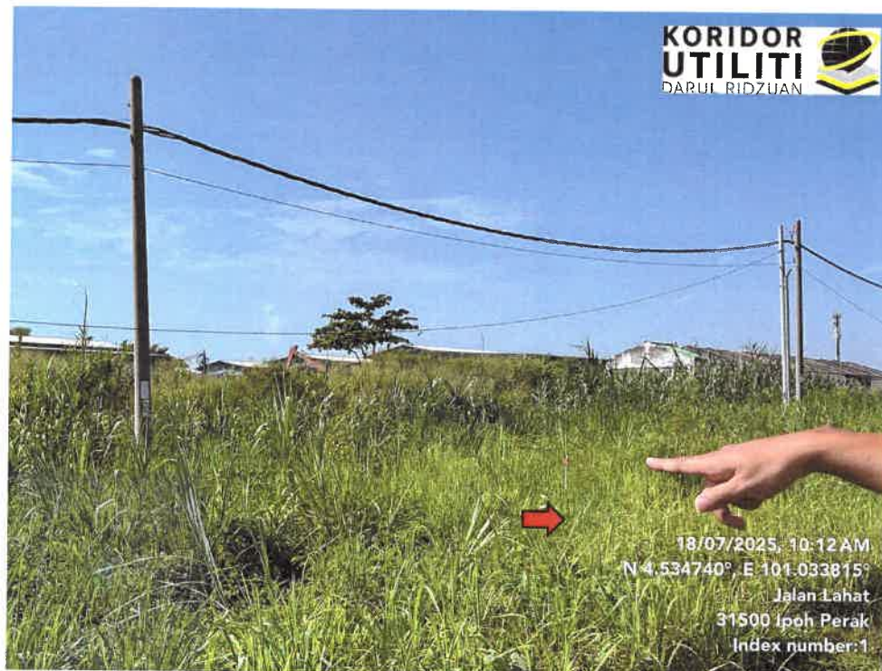
JAJARAN KERJA PENGALIHAN TIANG DI JALAN LAHAT – PUSING (A2)