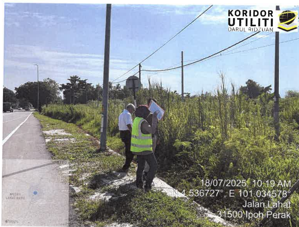
LAWATAN TAPAK AWALAN BERSAMA PEMOHON