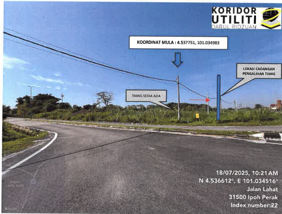
LOKASI KOORDINAT MULA PENGALIHAN TIANG DI JALAN LAHAT – PUSING (A2)