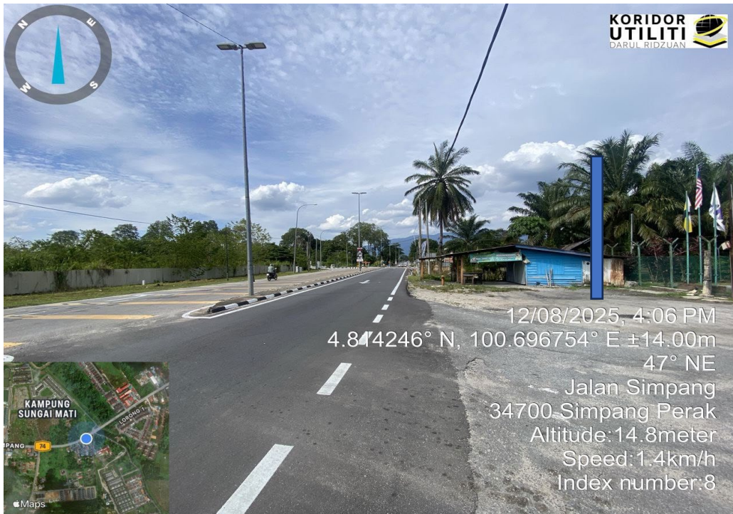
CADANGAN TIANG – KOORDINAT MULA