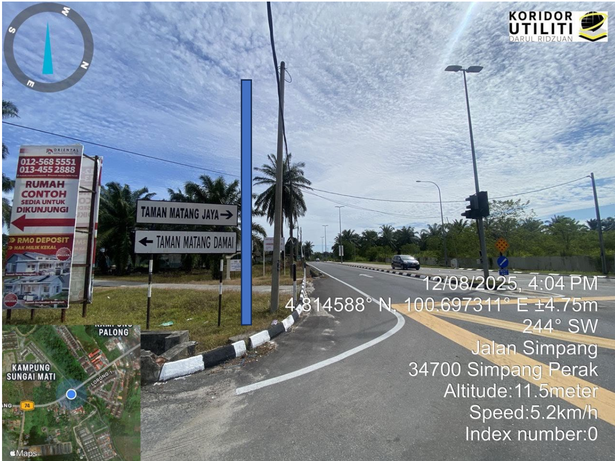
CADANGAN PENANAMAN TIANG – KOORDINAT AKHIR