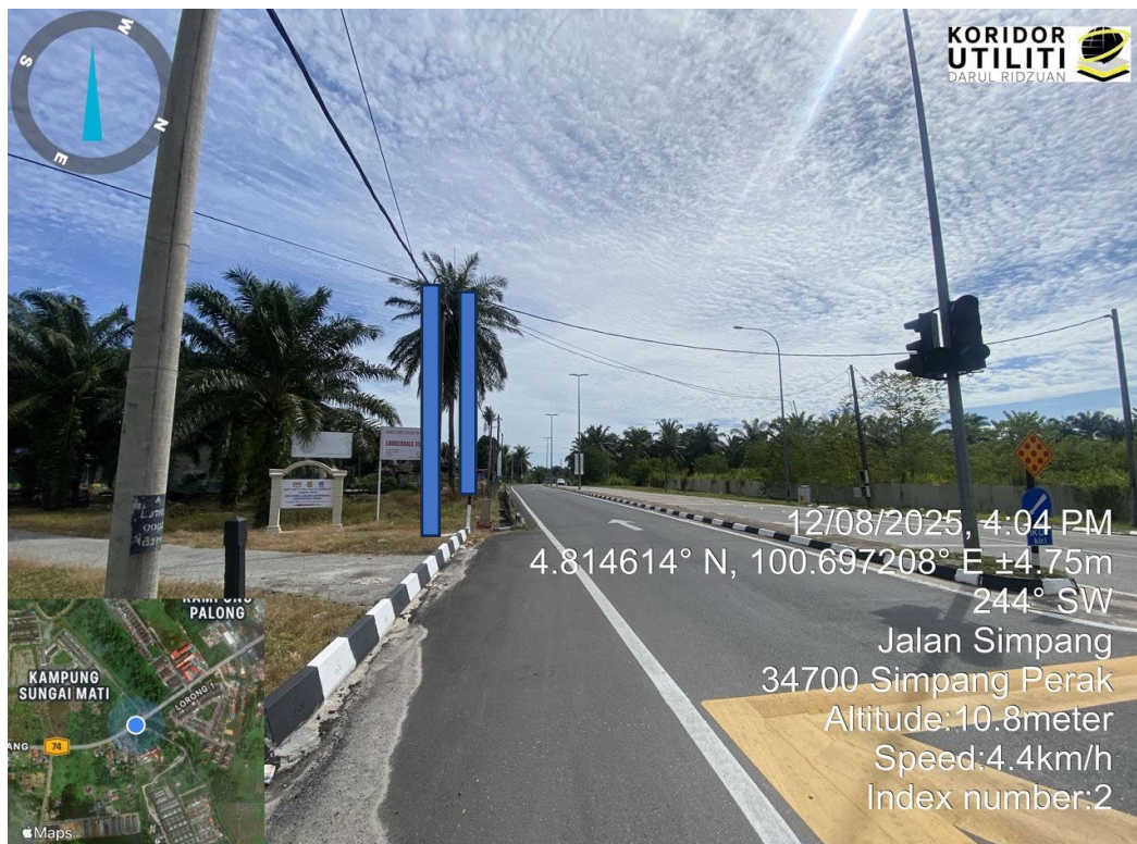
CADANGAN LALUAN PENANAMAN TIANG