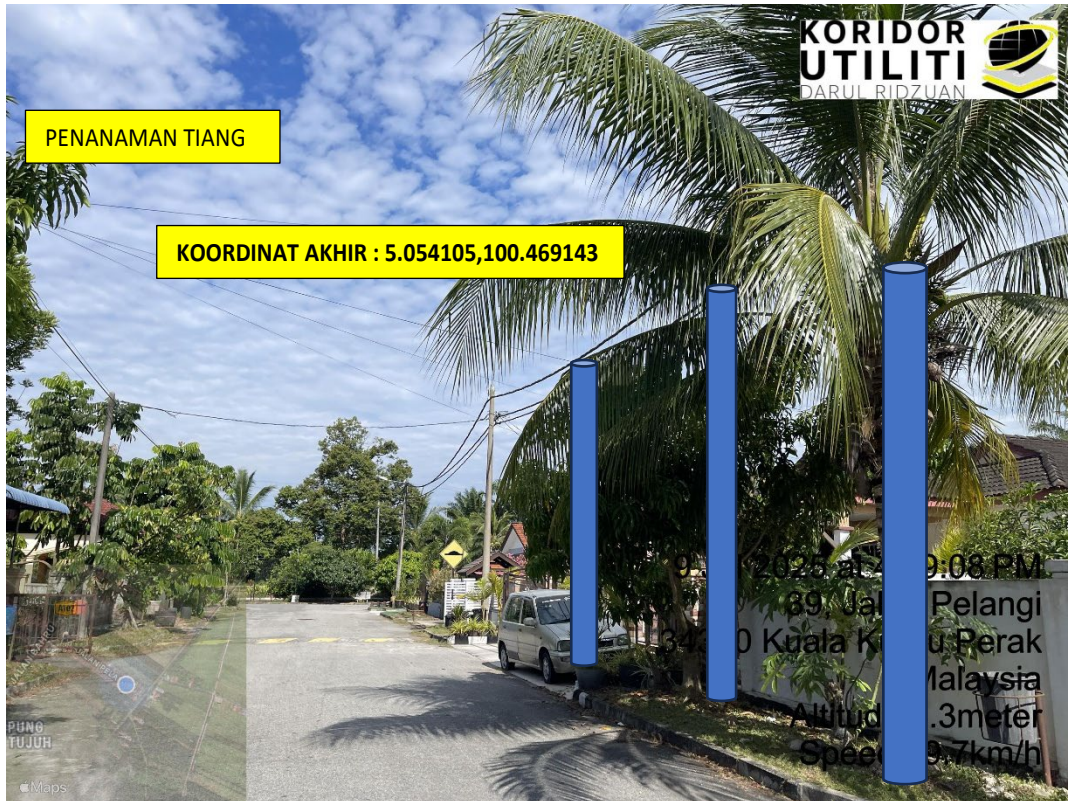
LOKASI DI JALAN TAMAN PELANGI