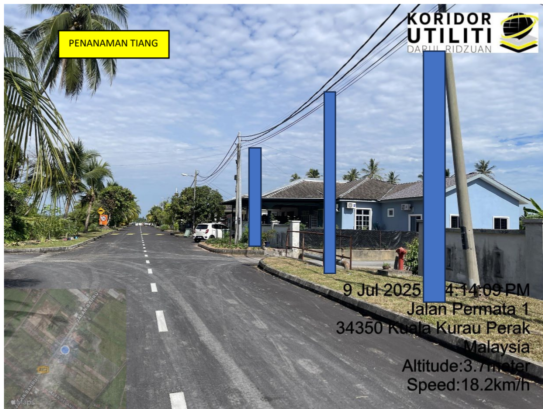
LOKASI DI JALAN TAMAN PERMATA