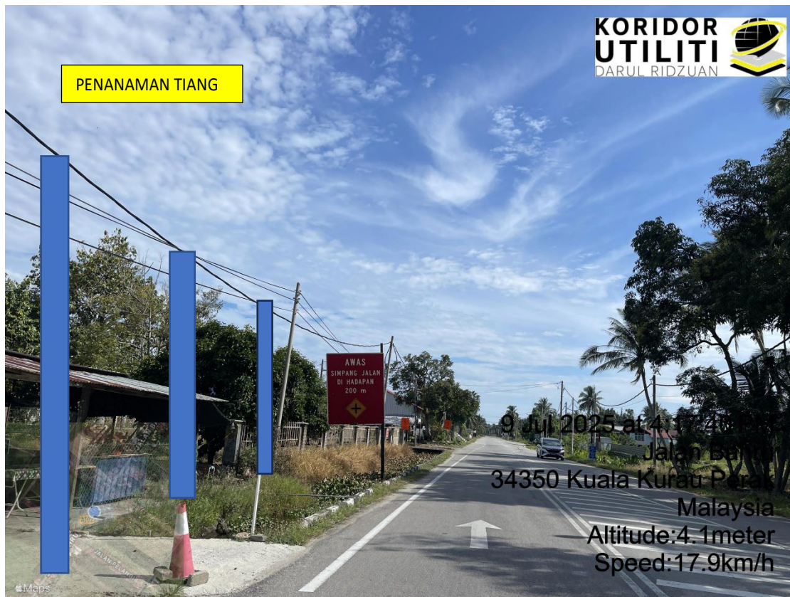
LOKASI DI JALAN PANTAI