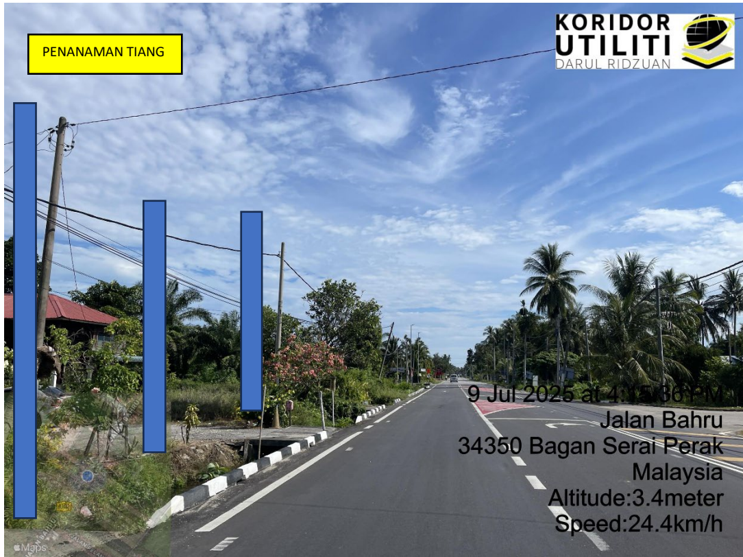
LOKASI DI JALAN PANTAI