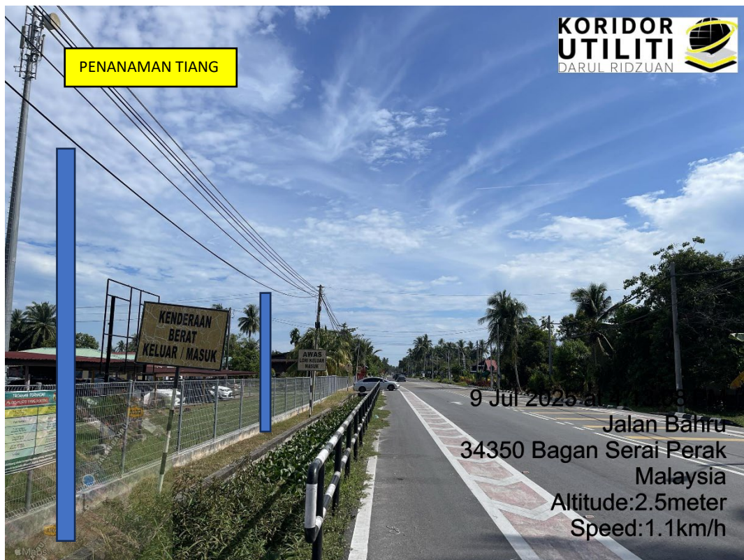
LOKASI DI JALAN PANTAI

9 Jul 2025 at 4:12:51 PM Jalan Bahru 34350 Bagan Serai Perak Malaysia Altitude:2.5meter Speed:1.1km/h