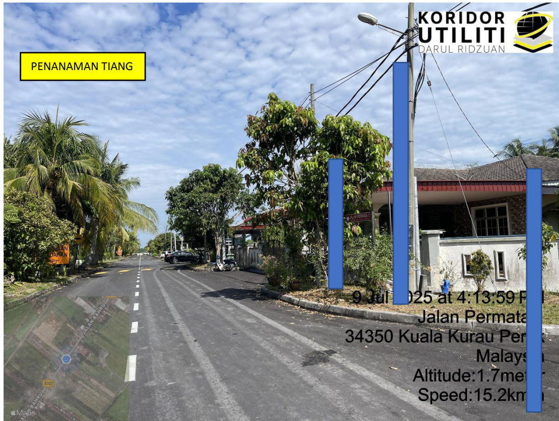
LOKASI DI JALAN TAMAN PERMATA