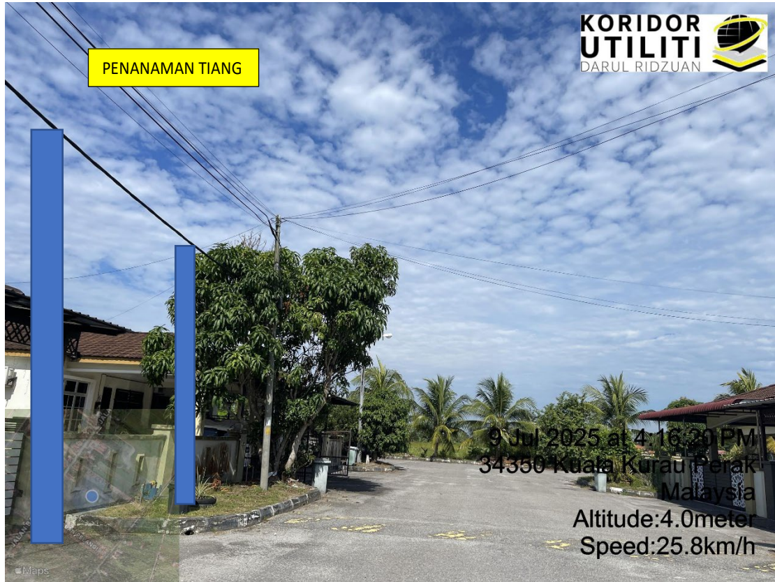
LOKASI DI JALAN PERMATA CAHAYA