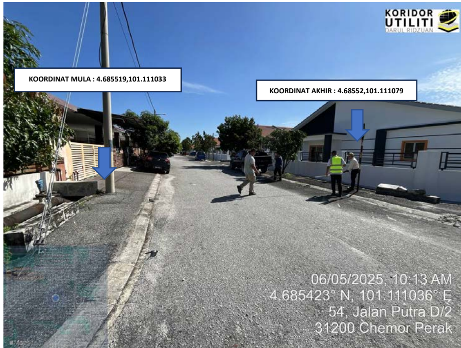
LOKASI KOORDINAT MULA DAN AKHIR KOREKAN TERBUKA DI JALAN PUTRA D/2