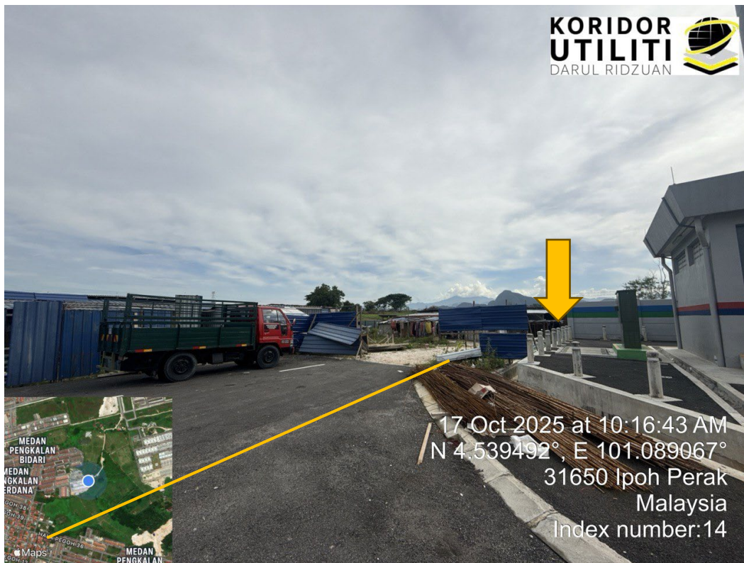
KOORDINAT MULA DARI P/E PENGKALAN INDAH