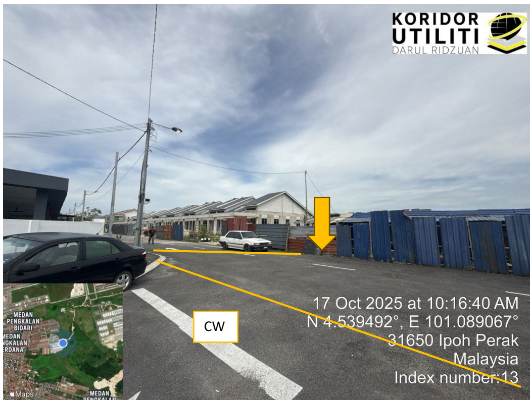
KOREKAN TERBUKA DI JALAN BERTURAP