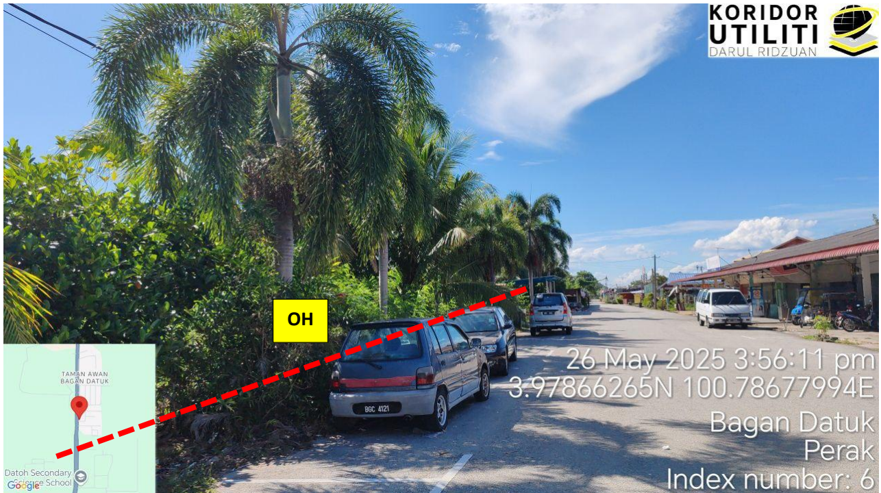
CADANGAN LALUAN PENANAMAN TIANG