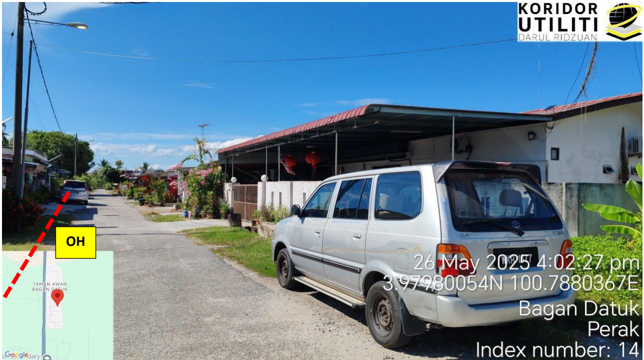
JALAN RPA BAGAN DATOH