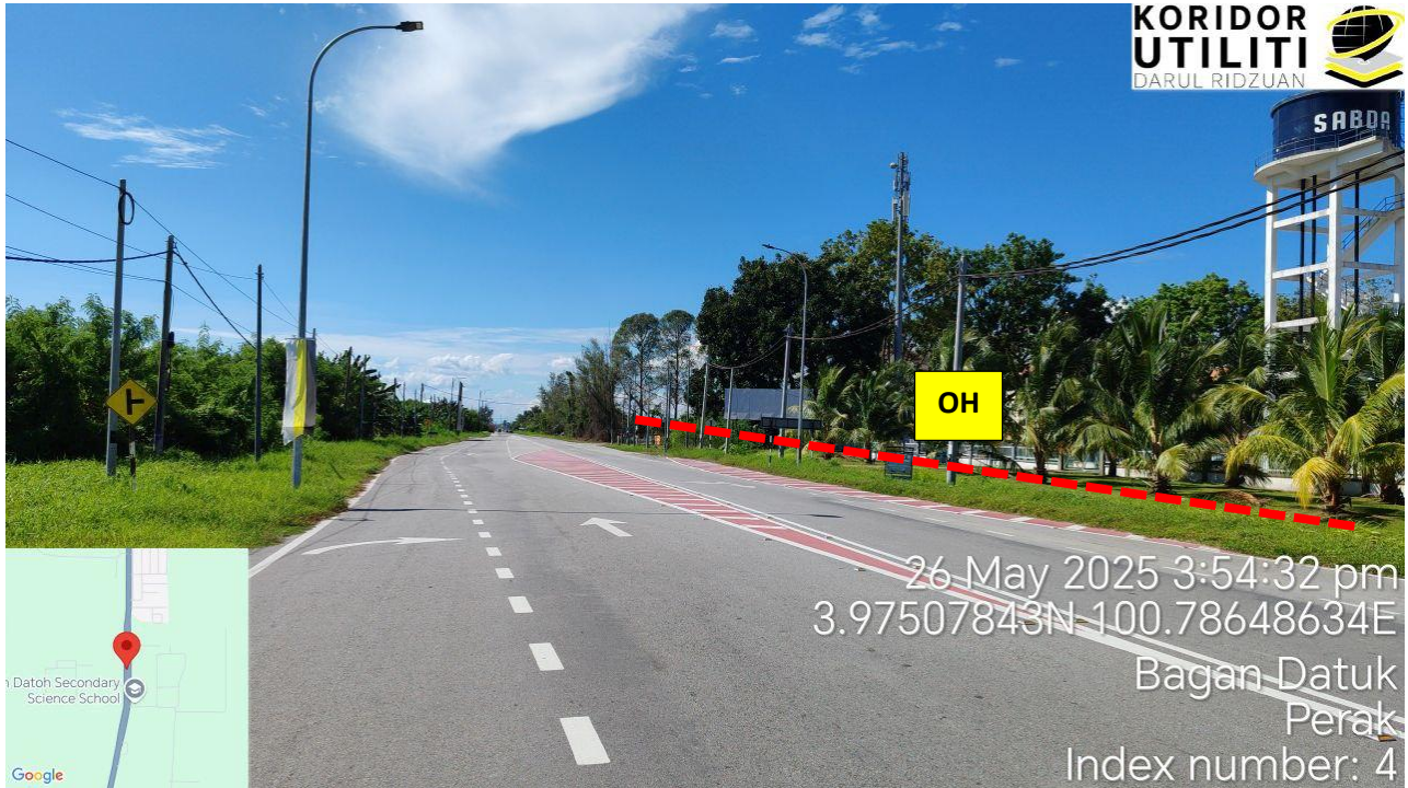
CADANGAN LALUAN PENANAMAN TIANG