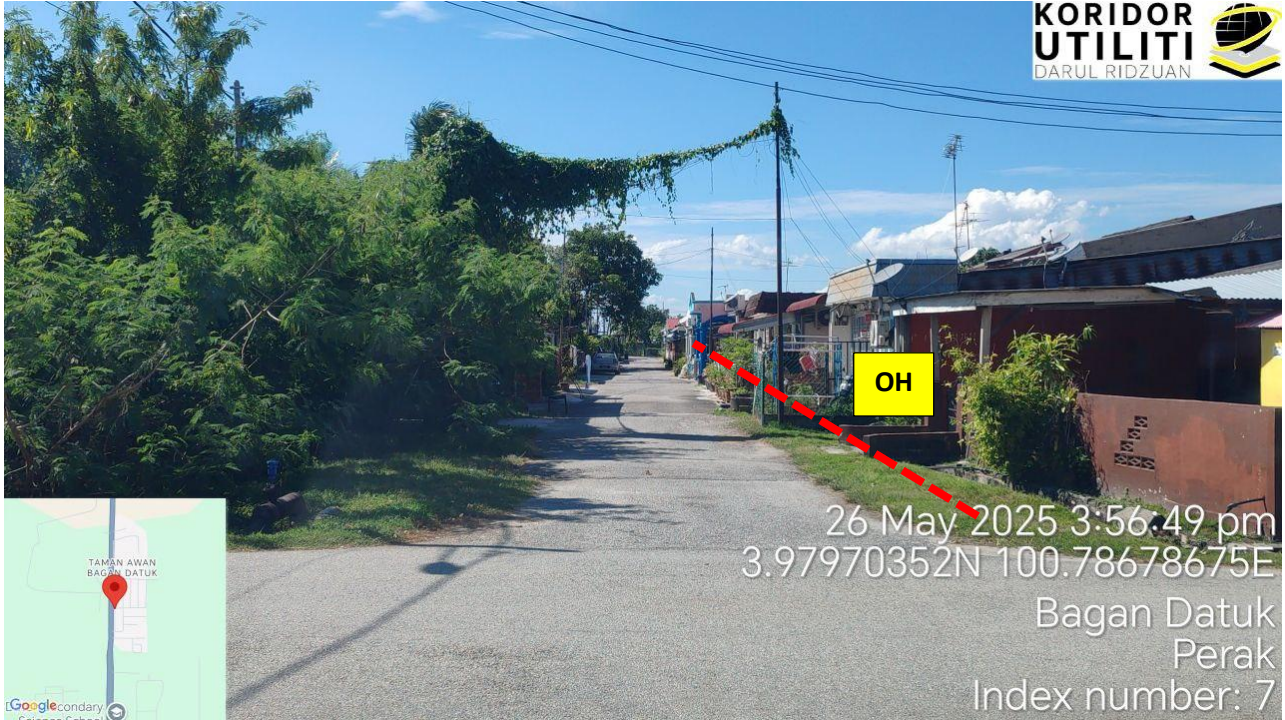
CADANGAN LALUAN PENANAMAN TIANG