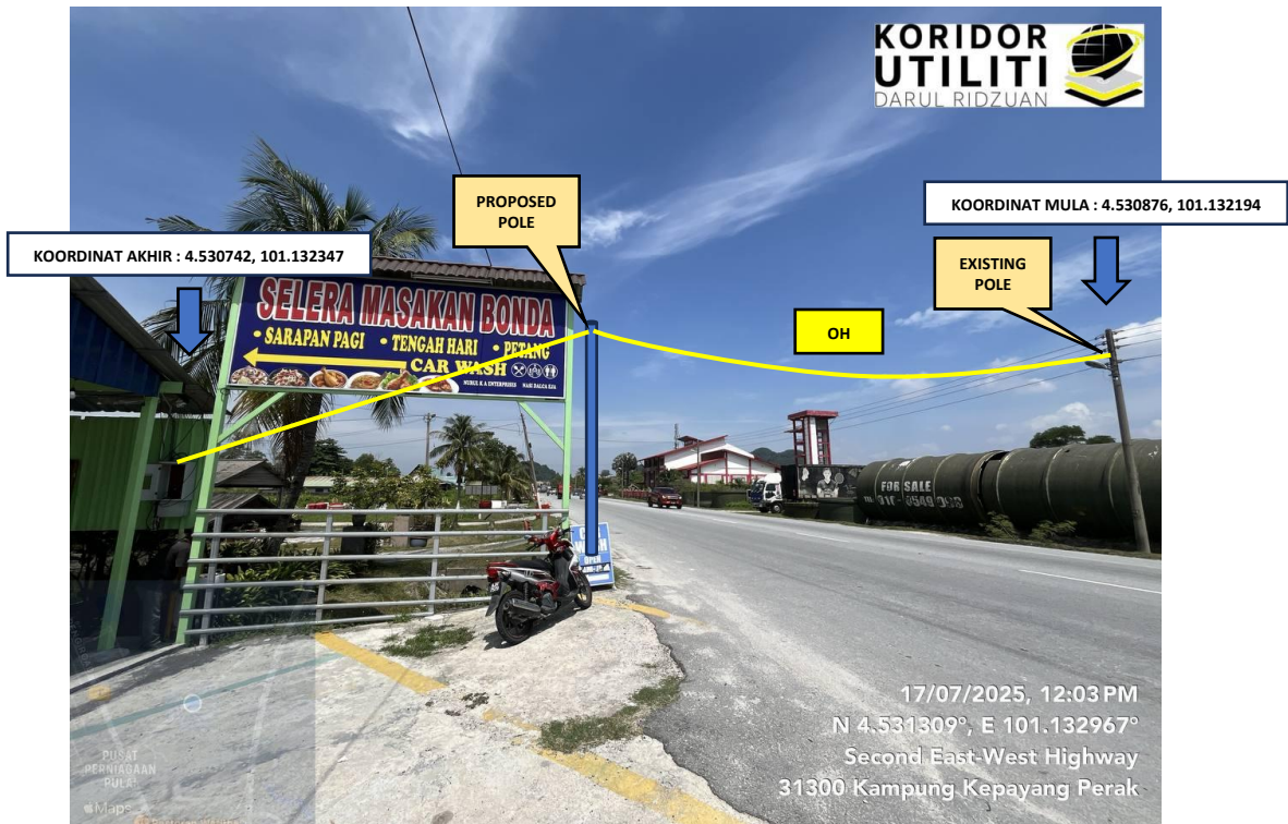
LOKASI PENANAMAN TIANG DAN PENARIKAN KABEL DI JALAN SIMPANG PULAI – BLUE VALLEY (FT.185) Sambungan akan dibuat kepada kotak meter di dalam premis pemohon