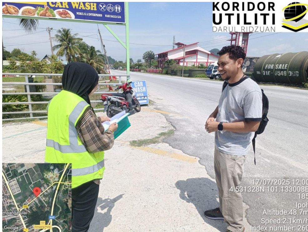
LAWATAN TAPAK AWALAN BERSAMA PEMOHON