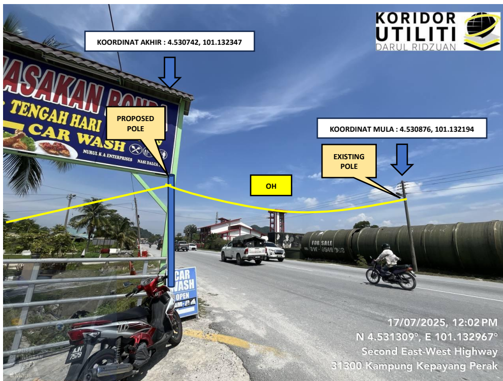
LOKASI PENANAMAN TIANG DAN PENARIKAN KABEL DI JALAN SIMPANG PULAI – BLUE VALLEY (FT.185)