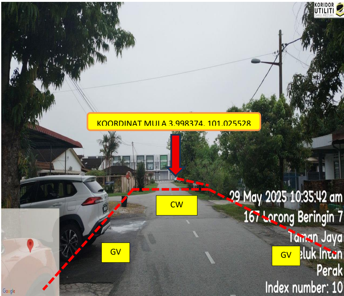
LORONG BERINGIN 7