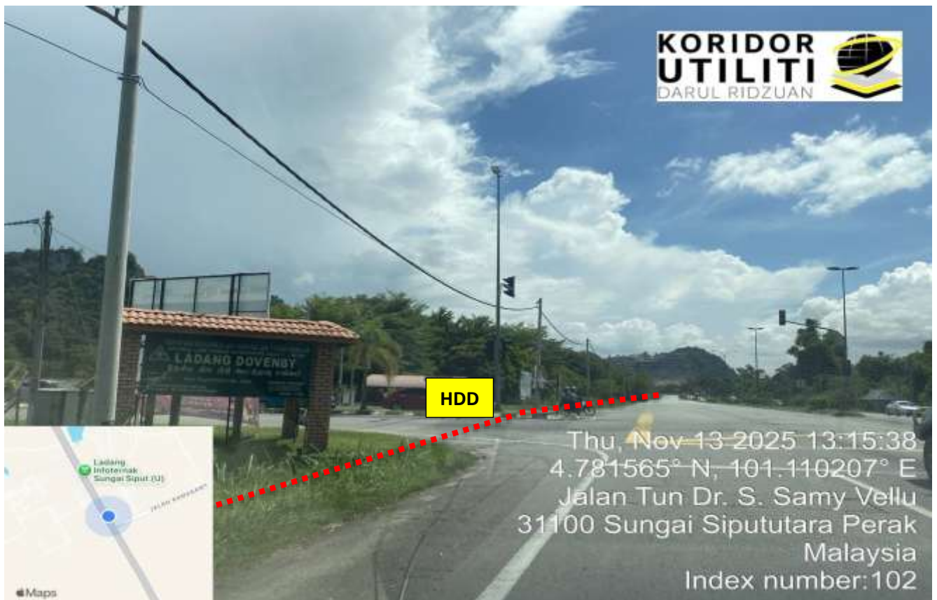
LOKASI DI JALAN IPOH - BUTTERWORTH (FT001)