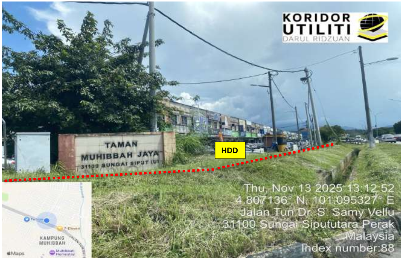
LOKASI DI PERSEMPADANAN JALAN IPOH - BUTTERWORTH (FT001) DAN JALAN INDUSTRI RINGAN