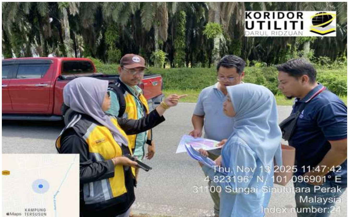
LOKASI DI KOORDINAT MULA LADANG SOLAR, JALAN PINTASAN (A306)