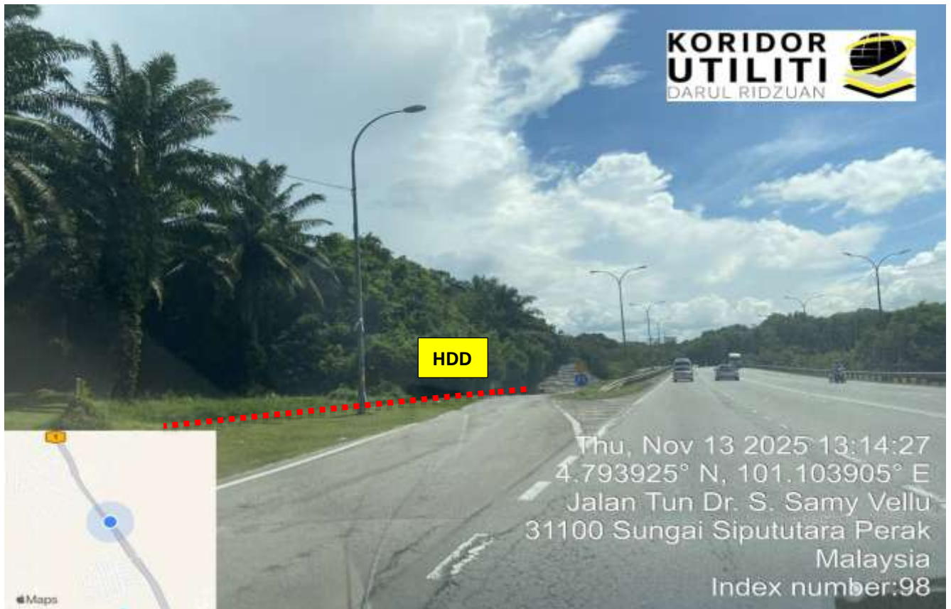
LOKASI DI JALAN IPOH - BUTTERWORTH (FT001)