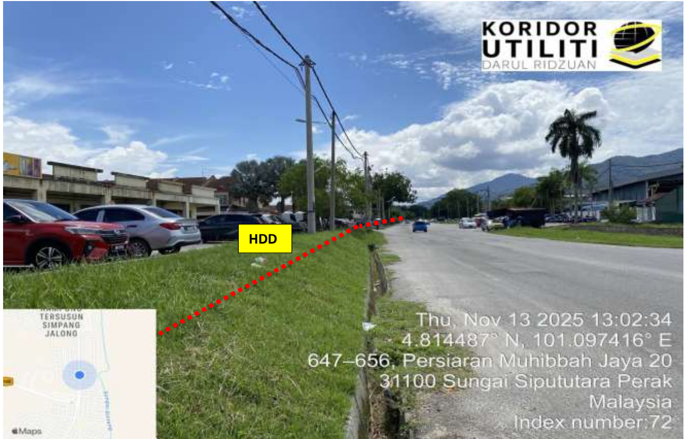
LOKASI DI JALAN INDUSTRI RINGAN