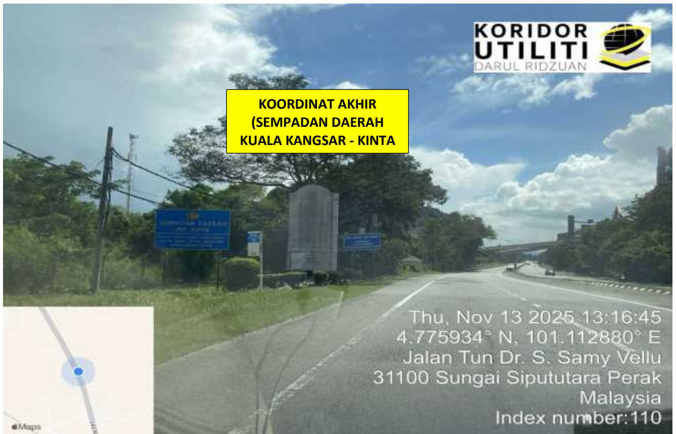
LOKASI DI JALAN IPOH - BUTTERWORTH (FT001)