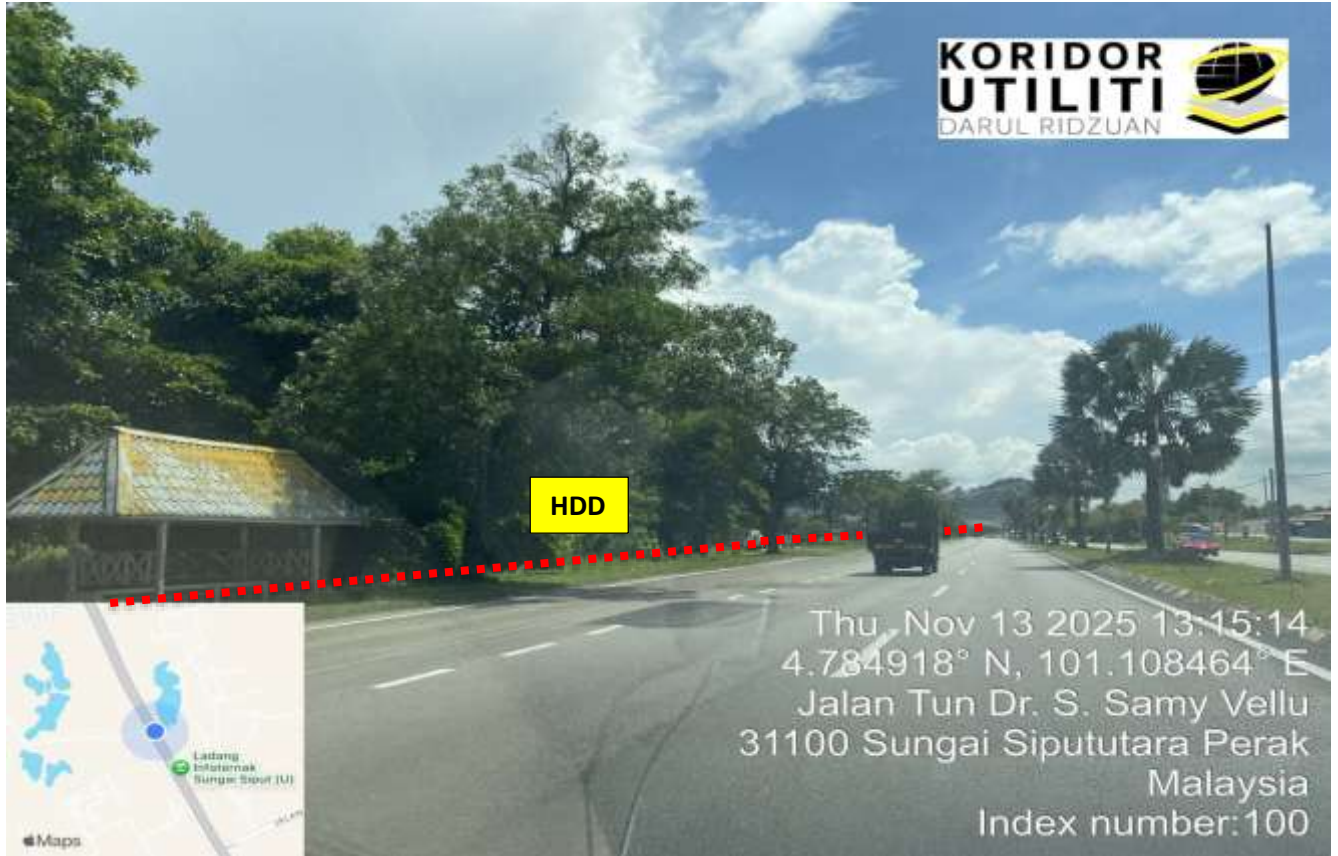
LOKASI DI JALAN IPOH - BUTTERWORTH (FT001)