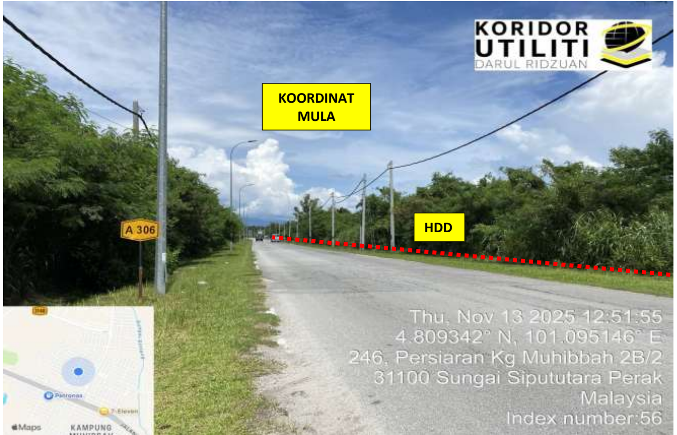
LOKASI DI JALAN PINTASAN (A306)