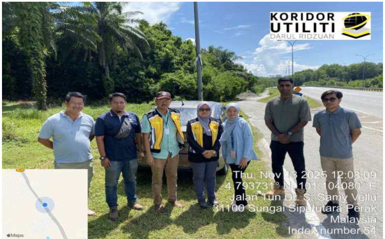
LOKASI DI JALAN IPOH - BUTTERWORTH (FT001)