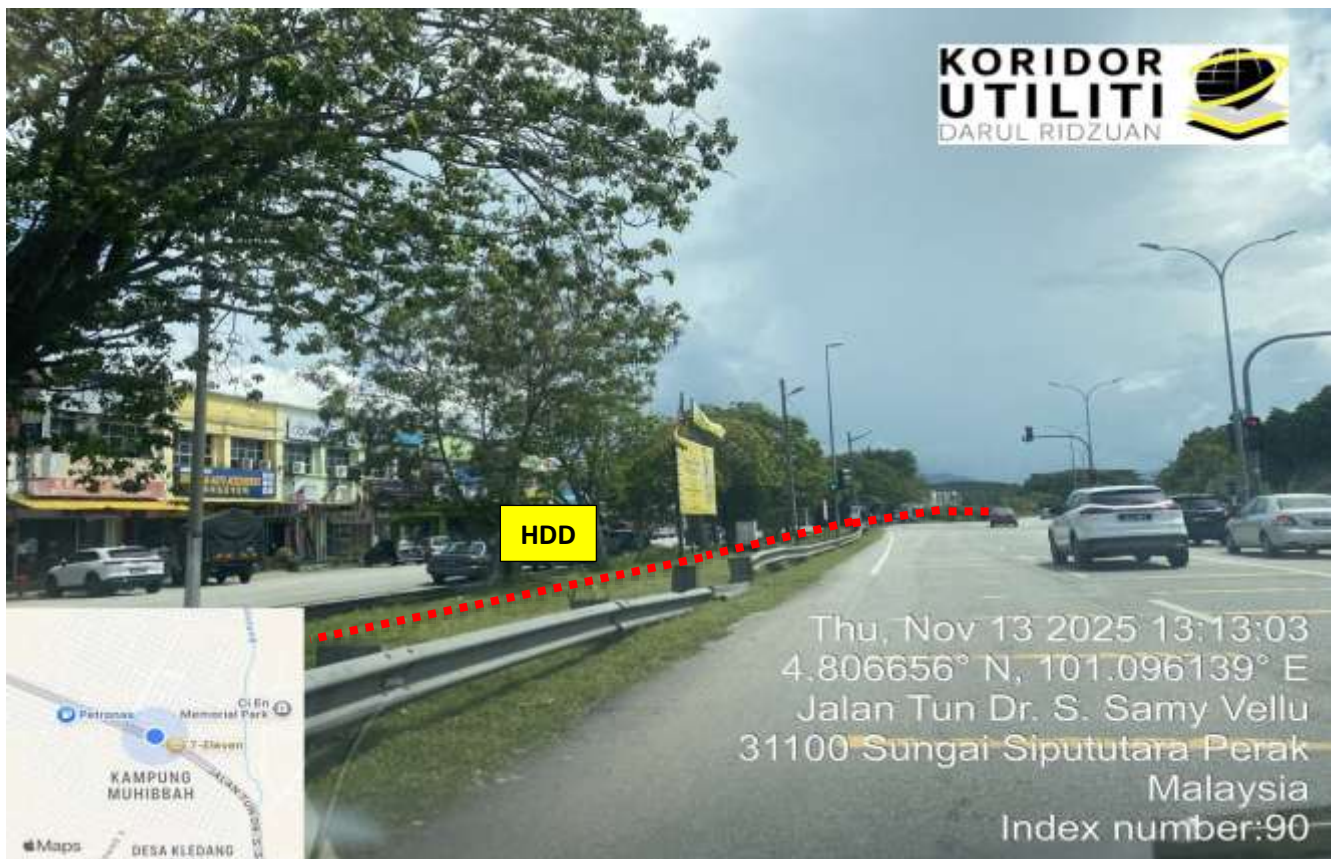
LOKASI DI JALAN IPOH - BUTTERWORTH (FT001)