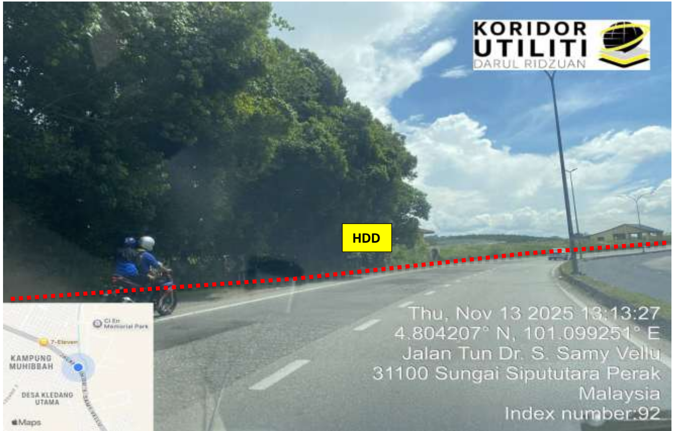
LOKASI DI JALAN IPOH - BUTTERWORTH (FT001)