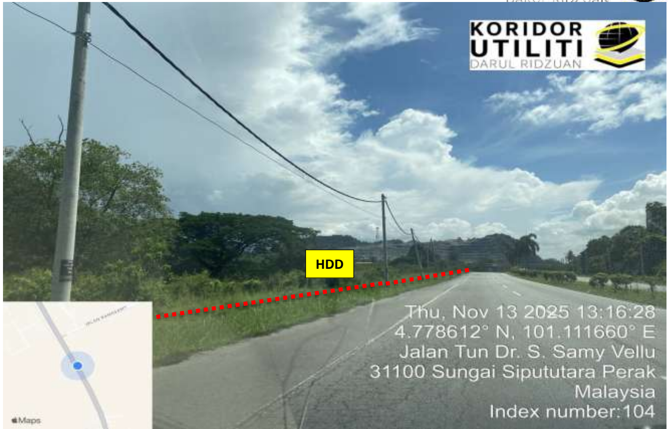
LOKASI DI JALAN IPOH - BUTTERWORTH (FT001)