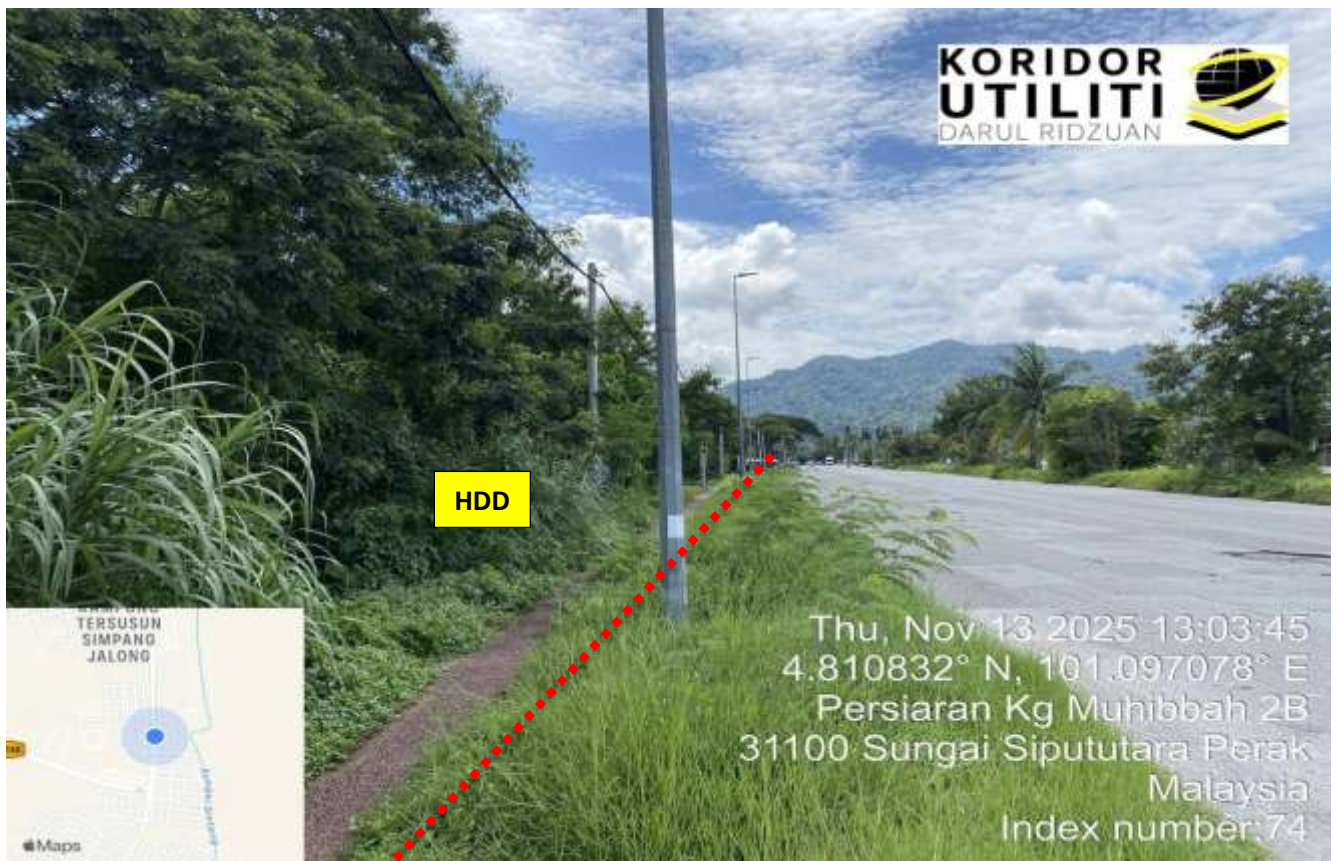
LOKASI DI JALAN INDUSTRI RINGAN