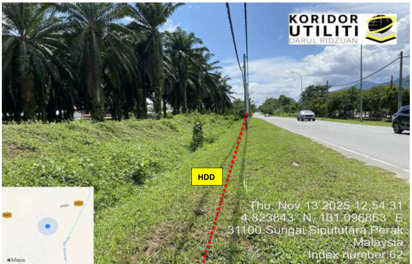
LOKASI DI JALAN PINTASAN (A306)