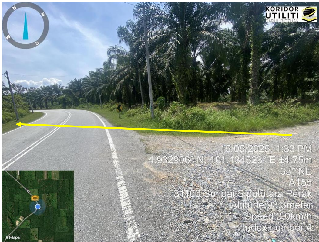
KOORDINAT MULA – CADANGAN HDD DI KAWASAN PRIVATE DAN MELINTASI JALAN JKR