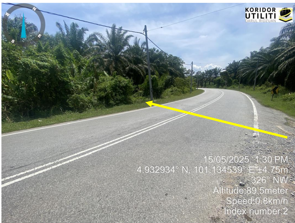
LALUAN HDD DAN CADANGAN PIT