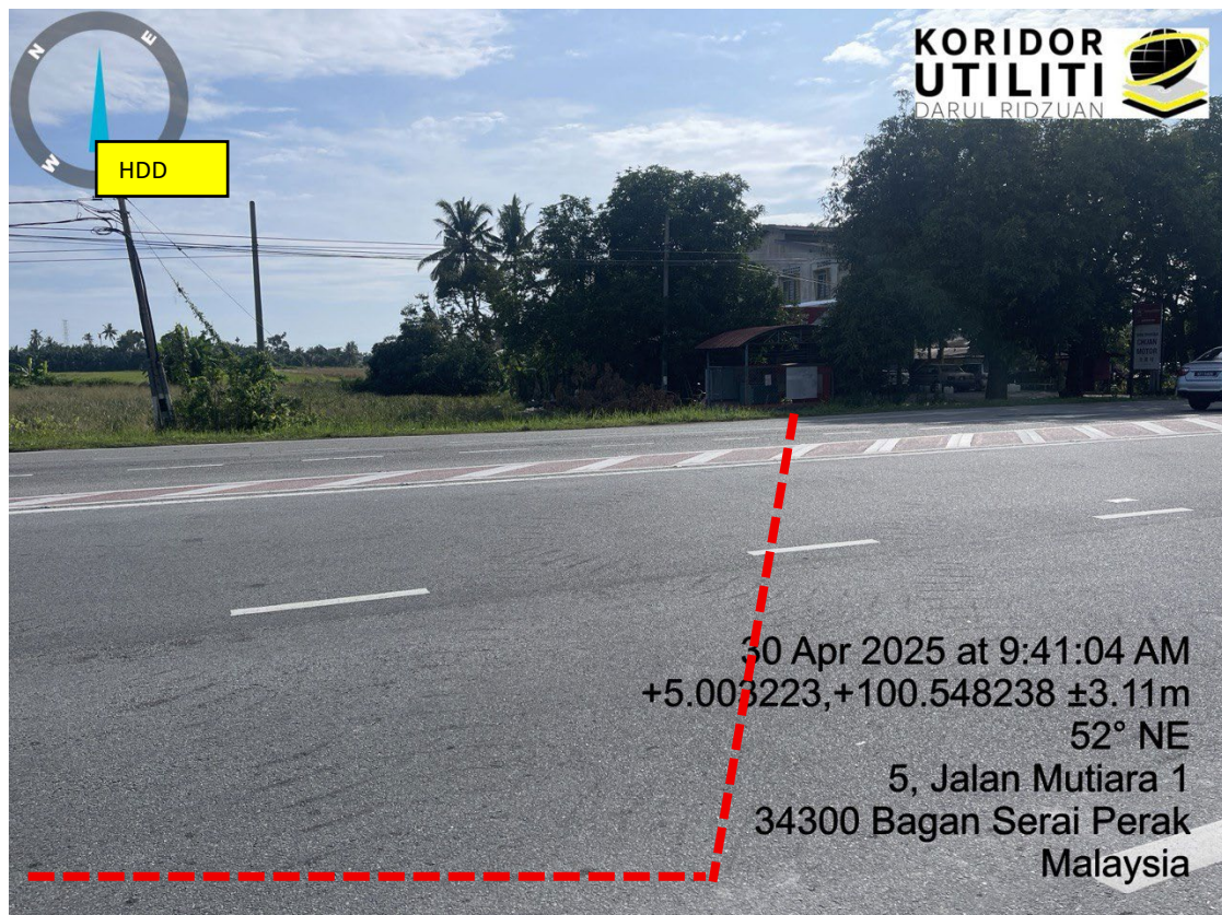
LOKASI DI JALAN TAIPING – BAGAN SERAI