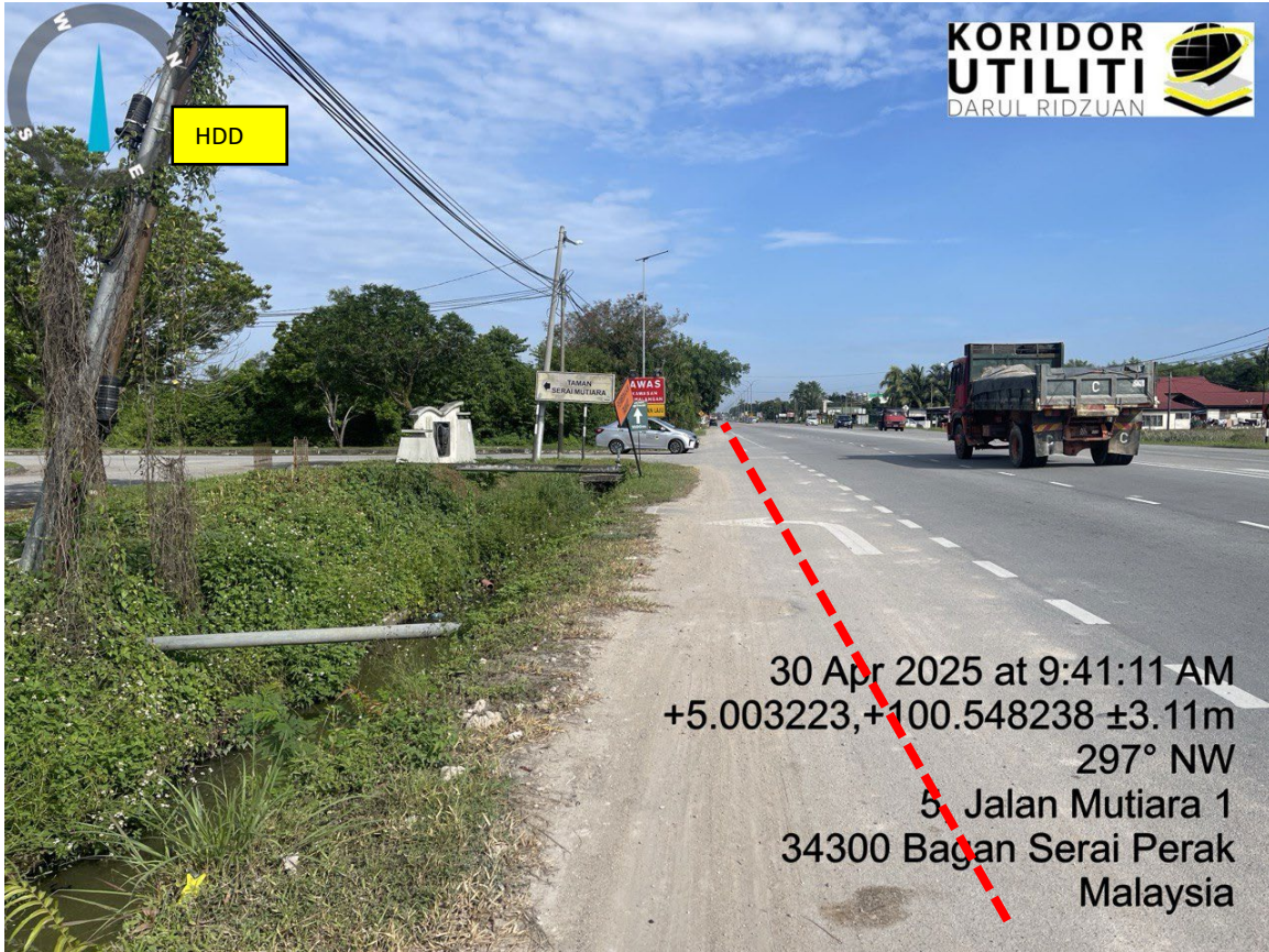
LOKASI DI JALAN TAIPING – BAGAN SERAI