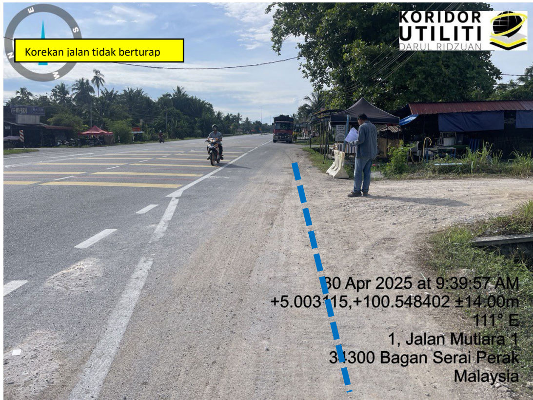
LOKASI DI JALAN TAIPING – BAGAN SERAI