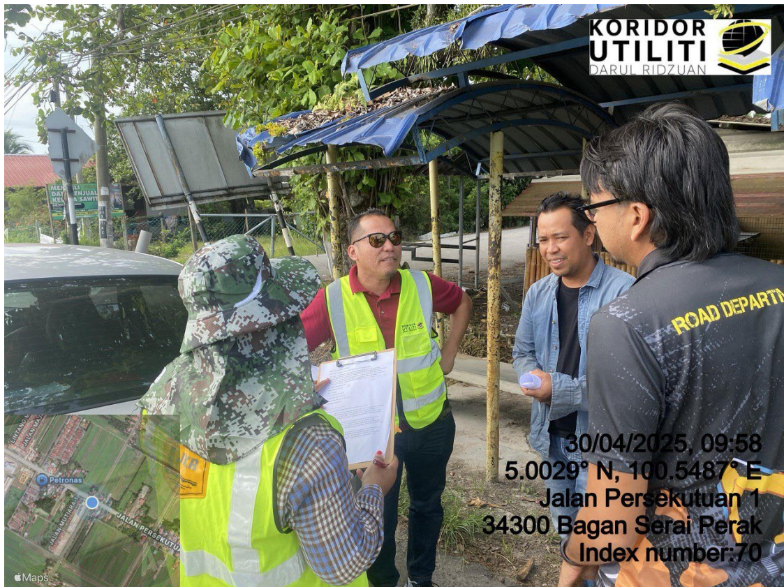
LOKASI DI JALAN TAIPING – BAGAN SERAI