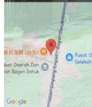
LORONG BELAKANG KEDAI SIMPANG TIGA