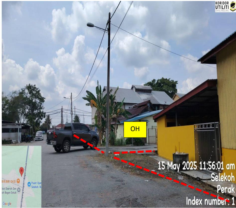
JALAN SJKC SIMPANG TIGA