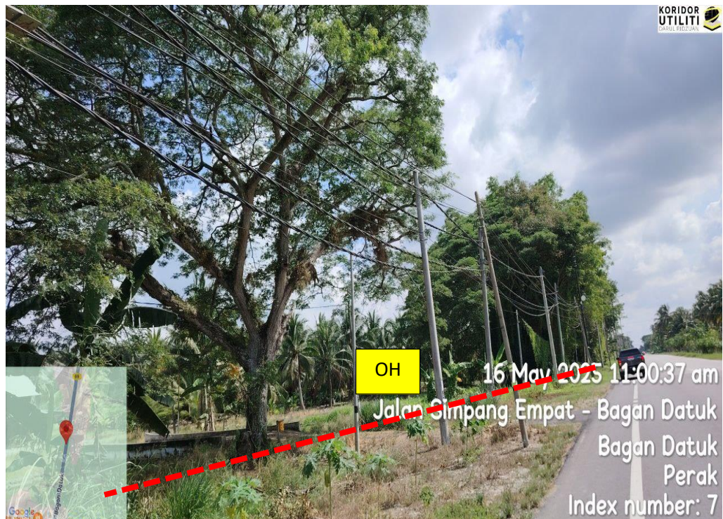
JALAN SIMPANG EMPAT – BAGAN DATUK