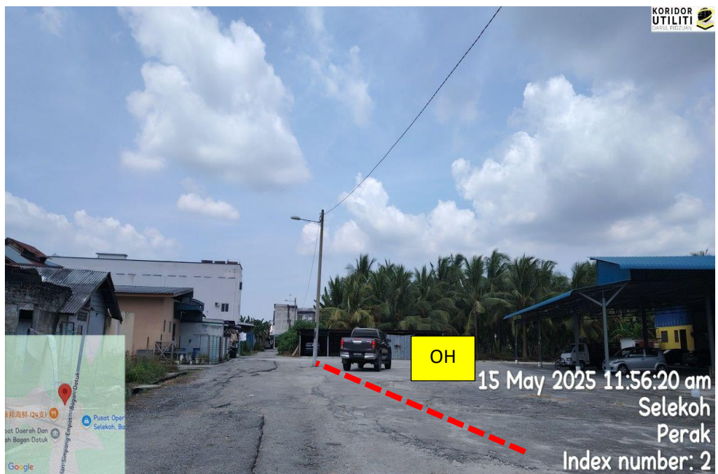
LORONG BELAKANG KEDAI SIMPANG TIGA