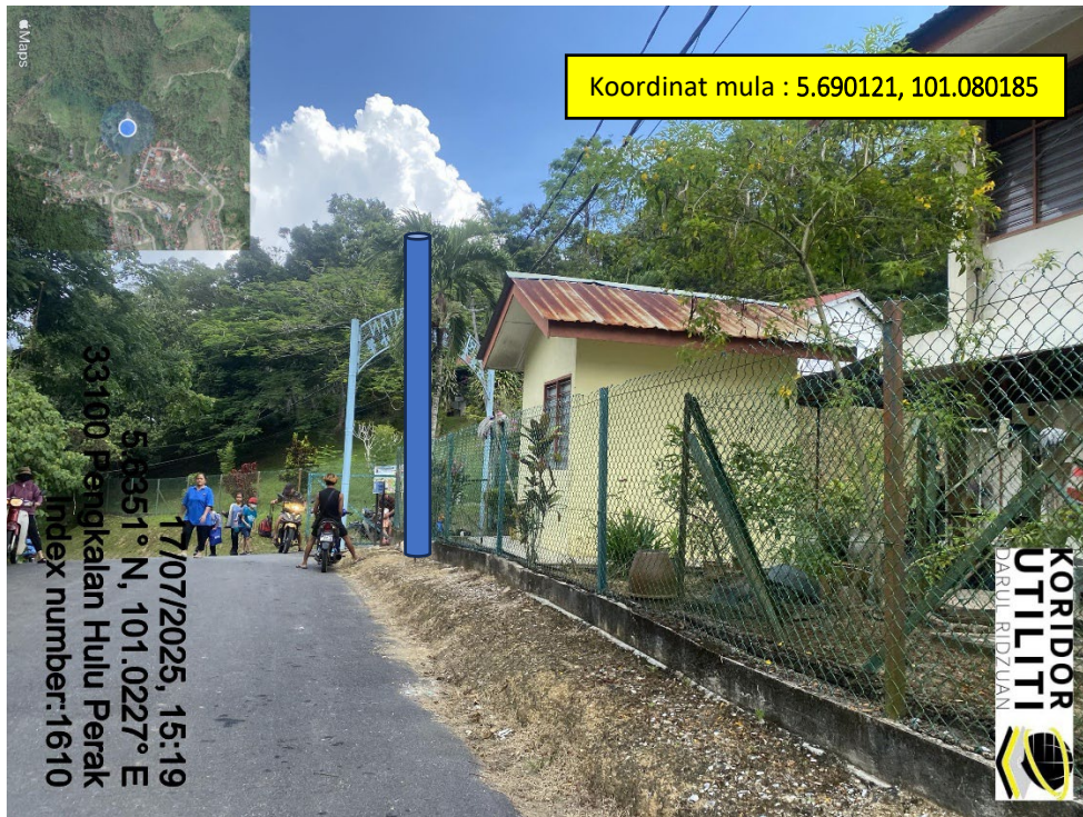
LOKASI DI JALAN SJKC KUNG LI