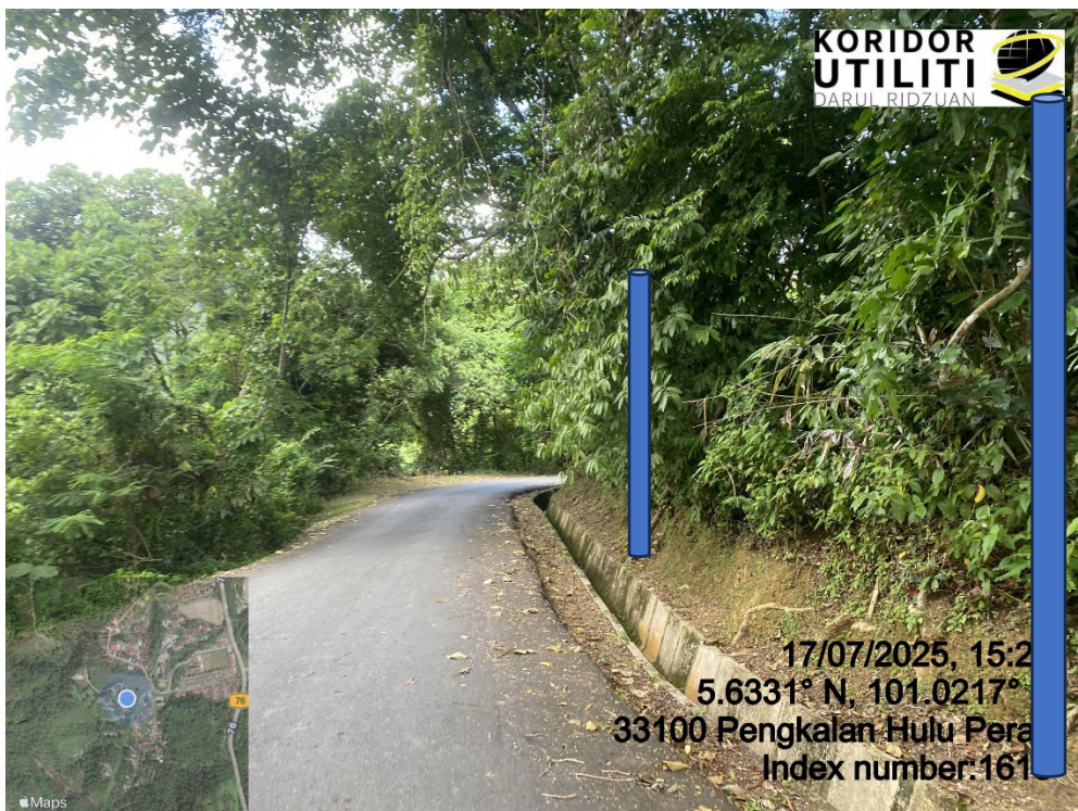
LOKASI DI JALAN KLIAN INTAN