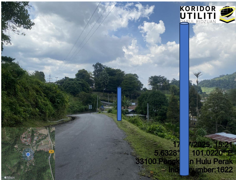
LOKASI DI JALAN KLIAN INTAN