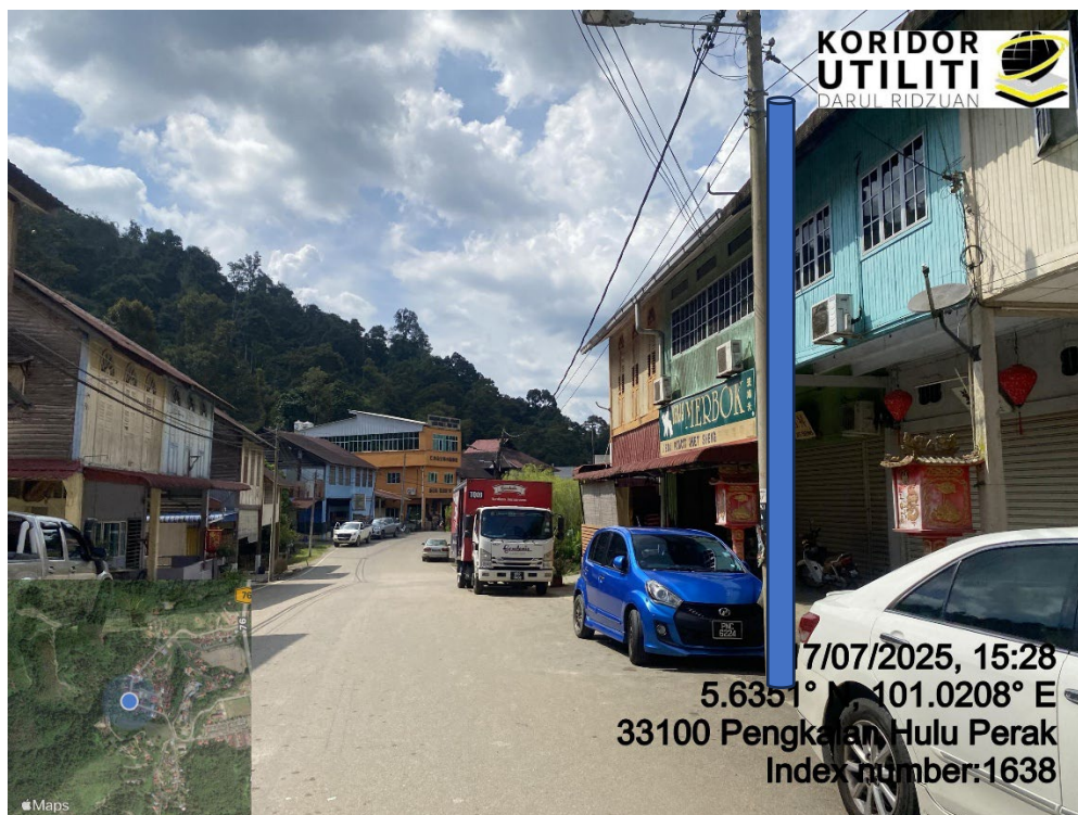
LOKASI DI JALAN KLIAN INTAN