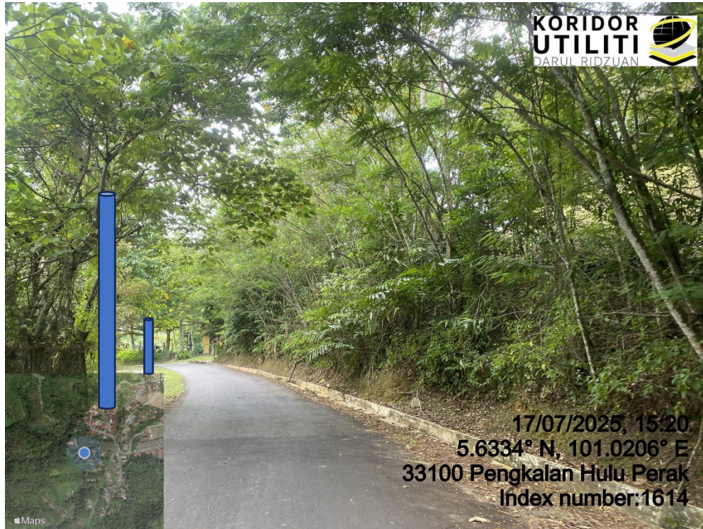
LOKASI DI JALAN KLIAN INTAN