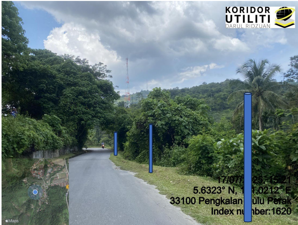
LOKASI DI JALAN KLIAN INTAN