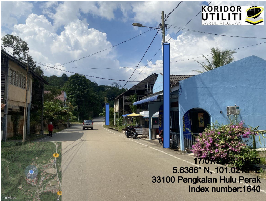
LOKASI DI JALAN KLIAN INTAN