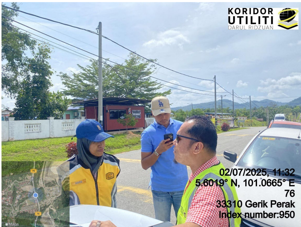
LOKASI DI JALAN SJKC KUNG LI