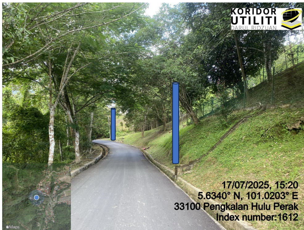
LOKASI DI JALAN KLIAN INTAN