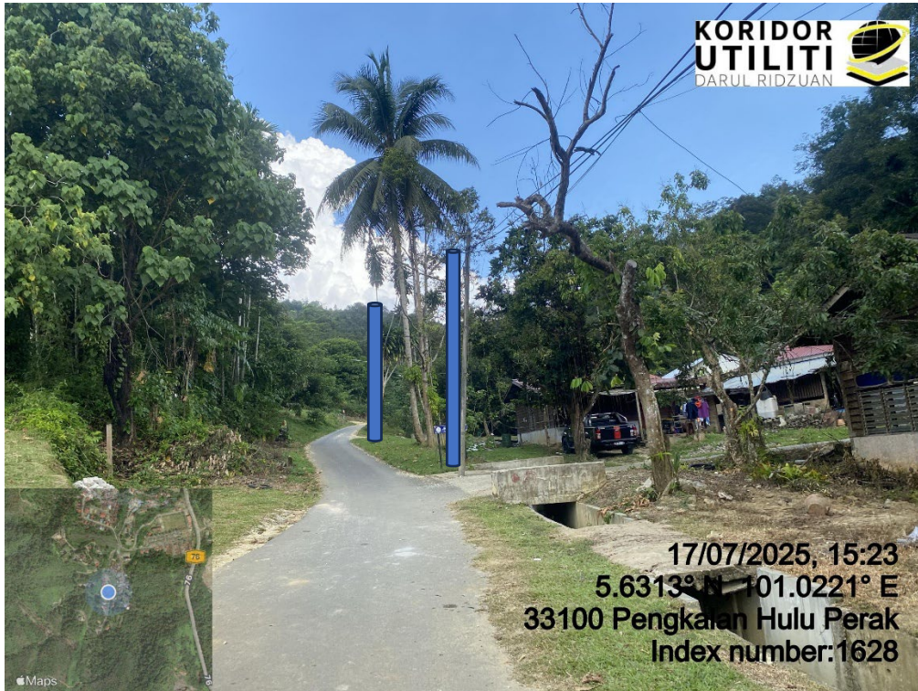
LOKASI DI JALAN KLIAN INTAN