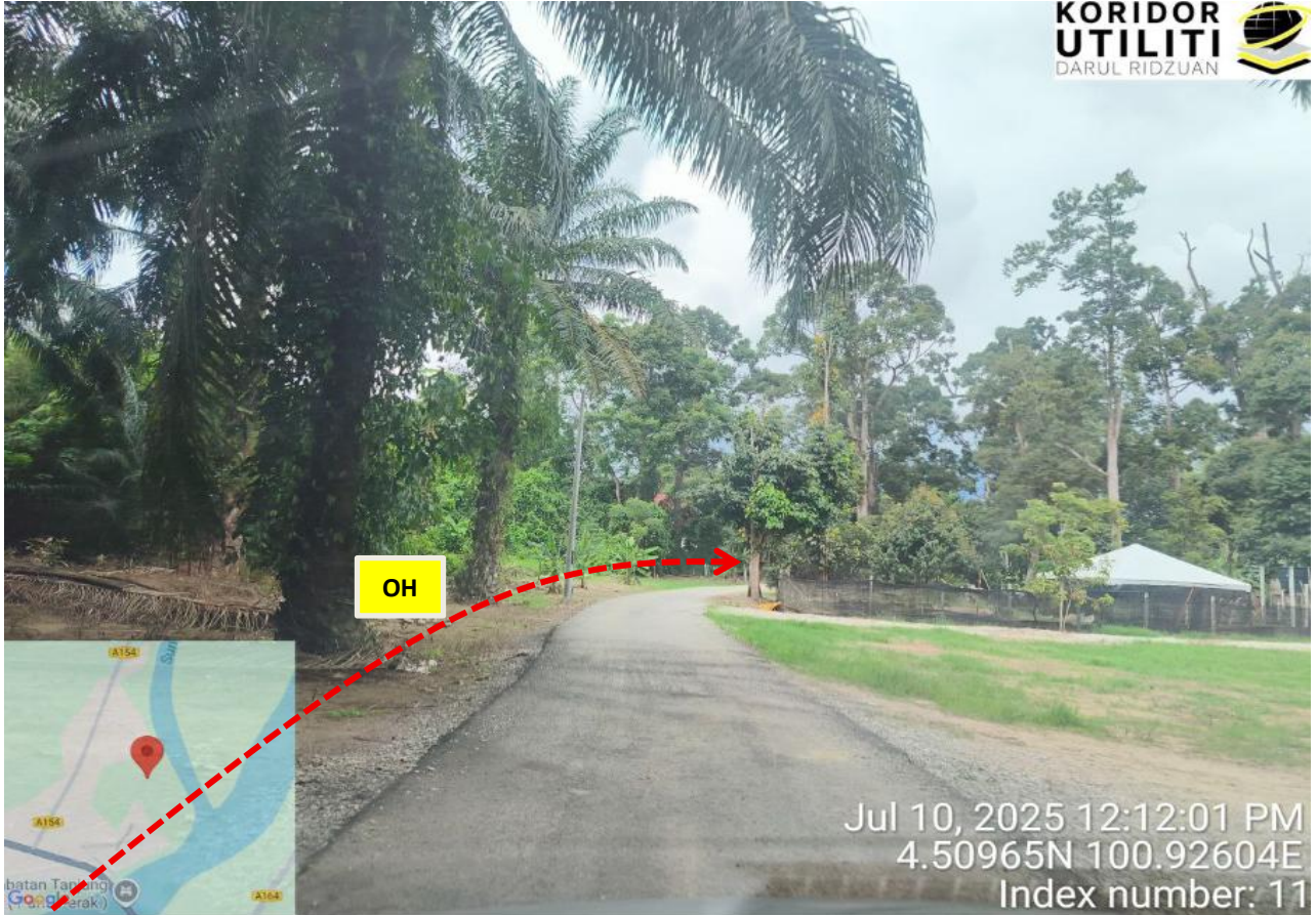
JALAN HJH. HALIJAH