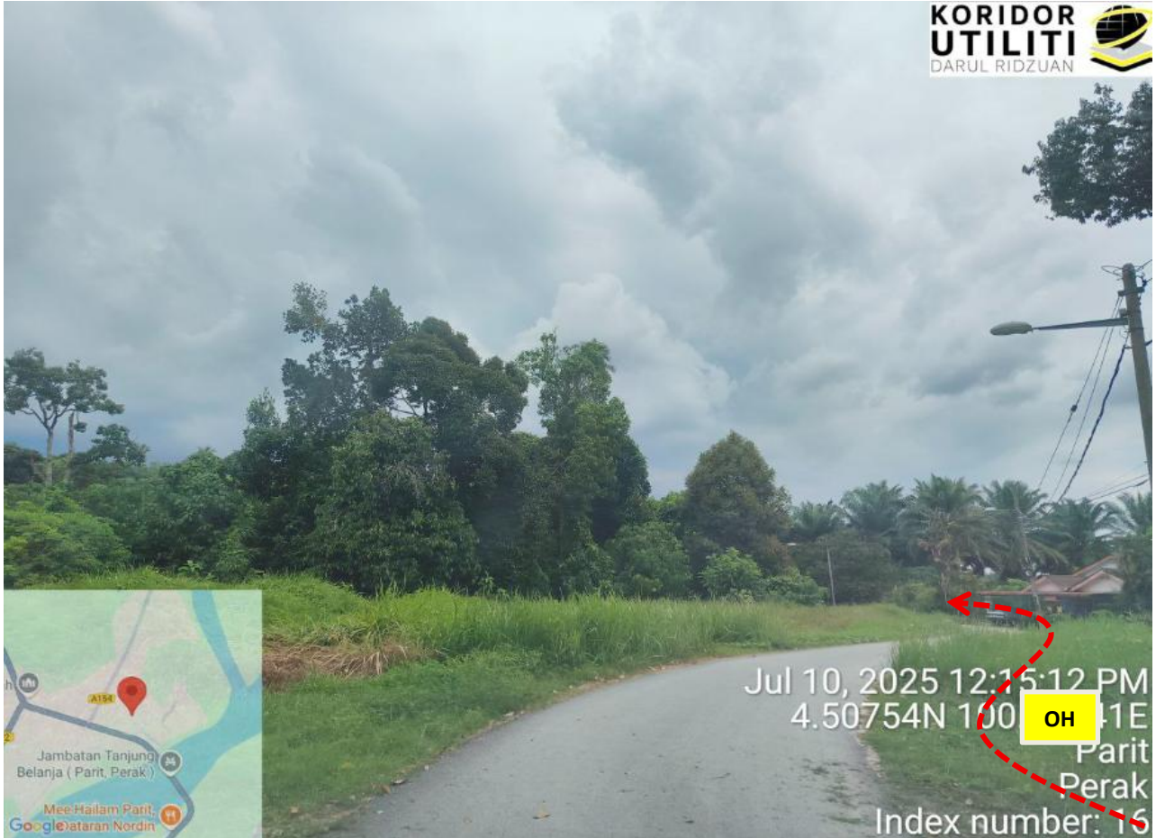
JALAN HJH. HALIJAH