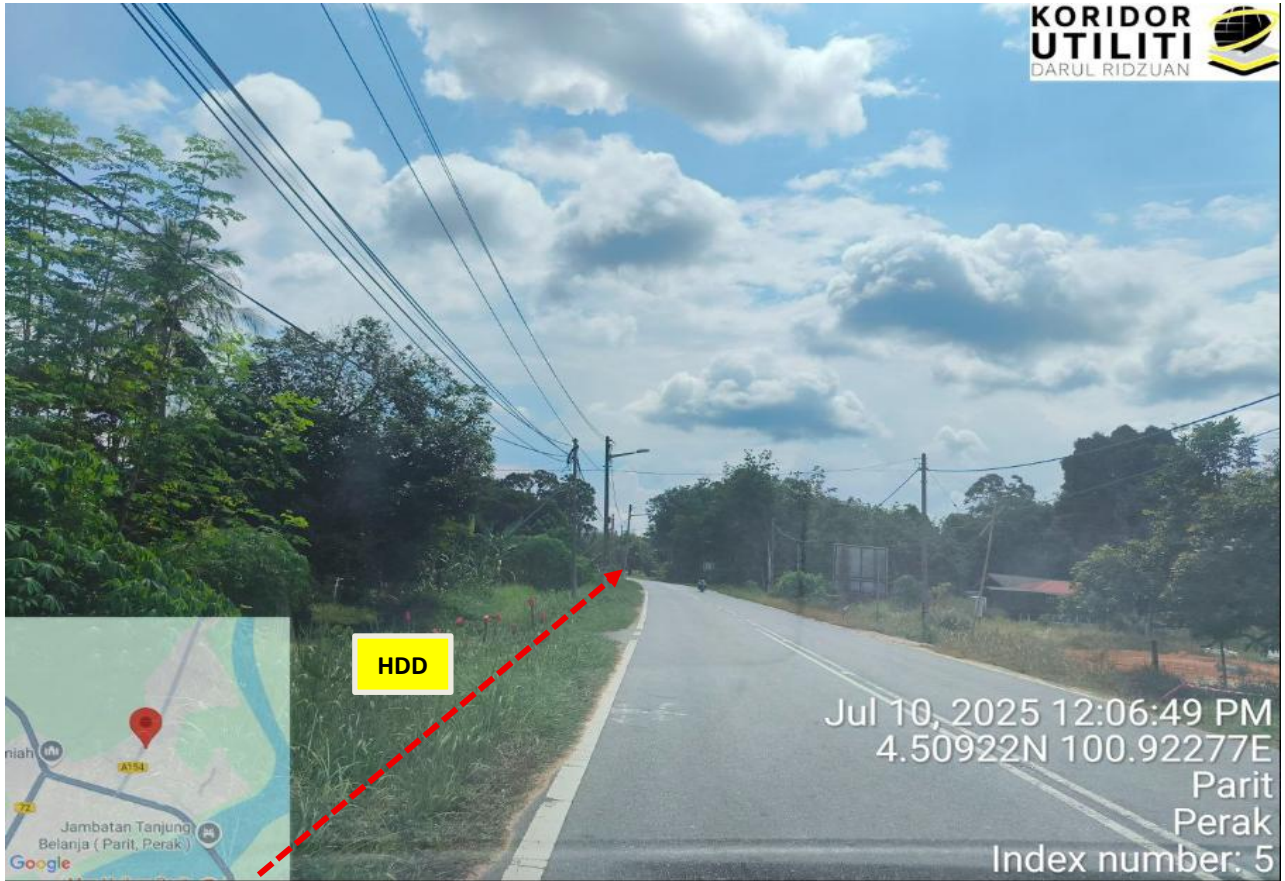
JALAN MANONG – TANJONG BELANJA (A154)