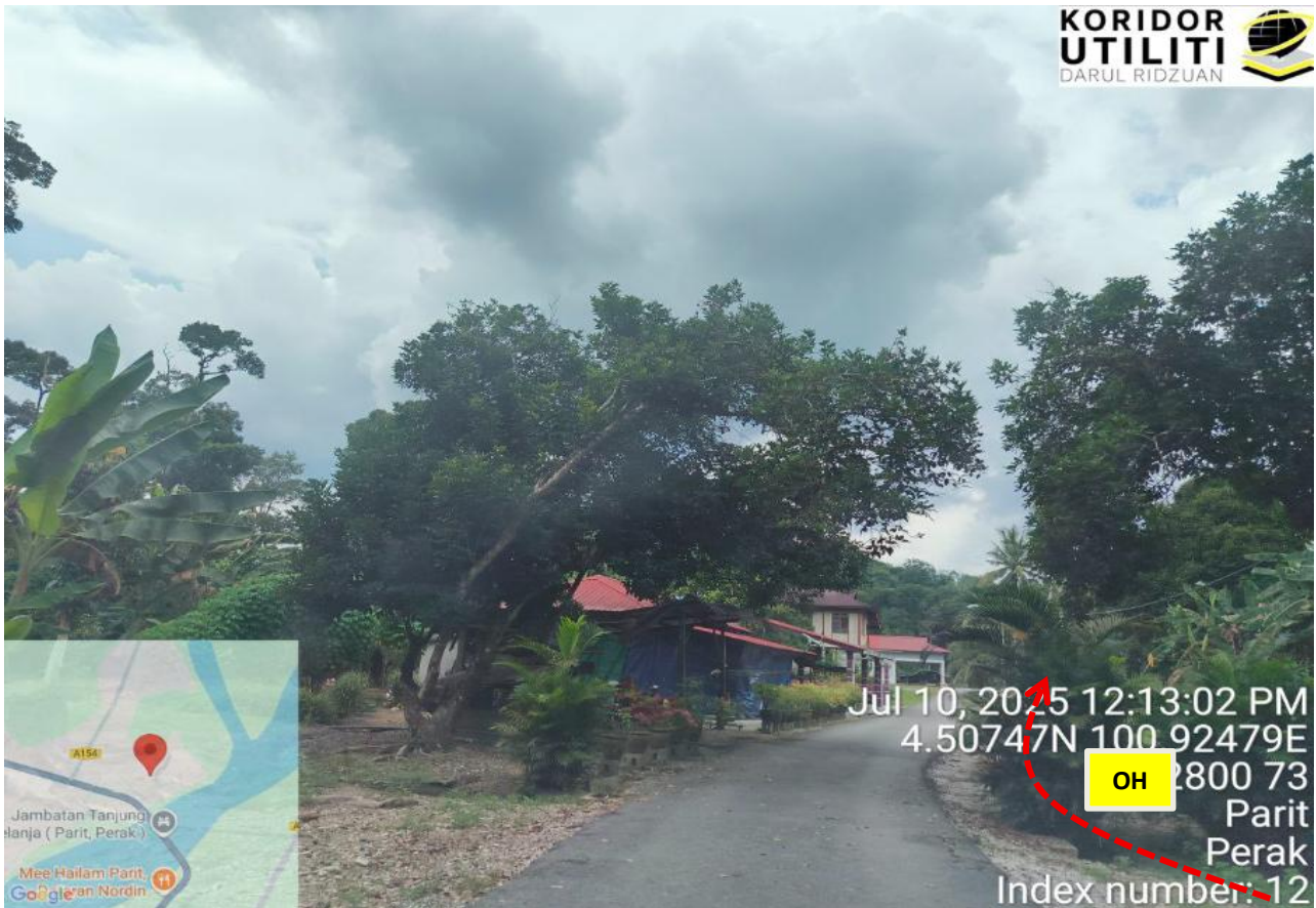
JALAN HJH. HALIJAH