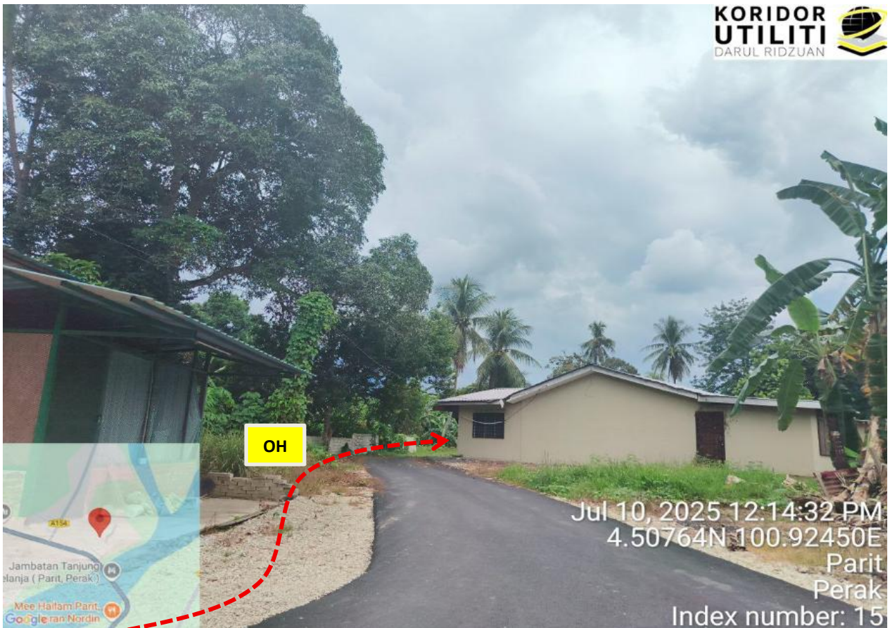
JALAN HJH. HALIJAH