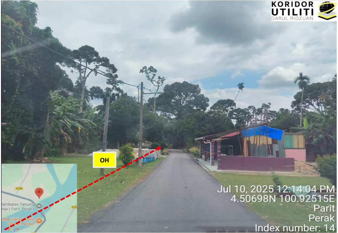
JALAN HJH. HALIJAH