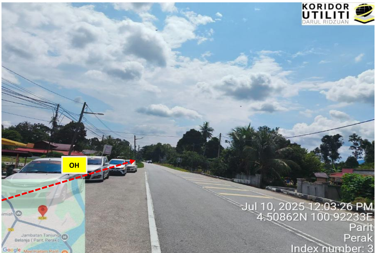
JALAN MANONG – TANJONG BELANJA (A154)