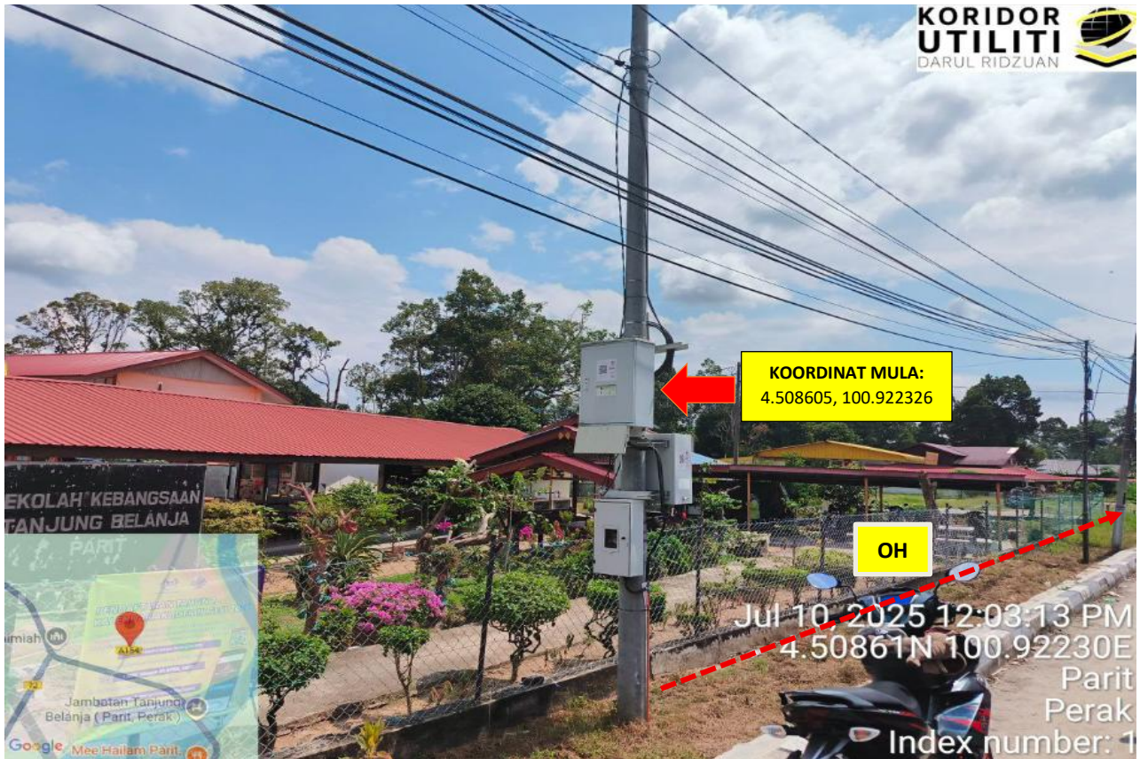
JALAN MANONG – TANJONG BELANJA (A154)