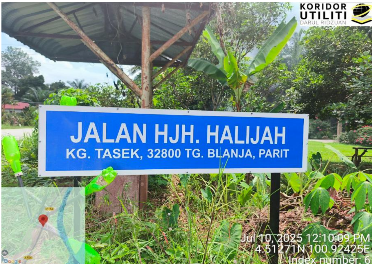
JALAN HJH. HALIJAH