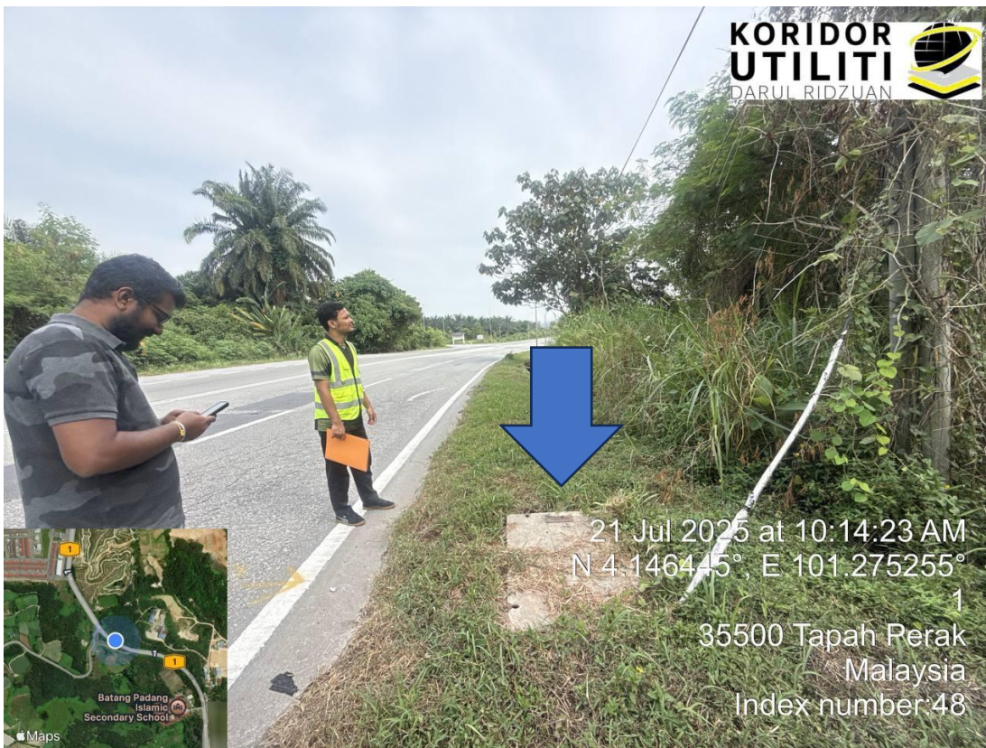
KOORDINAT AKHIR – MANHOLE SEDIA ADA DIGI