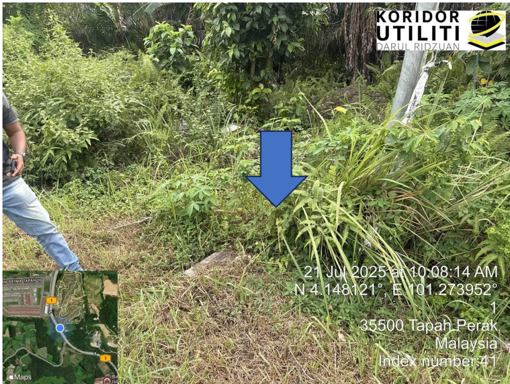
KOORDINAT MULA – MANHOLE SEDIA ADA DIGI