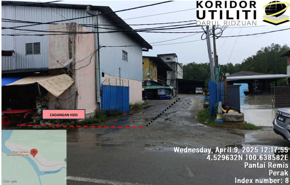
LOKASI KERJA: JALAN BAGAN PANCHOR