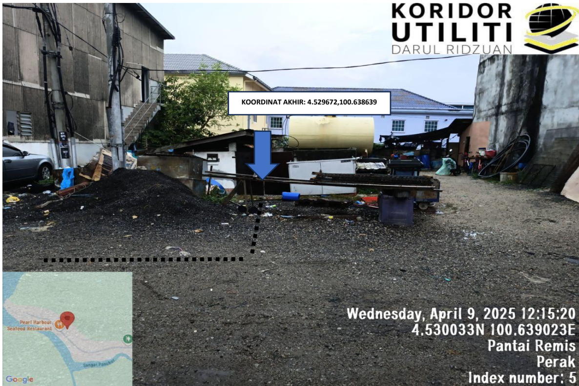
LOKASI KERJA: JALAN BAGAN PANCHOR (KOORDINAT AKHIR)