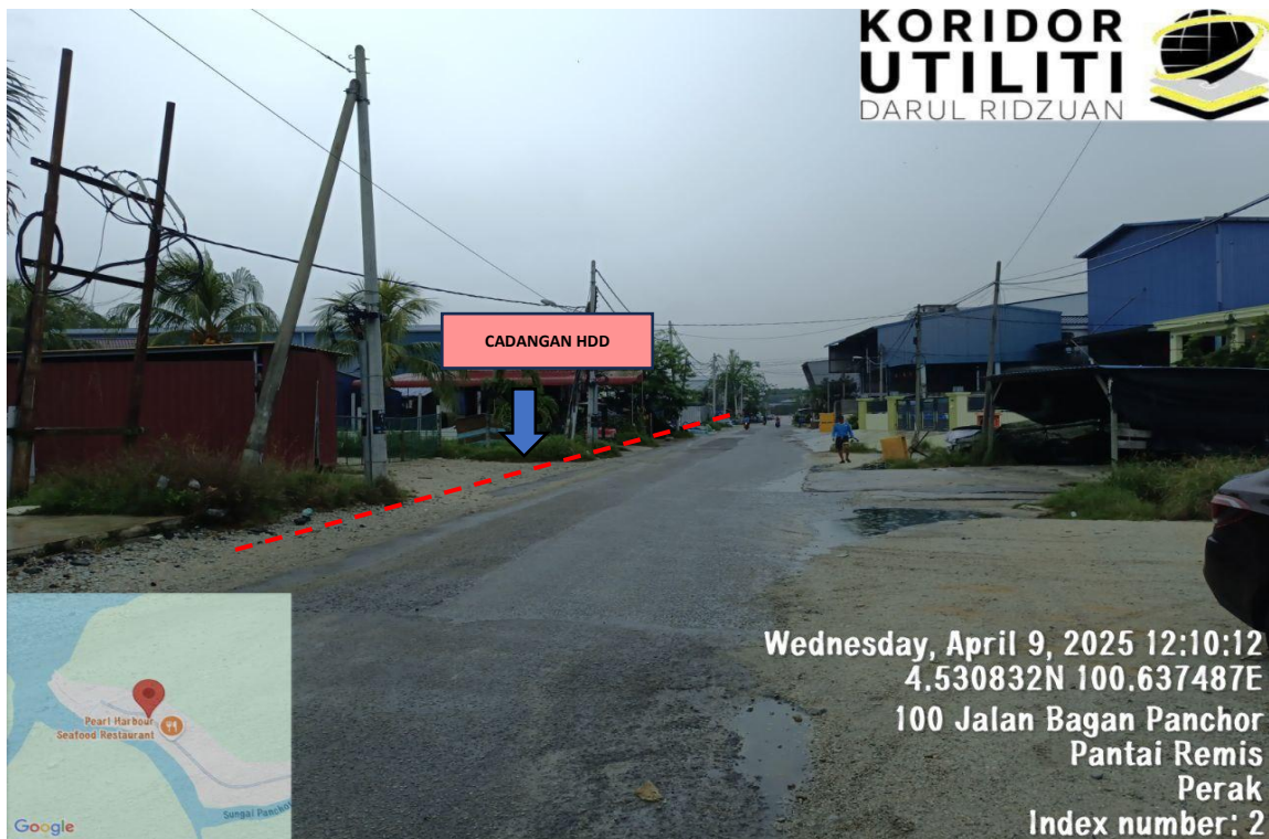
LOKASI KERJA: JALAN BAGAN PANCHOR