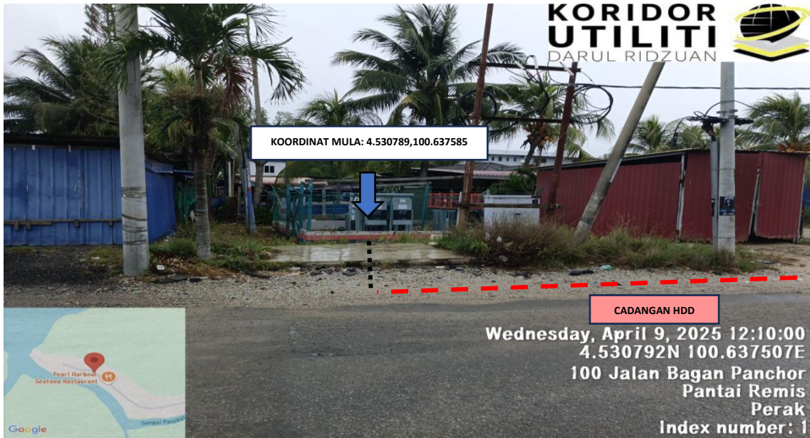
LOKASI KERJA: JALAN BAGAN PANCHOR (KOORDINAT MULA)