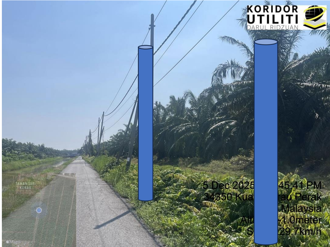
LOKASI DI JALAN KAMPUNG NIBONG HANGUS