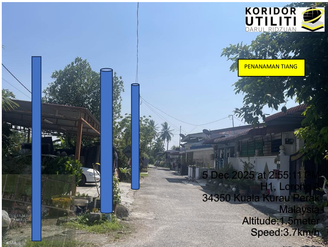
LOKASI DI JALAN TAMAN SERI KURAU