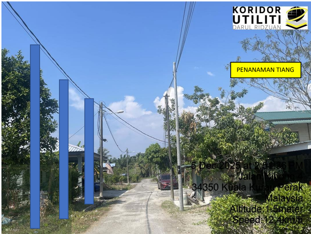
LOKASI DI JALAN KAMPUNG NIBONG HANGUS