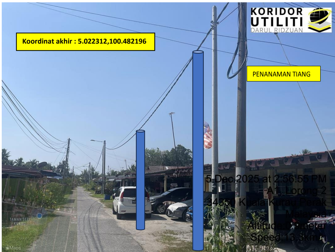
LOKASI DI JALAN TAMAN SERI KURAU