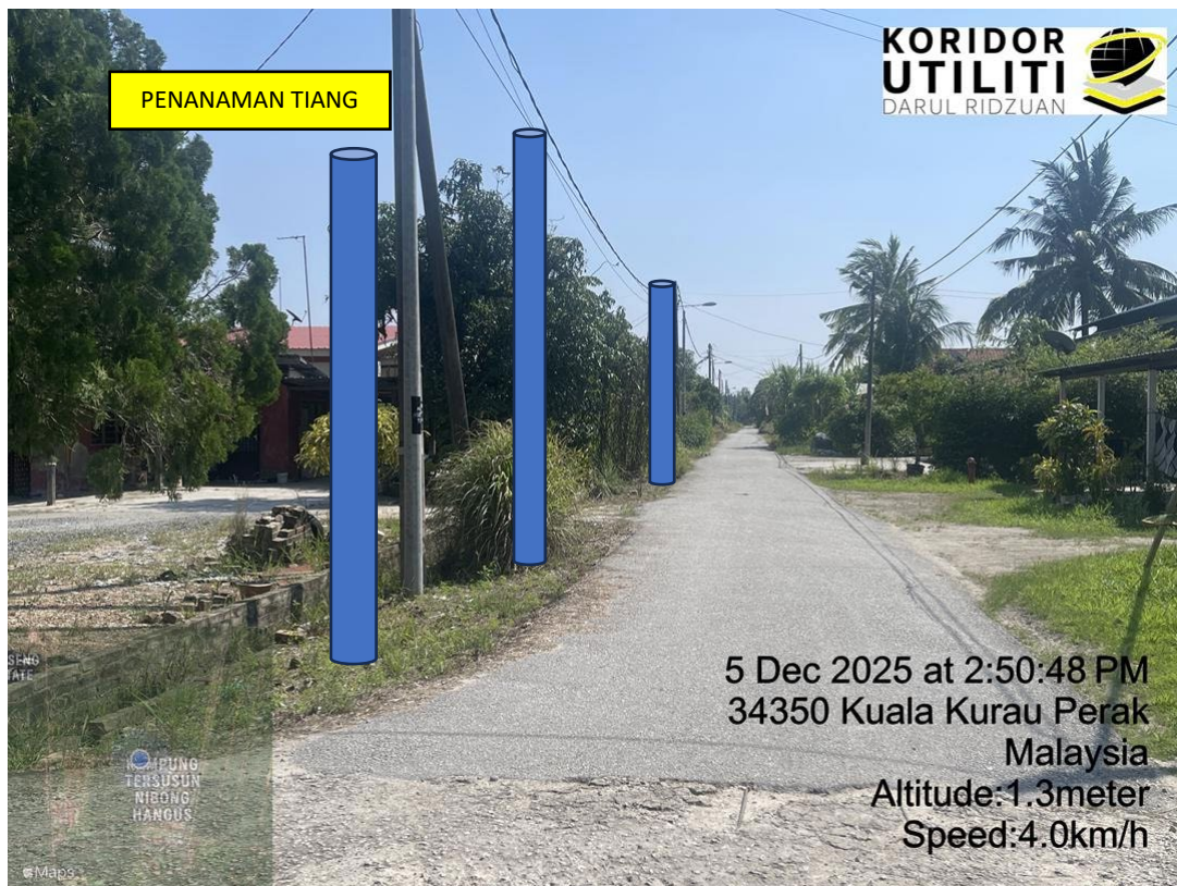
LOKASI DI JALAN KAMPUNG NIBONG HANGUS