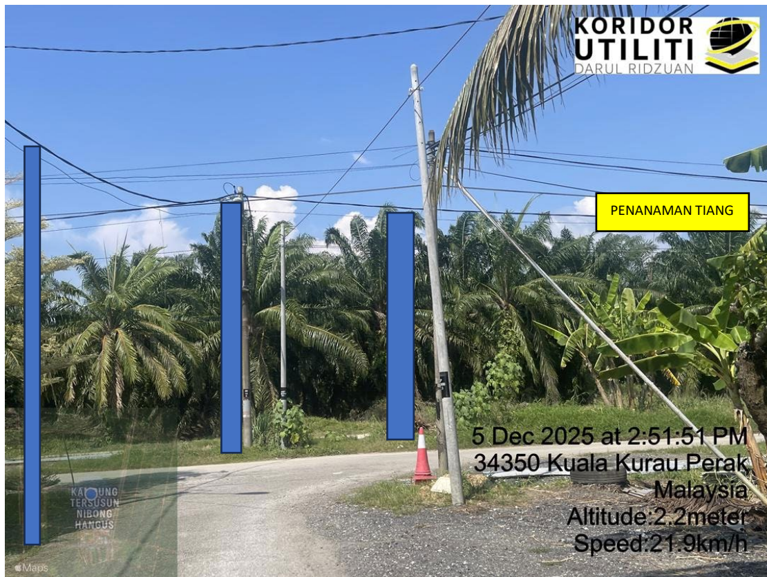
LOKASI DI JALAN KAMPUNG NIBONG HANGUS