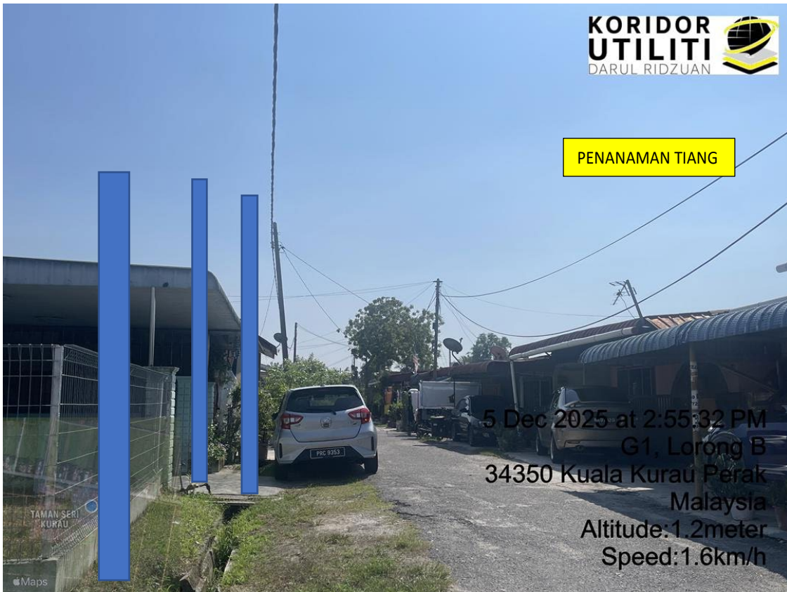
LOKASI DI JALAN TAMAN SERI KURAU