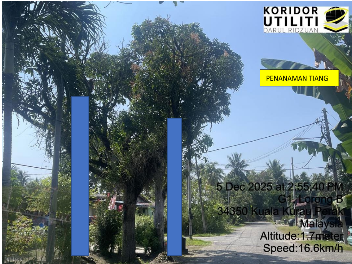
LOKASI DI JALAN TAMAN SERI KURAU