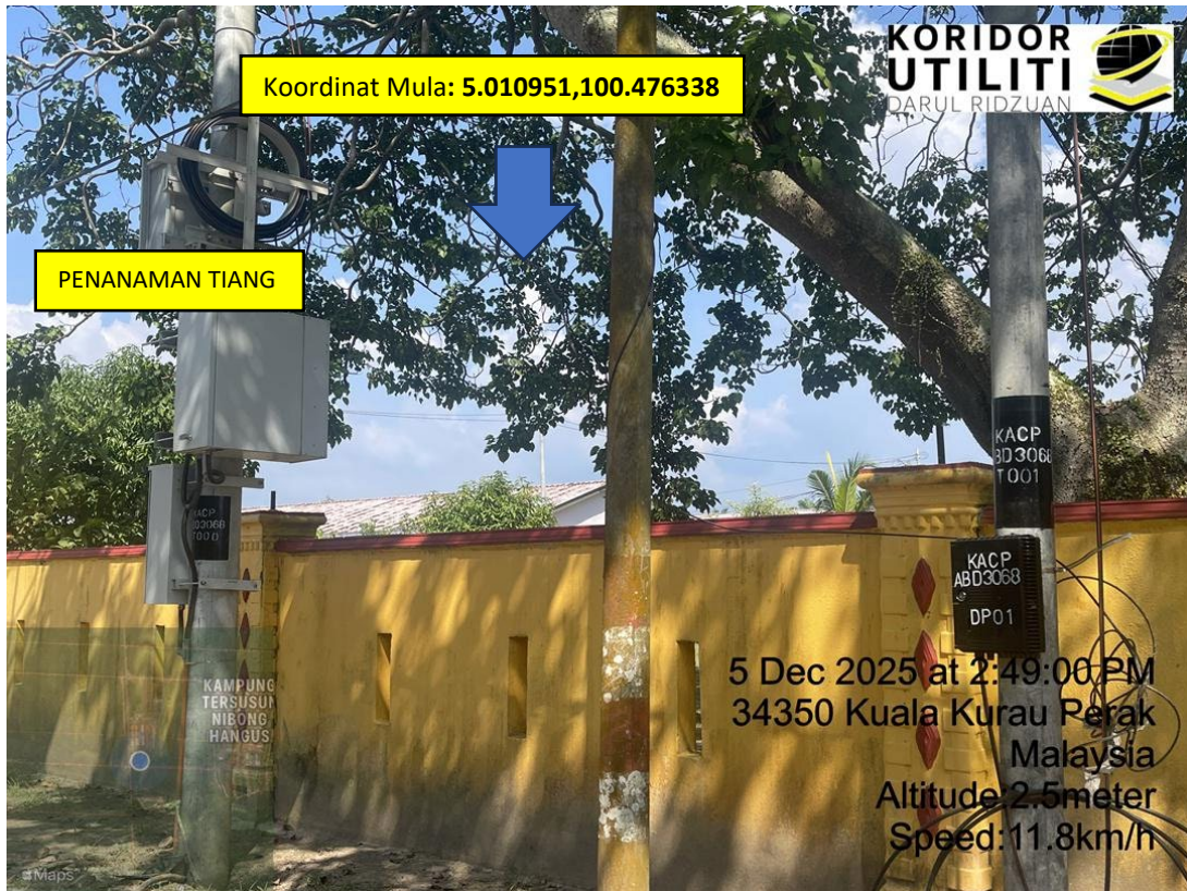
LOKASI DI JALANG JIN SENG