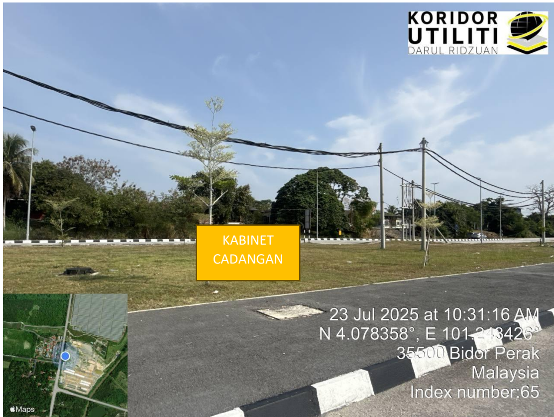
LOKASI BAGI CADANGAN KABINET TM