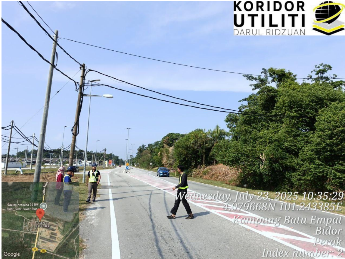
PIHAK JKR MEMBENARKAN OVERHEAD CROSSING DISEBABKAN TERDAPAT LALUAN UTILITI GAS