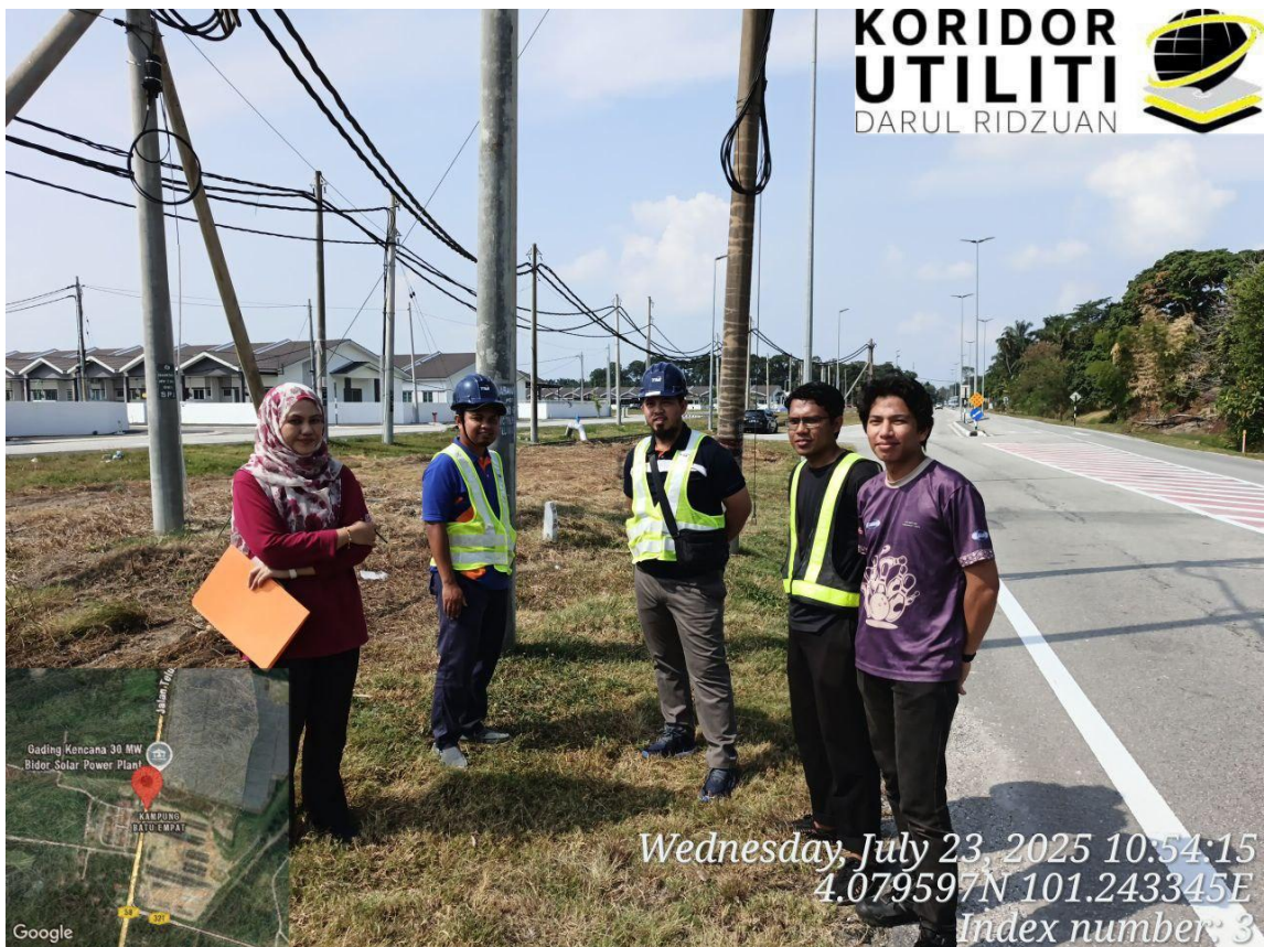
PEMERIKSAAN TAPAK BERSAMA PIHAK TM DAN KONTRAKTOR