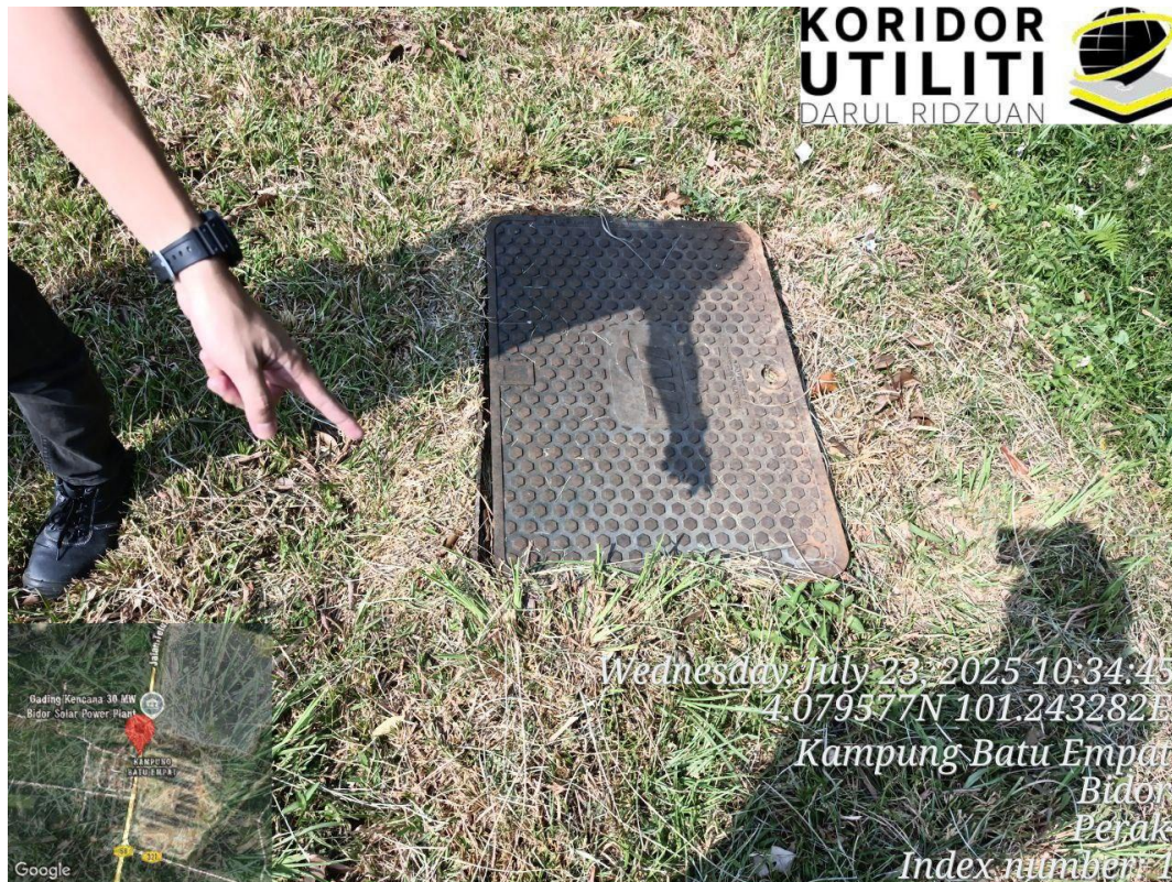
MANHOLE TM SEDIA ADA