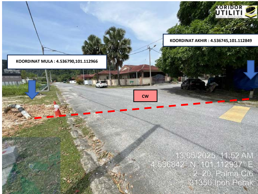
LOKASI KOORDINAT MULA DAN AKHIR LOKASI A KOREKAN TERBUKA DI JALAN PALMA C/6