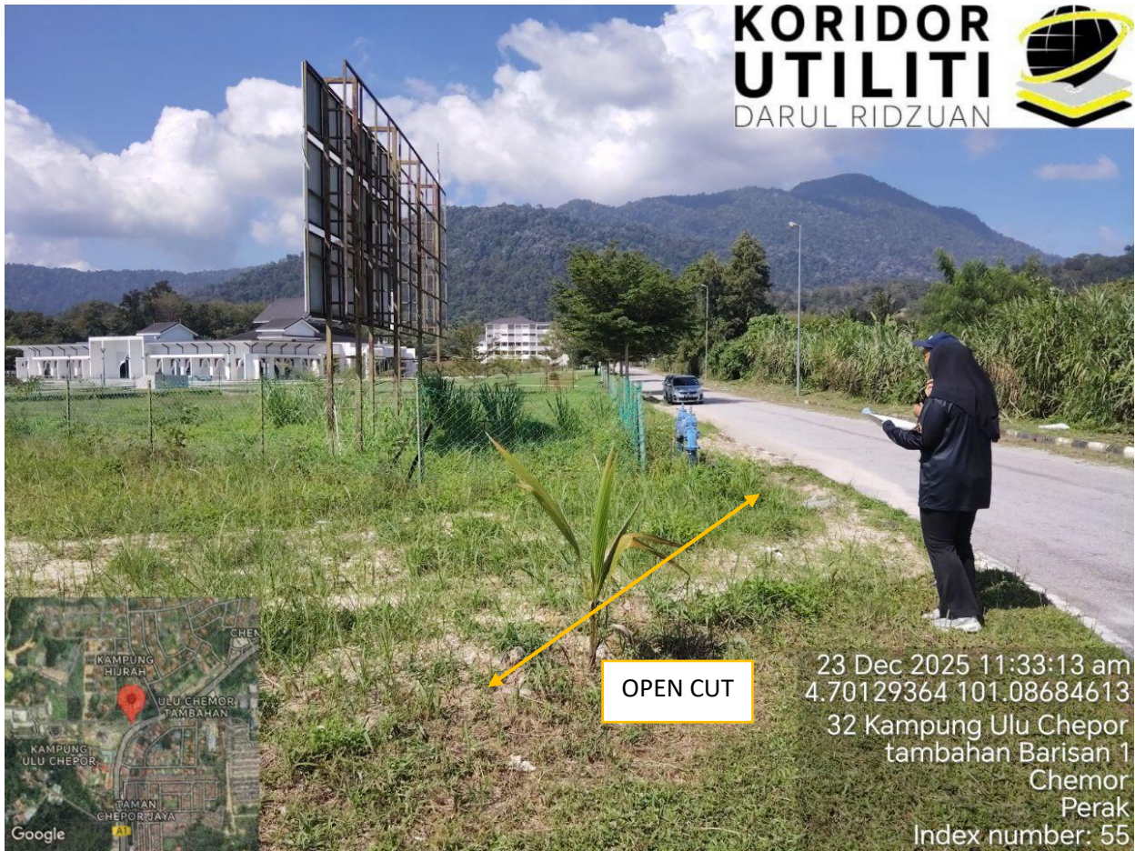
TAPPING DARI LALUAN PAIP LAP SEDIA ADA KE LALUAN PAIP BARU – KOREKAN DI BAHU JALAN SEPANJANG 12 METER