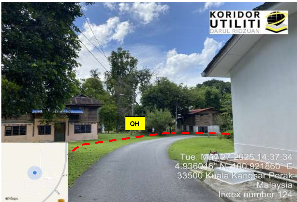
JALAN BELAKANG PEKAN