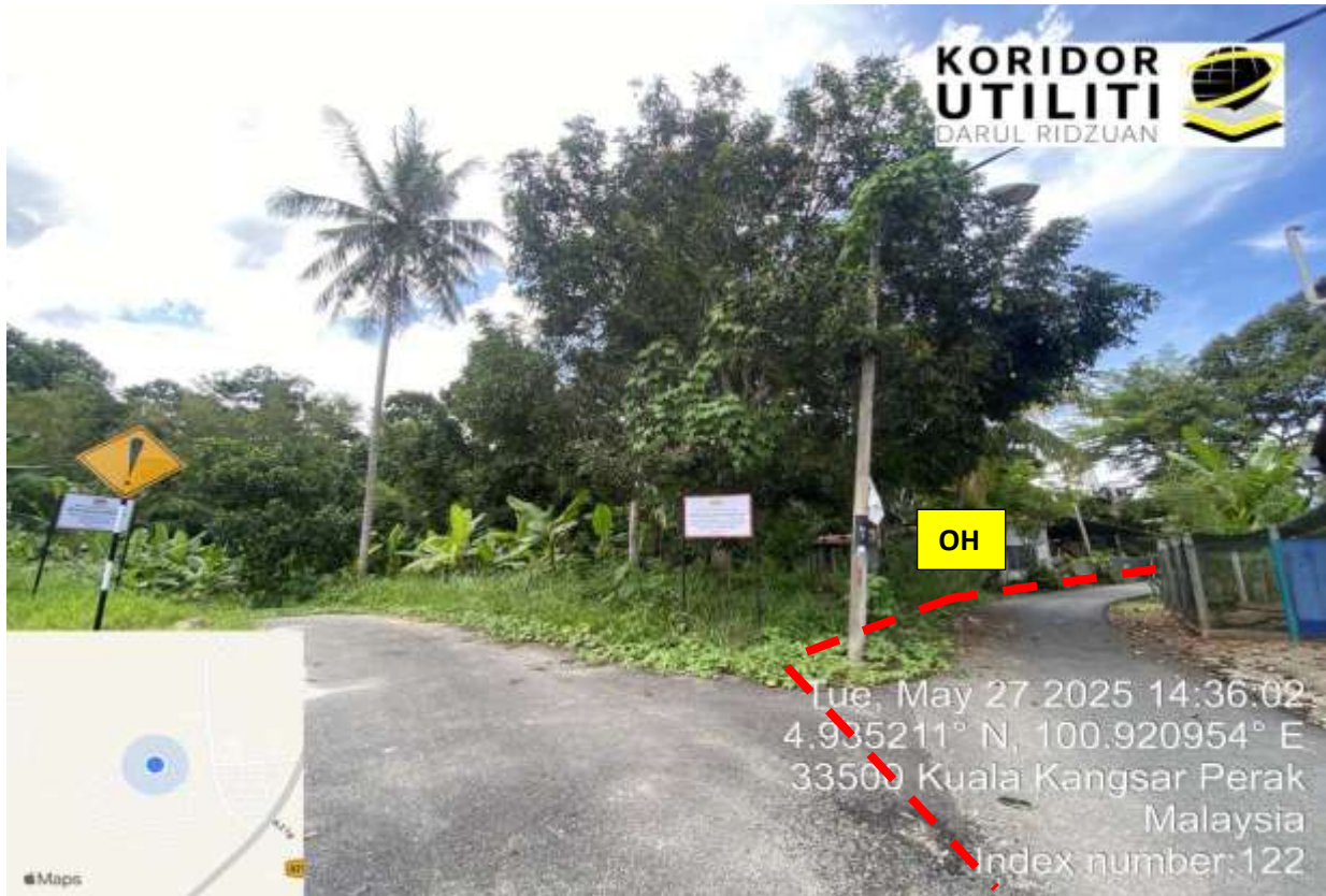
JALAN BELAKANG PEKAN