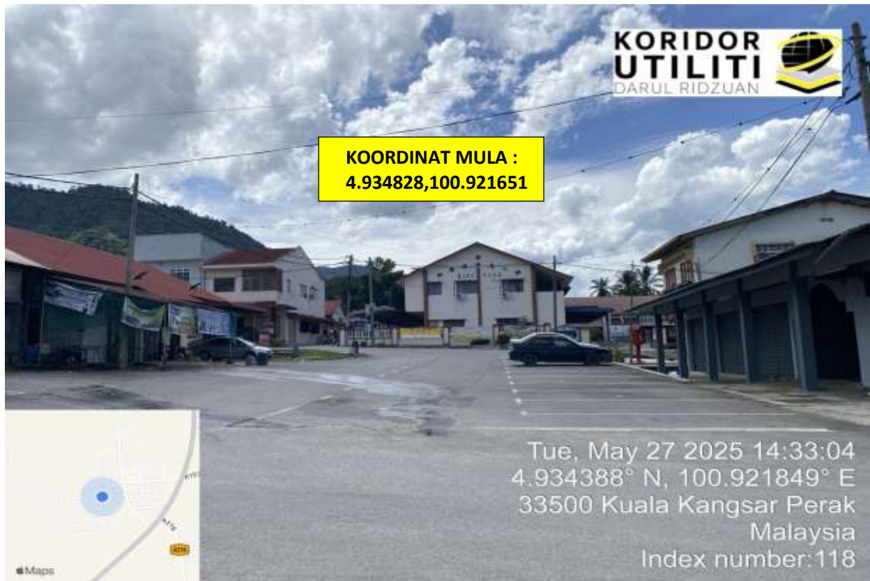
LOKASI DI HADAPAN SJKC SAUK