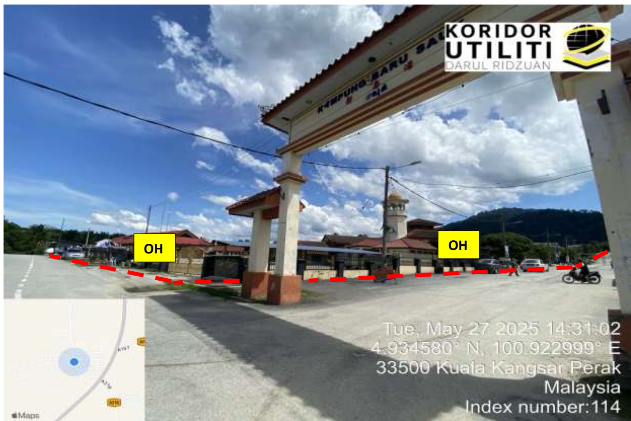
PINTU MASUK KE KAMPUNG BARU CINA SAUK