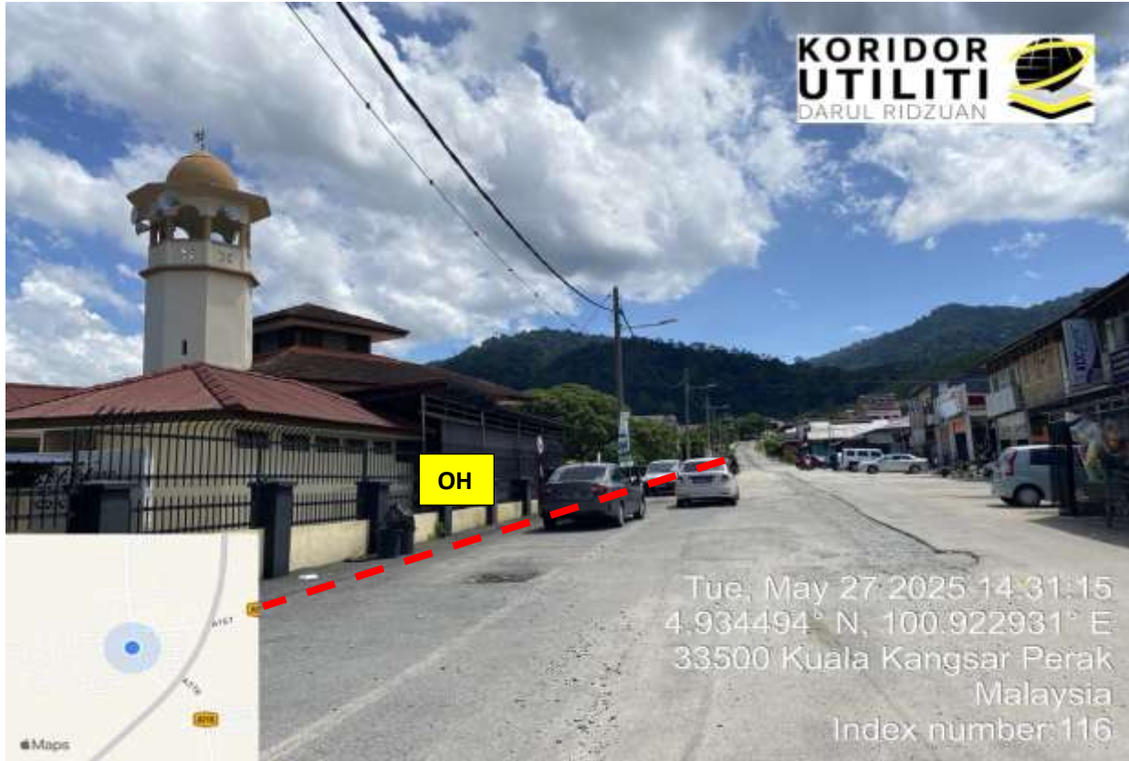
KAMPUNG BARI CINA SAUK