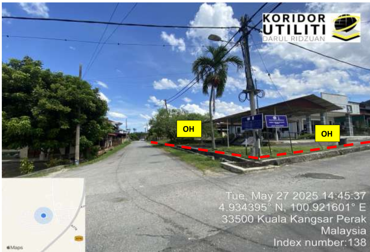
KAMPUNG BARI CINA SAUK