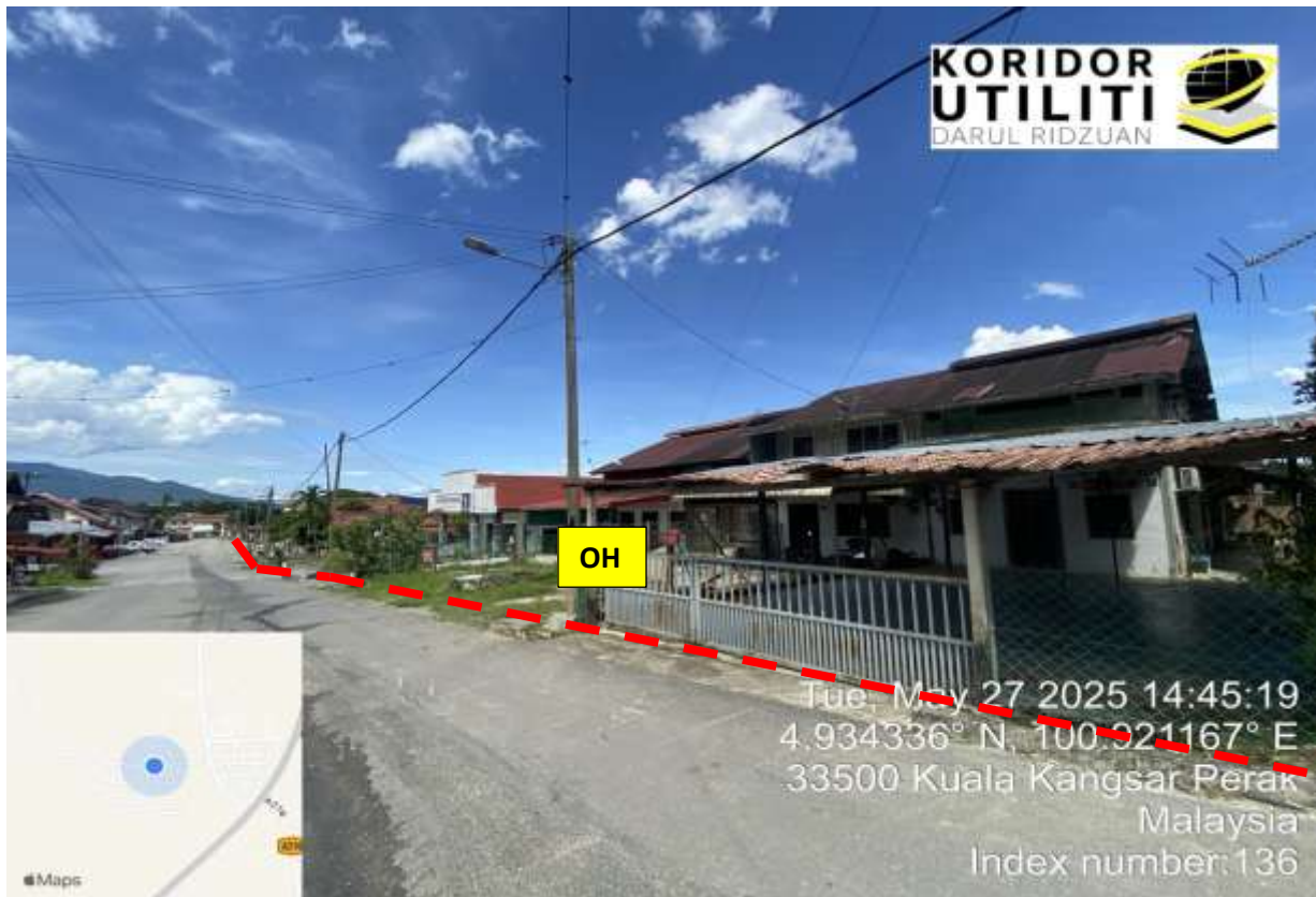
KAMPUNG BARI CINA SAUK