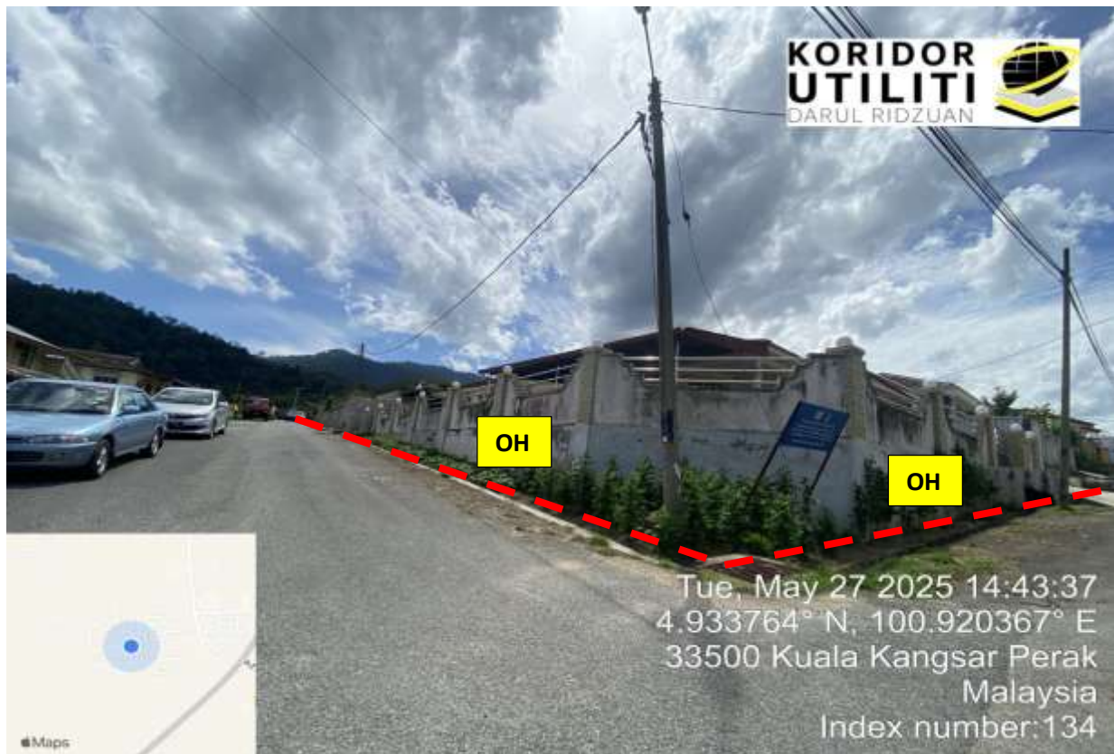
KAMPUNG BARI CINA SAUK