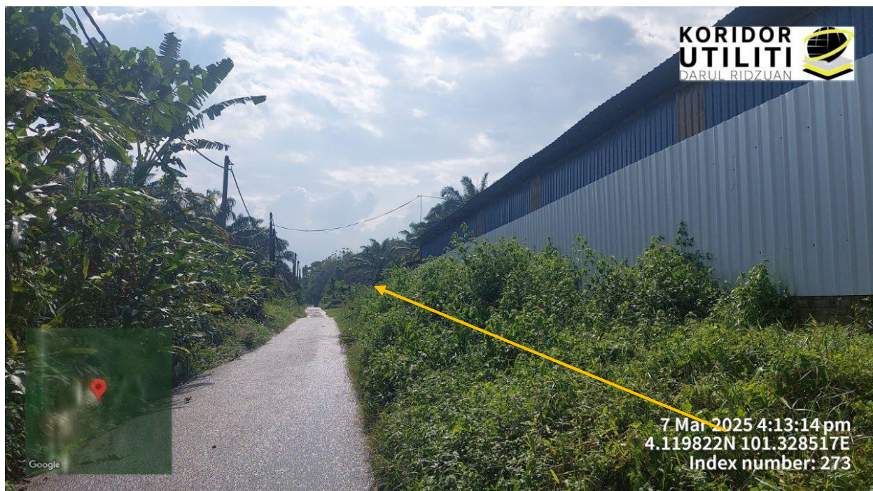
KOREKAN DI GRASS VERGE