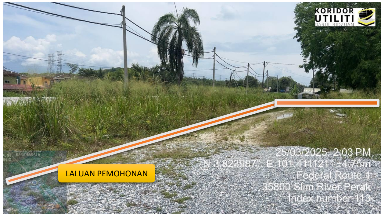
LALUAN CADANGAN KAEDAH GV