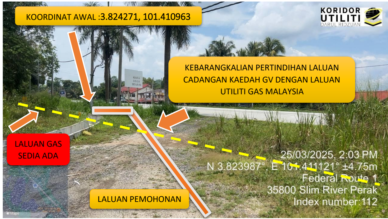
LALUAN CADANGAN KAEDAH GV