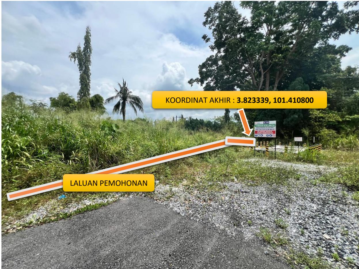
LALUAN CADANGAN KAEDAH GV