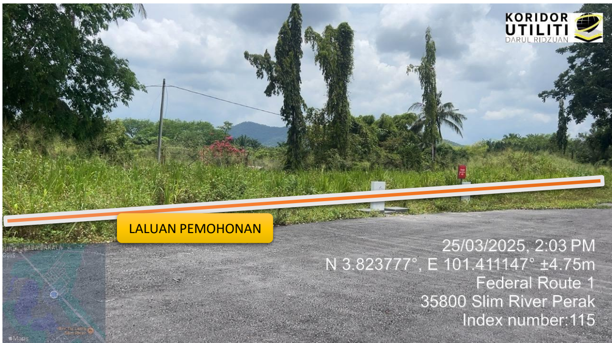
LALUAN CADANGAN KAEDAH GV