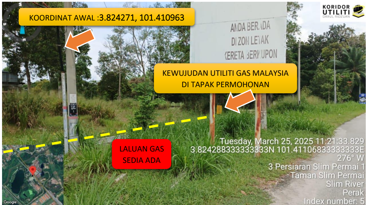
GAMBAR LOKASI TERDAPAT KEWUJUDAN UTILITI GAS MALAYSIA, MEMERLUKAN PELAN INFRASTRUKTUR UTILITI (UDM) DARIPADA KUDR