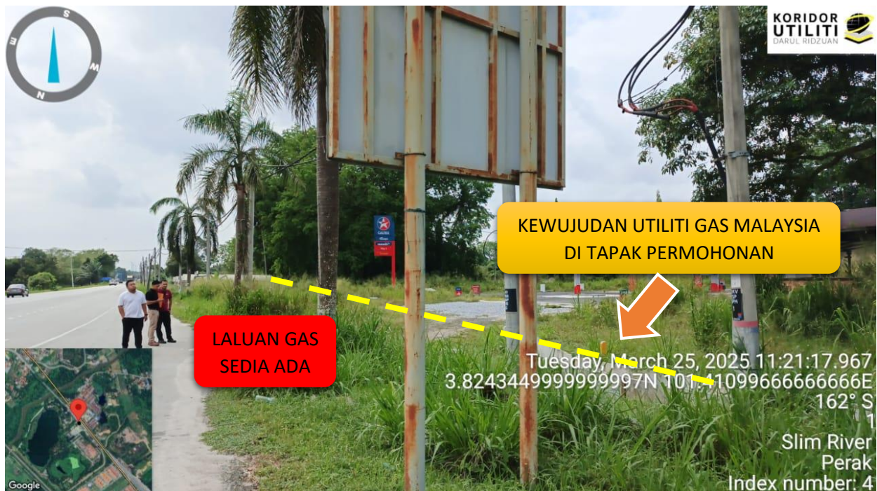
GAMBAR LOKASI TERDAPAT KEWUJUDAN UTILITI GAS MALAYSIA, MEMERLUKAN PELAN INFRASTRUKTUR UTILITI (UDM) DARIPADA KUDR