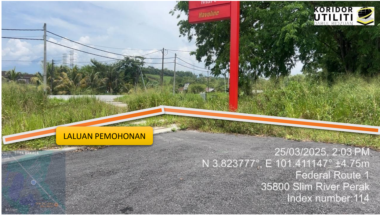
LALUAN CADANGAN KAEDAH GV