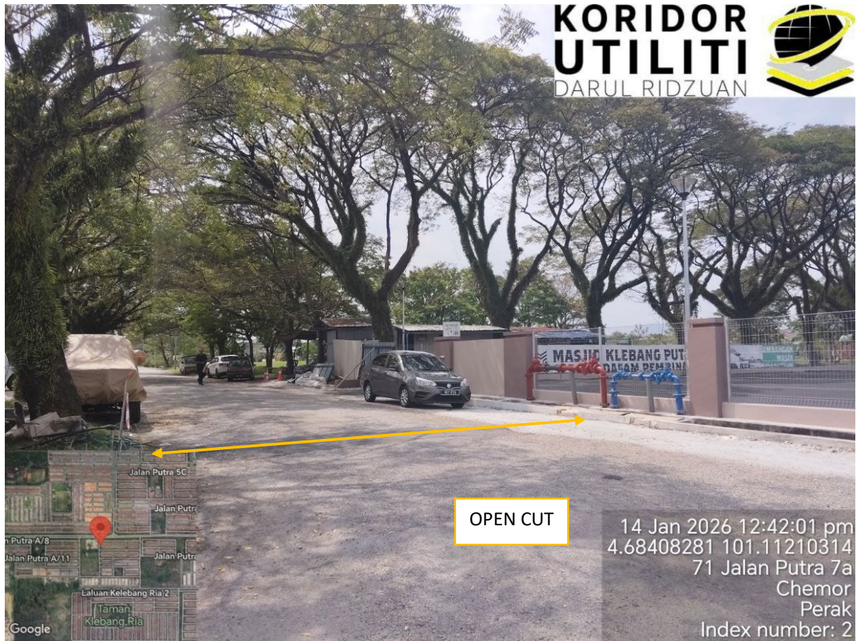
TAPPING DARI LALUAN PAIP LAP SEDIA ADA KE LALUAN PAIP BARU – KOREKAN TERBUKA CW