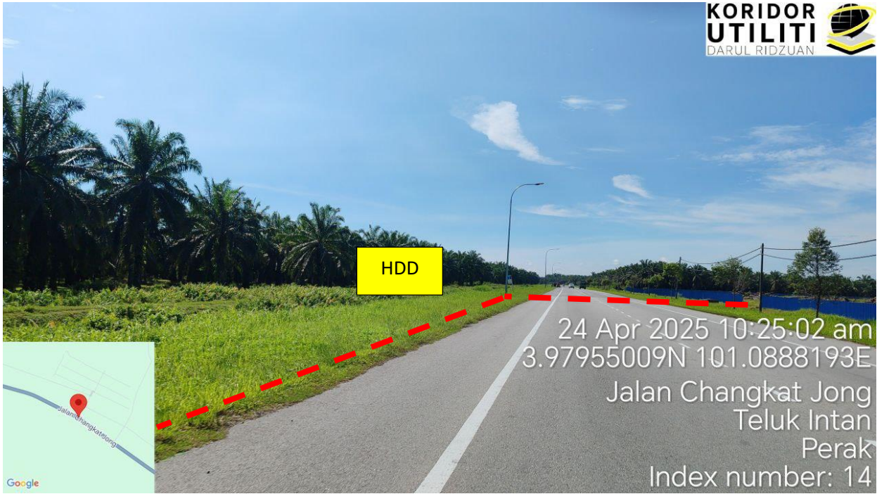
Jalan Teluk Intan – Bidor