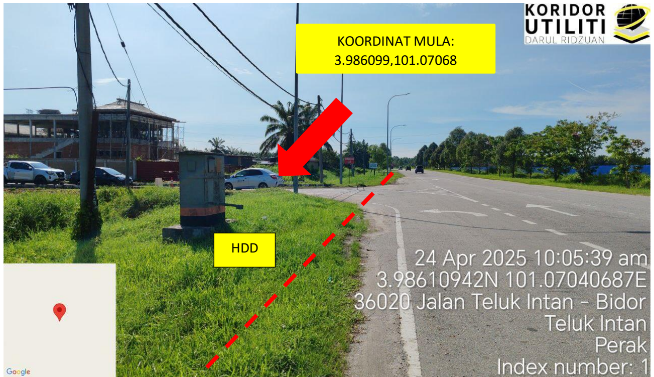
Jalan Teluk Intan – Bidor