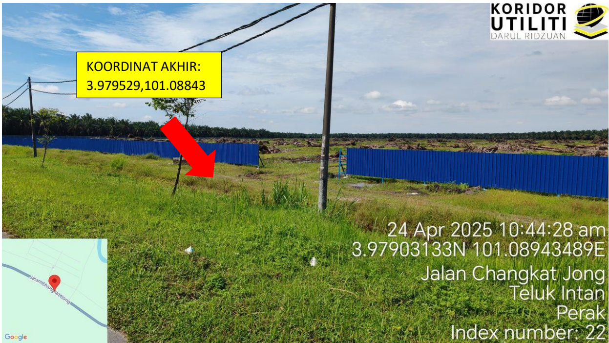
Jalan Teluk Intan- Bidor