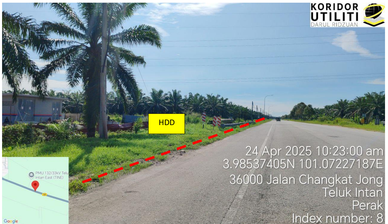
Jalan Teluk Intan – Bidor