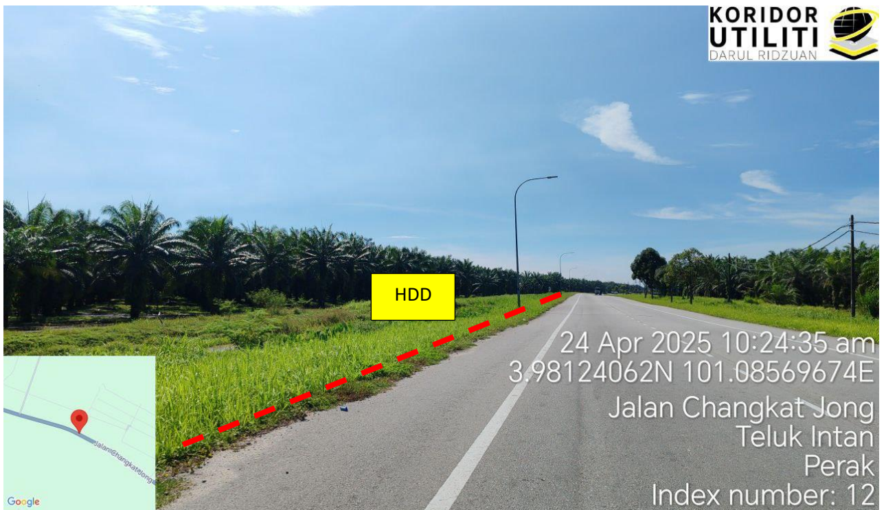
Jalan Teluk Intan – Bidor