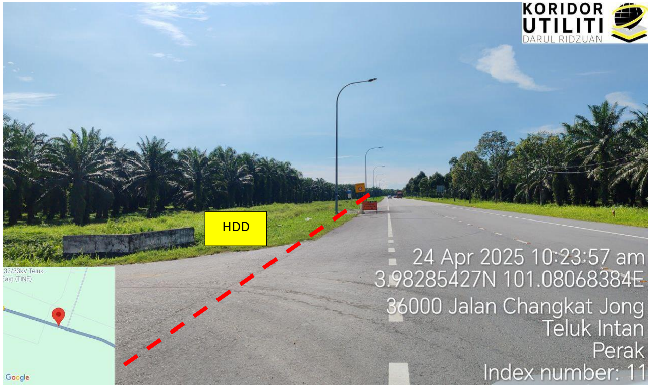
Jalan Teluk Intan – Bidor